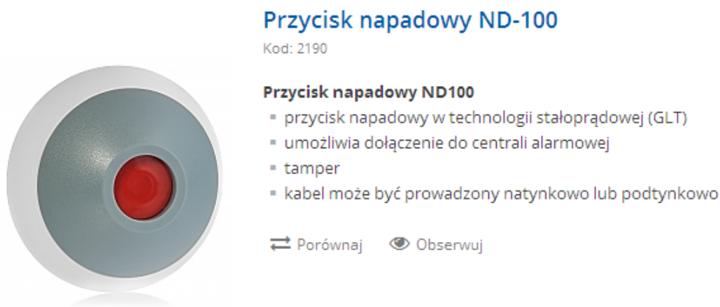
Zdjęcie nr 1 – Przykład planowanego przycisku napadowego