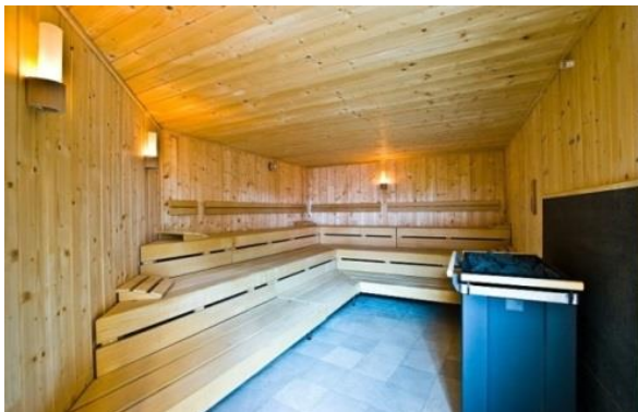
Przykładowe zdjęcie sauny

Do wewnętrznego wyłożenia ścian i sufitu będą wykorzystane profile desek o łagodnych liniach ze szczególnie długimi wypustami i głębokimi rowkami ze świerku skandynawskiego ręcznie ciosanego.