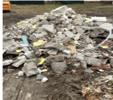
Zadanie nr 6