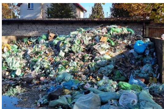
Zadanie nr 3