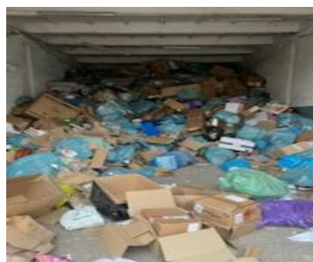
Zadanie nr 4