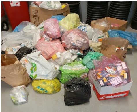
Zadanie nr 7