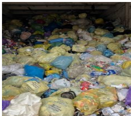
Zadanie nr 2