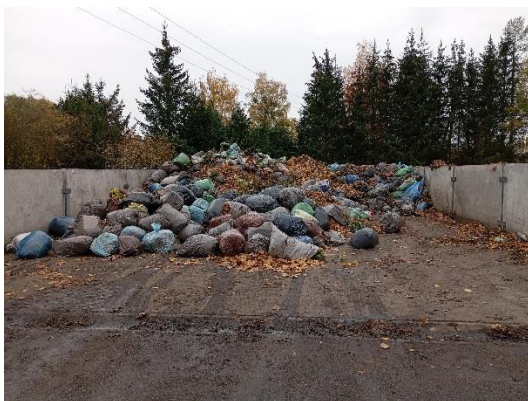
Zadanie nr 1