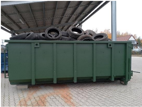
Zadanie nr 5