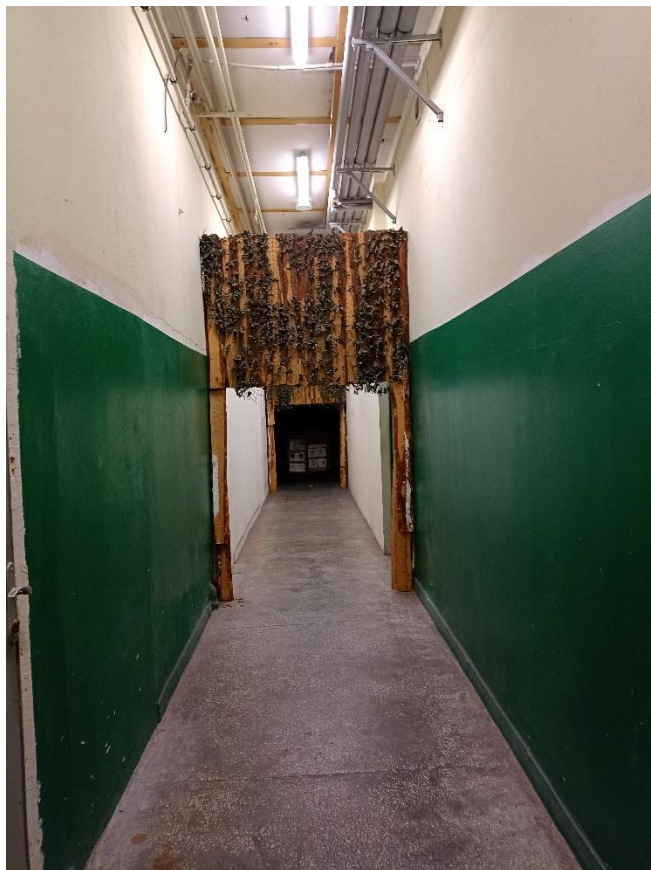
6. Zaplecze strzelnicy pneumatycznej (siłownia)