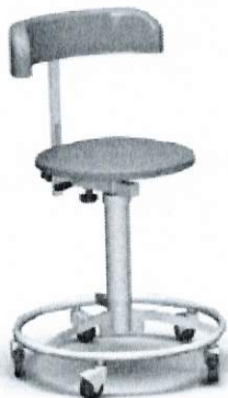
Na rysunku wersja bez podłokietników

Taboret z oparciem, siedziskiem i podłokietnikami (wszystkie wskazane elementy krzesła tapicerowane materiałem typu skaj). Siedzisko okrągłe o średnicy 350 mm. Siedzisko odporne na działanie środków dezynfekcyjnych stosowanych powszechnie na salach operacyjnych. Kolor tapicerki – zieleń medyczna (standardowo) lub inny uzgodniony z Zamawiającym. Wysokość siedziska podnoszona pneumatycznie (ręcznie za pomocą sprężyny gazowej). Oparcie regulowane w dwóch płaszczyznach (górną-dół, przód-tył). Podstawa trójramienna z 5 kółkami fi 50 mm (w tym dwa z blokadą). Oponki wykonane z materiału, który nie brudzi podłoża. Taboret z obręczą pod nogi. Dopuszczalne obciążenie 135 kg. Konstrukcja wykonana ze stali nierdzewnej w gatunku 1.4301 (304). Wszystkie krawędzie zaokrąglone, bezpieczne. Podstawa fi 480mm, zakres regulacji 490/630mm.