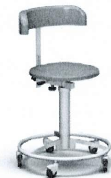
Na rysunku wersja bez podłokietników

Taboret z oparciem, siedziskiem i podłokietnikami (wszystkie wskazane elementy krzesła tapicerowane materiałem typu skaj). Siedzisko okrągłe o średnicy 350 mm. Siedzisko odporne na działanie środków dezynfekcyjnych stosowanych powszechnie na salach operacyjnych. Kolor tapicerki – zieleń medyczna (standardowo) lub inny uzgodniony z Zamawiającym. Wysokość siedziska podnoszona pneumatycznie (ręcznie za pomocą sprężyny gazowej). Oparcie regulowane w dwóch płaszczyznach (górną-dół, przód-tył). Podstawa trójramienna z 5 kółkami fi 50 mm (w tym dwa z blokadą). Oponki wykonane z materiału, który nie brudzi podłoża. Taboret z obręczą pod nogi. Dopuszczalne obciążenie 135 kg. Konstrukcja wykonana ze stali nierdzewnej w gatunku 1.4301 (304). Wszystkie krawędzie zaokrąglone, bezpieczne. Podstawa fi 480mm, zakres regulacji 490/630mm.