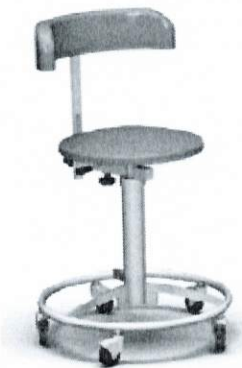
Na rysunku wersja bez podłokietników

Taboret z oparciem, siedziskiem i podłokietnikami (wszystkie wskazane elementy krzesła tapicerowane materiałem typu skaj). Siedzisko okrągłe o średnicy 350 mm. Siedzisko odporne na działanie środków dezynfekcyjnych stosowanych powszechnie na salach operacyjnych. Kolor tapicerki – zieleń medyczna (standardowo) lub inny uzgodniony z Zamawiającym. Wysokość siedziska podnoszona pneumatycznie (ręcznie za pomocą sprężyny gazowej). Oparcie regulowane w dwóch płaszczyznach (górną-dół, przód-tył). Podstawa trójramienna z 5 kółkami fi 50 mm (w tym dwa z blokadą). Oponki wykonane z materiału, który nie brudzi podłoża. Taboret z obręczą pod nogi. Dopuszczalne obciążenie 135 kg. Konstrukcja wykonana ze stali nierdzewnej w gatunku 1.4301 (304). Wszystkie krawędzie zaokrąglone, bezpieczne. Podstawa fi 480mm, zakres regulacji 490/630mm.