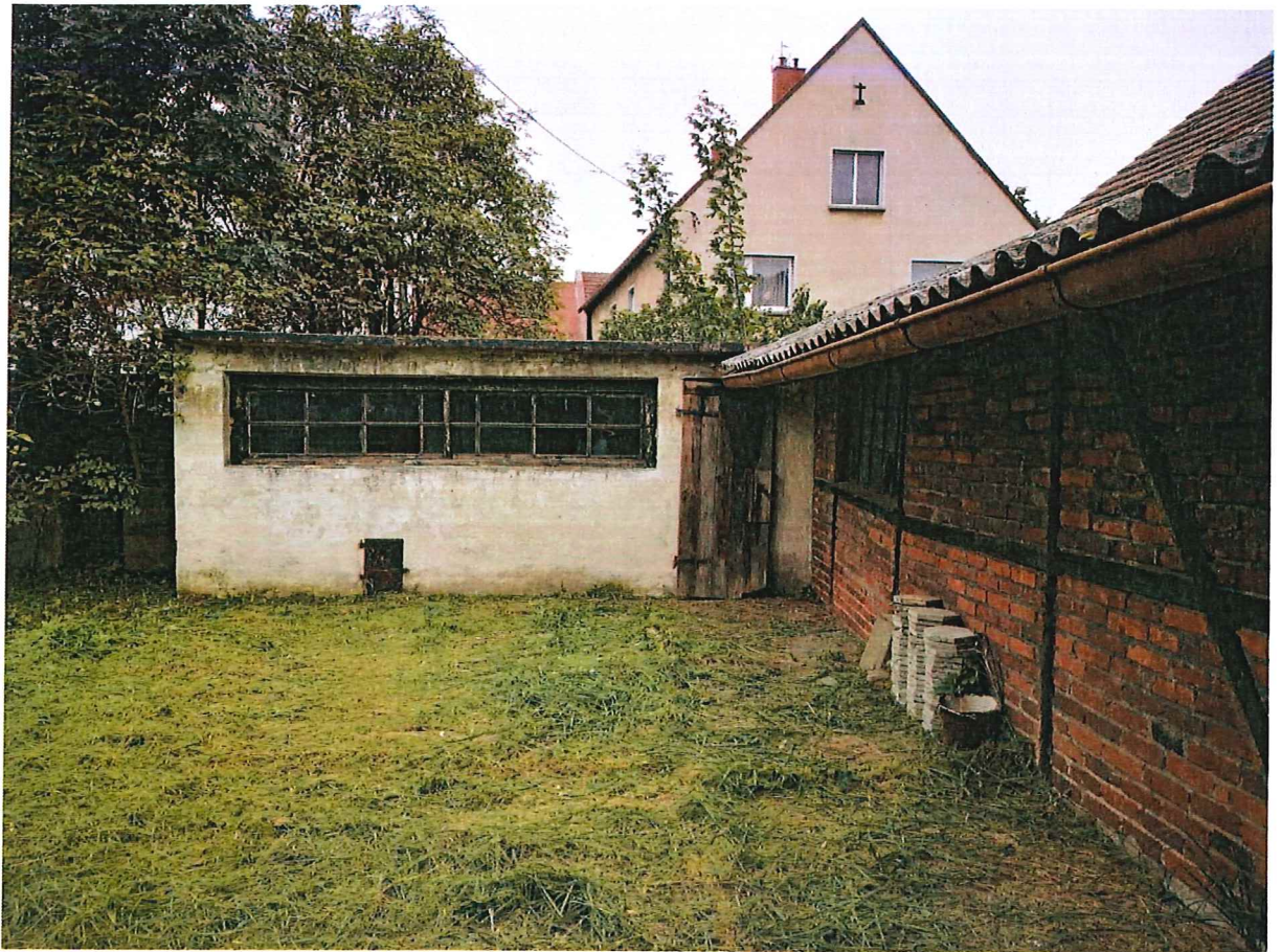
Zdjęcie 1 Na wprost kurnik przewidziany do rozbiórki