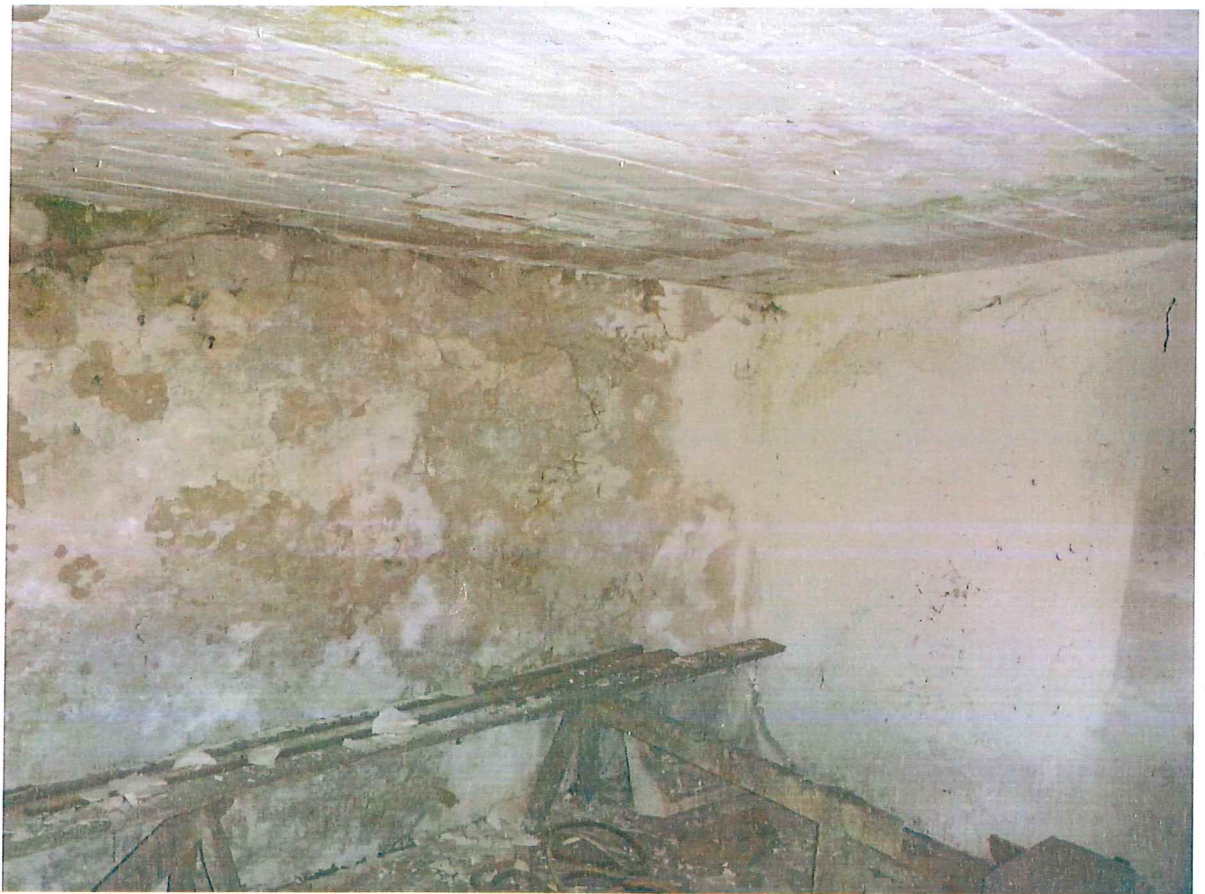
Zdjęcie 2 Widok wnętrza kurnika