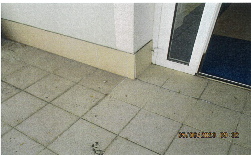
Zdjęcie posadzki trasy -stan aktualny od strony korytarza na I piętrze.