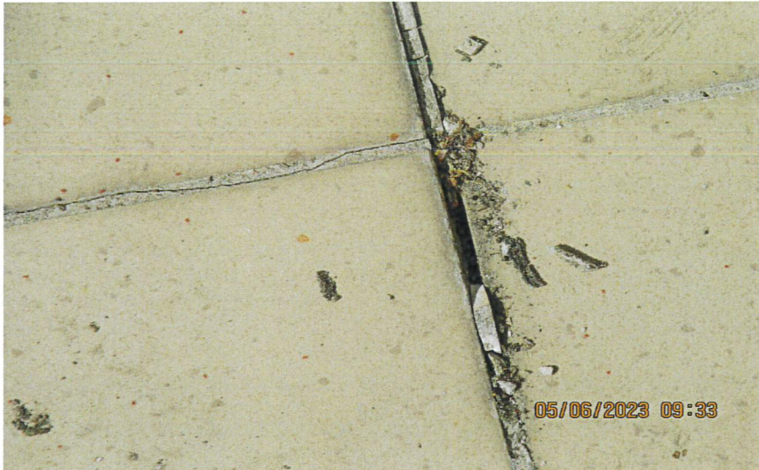
Zdjęcie posadzki trasy -stan aktualny.