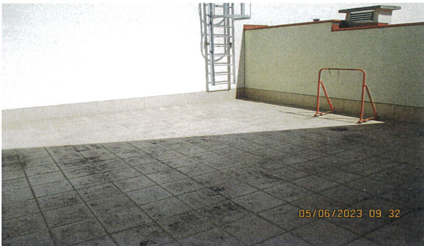
Zdjęcie posadzki trasy -stan aktualny.