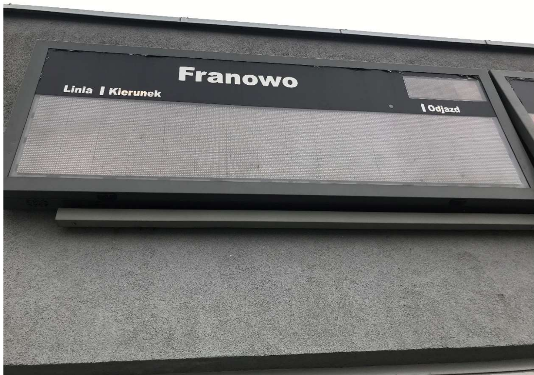
11) Franowo (elewacja autobusy) kier. Centrum