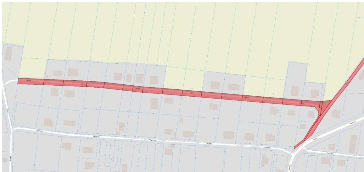
Fot. 3 – oznaczenie działek

Przedmiotem zamówienia jest zaprojektowanie oraz wykonanie robót i obejmuje: