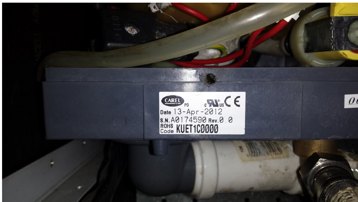
Tabliczka znamionowa na podstawie zbiornika nawilzacza.