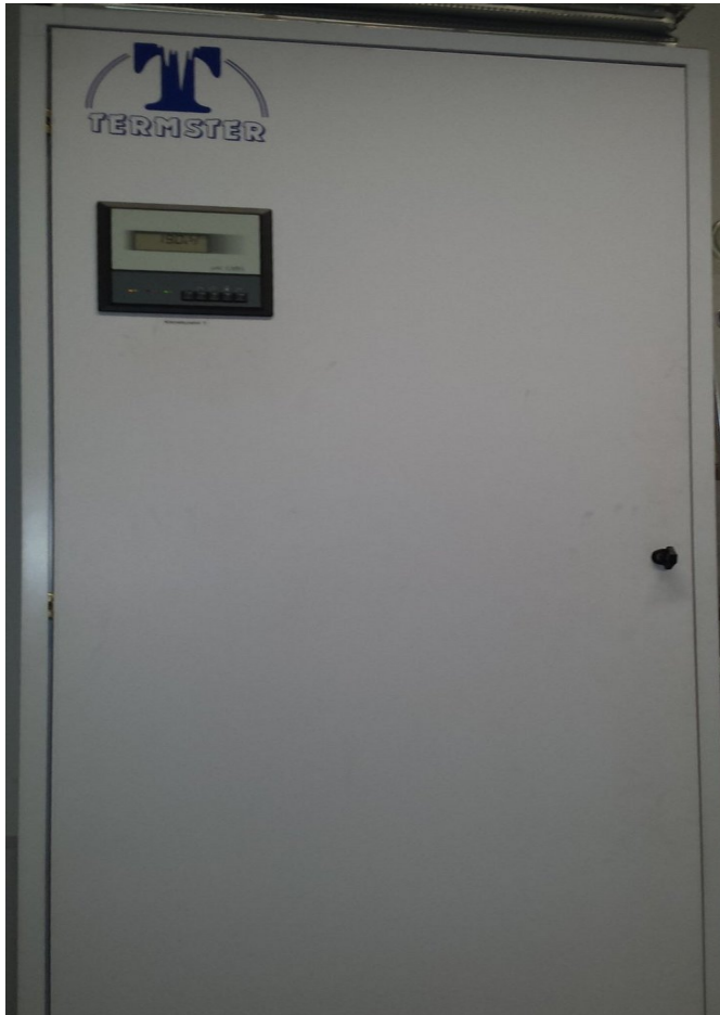
Widok szafy klimatyzacji od frontu.