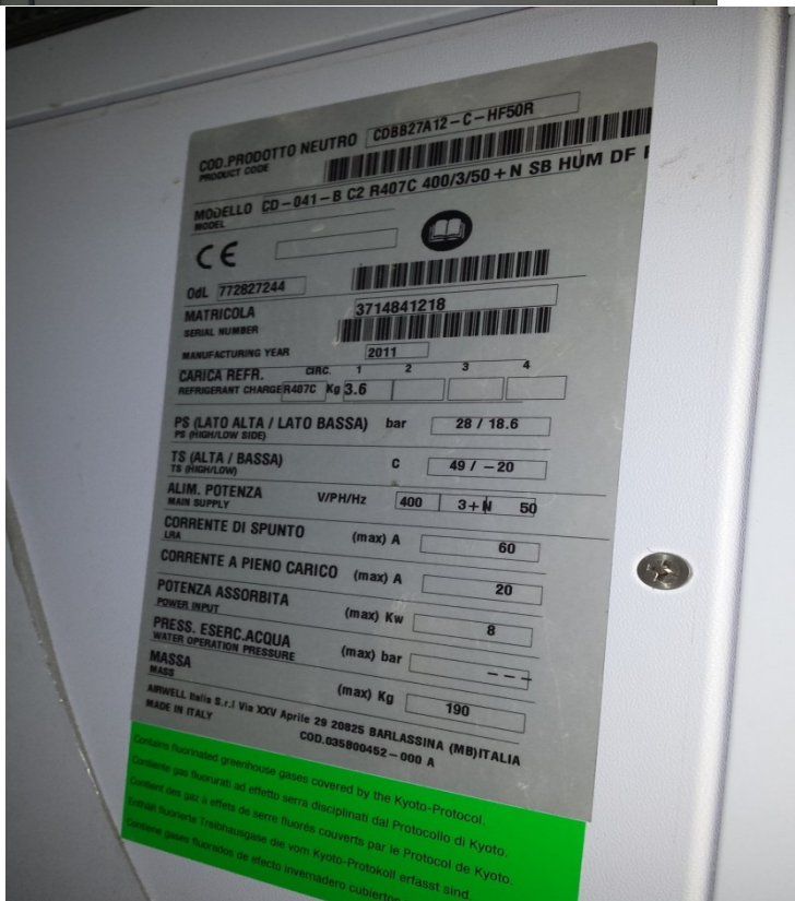
Tabliczka znamionowa szafy klimatyzacji.