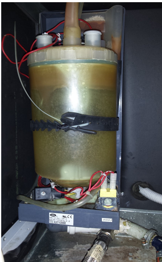
Zbiornik nawilzacza wraz z podstawą i elektrozaworami.