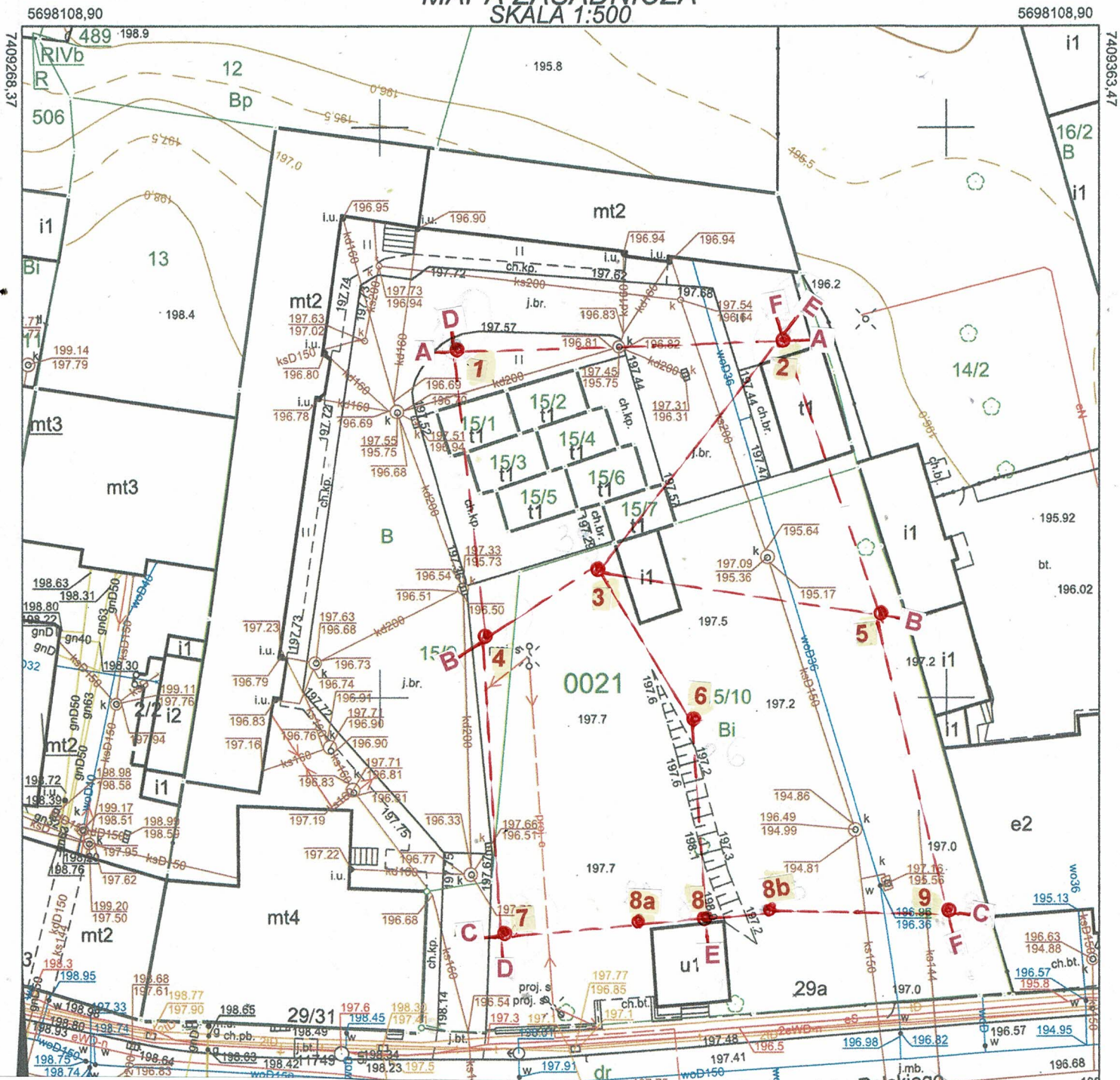
Zal. nr 4