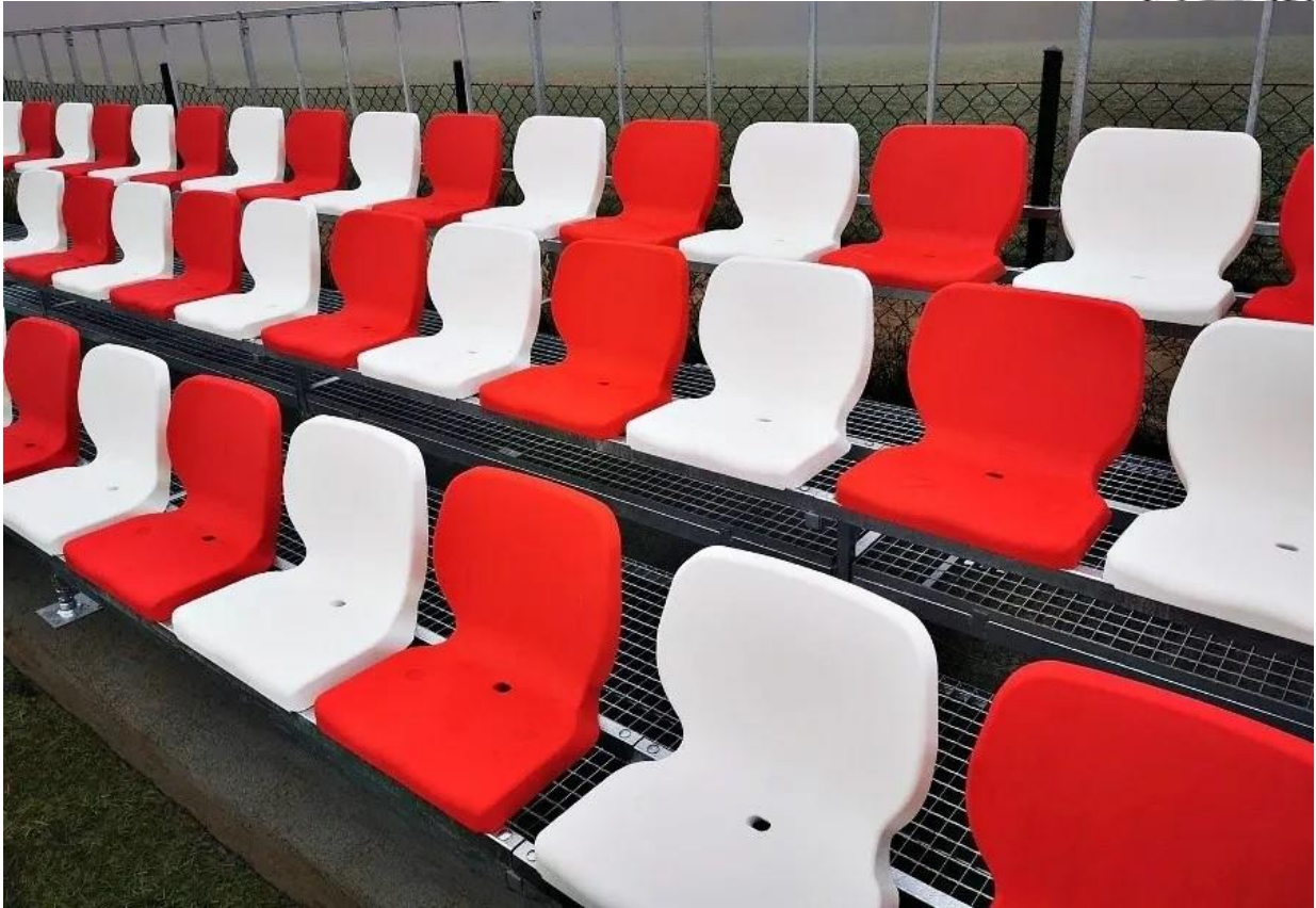
Trybuny piłkarskie 3 rzędowe, stadionowe, sportowe | np.: trybunysportowe.pl