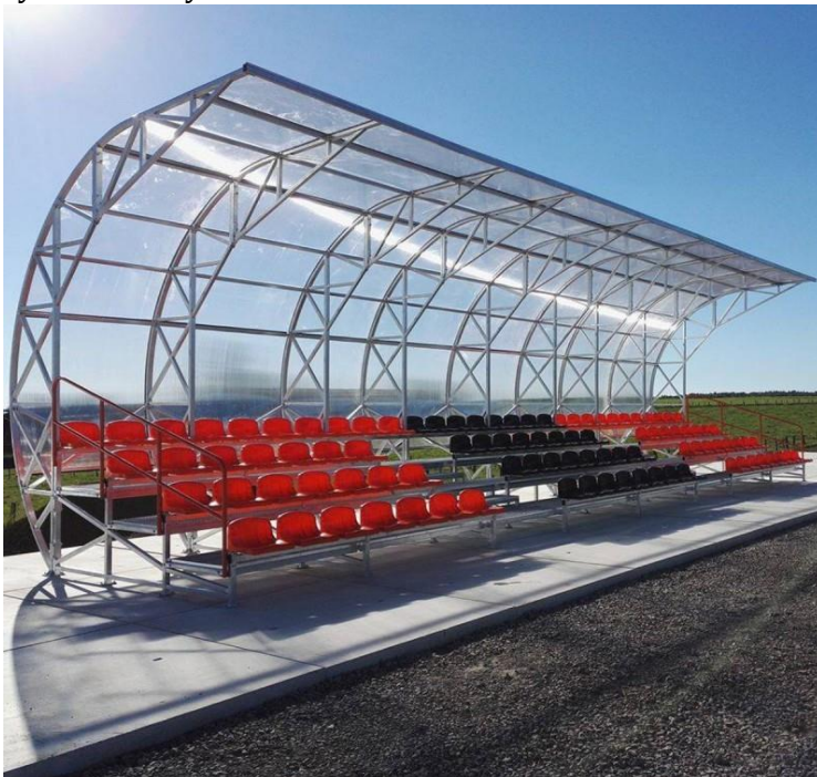
Trybuna stała zadaszona 3- lub 4-rzędowa - do użytku na zewnątrz (np.: pesmenpol.pl )