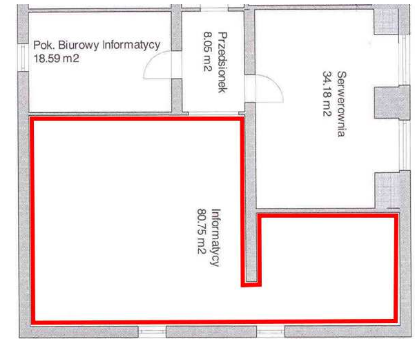
POKÓJ NR 3