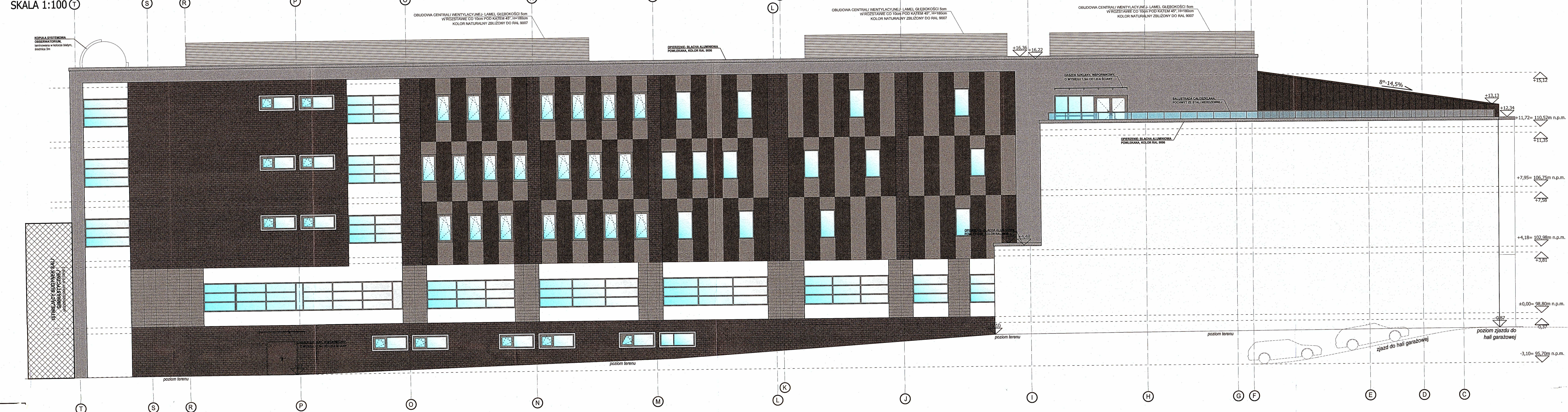
ELEVACJA ZACHODNIA SKALA 1:100