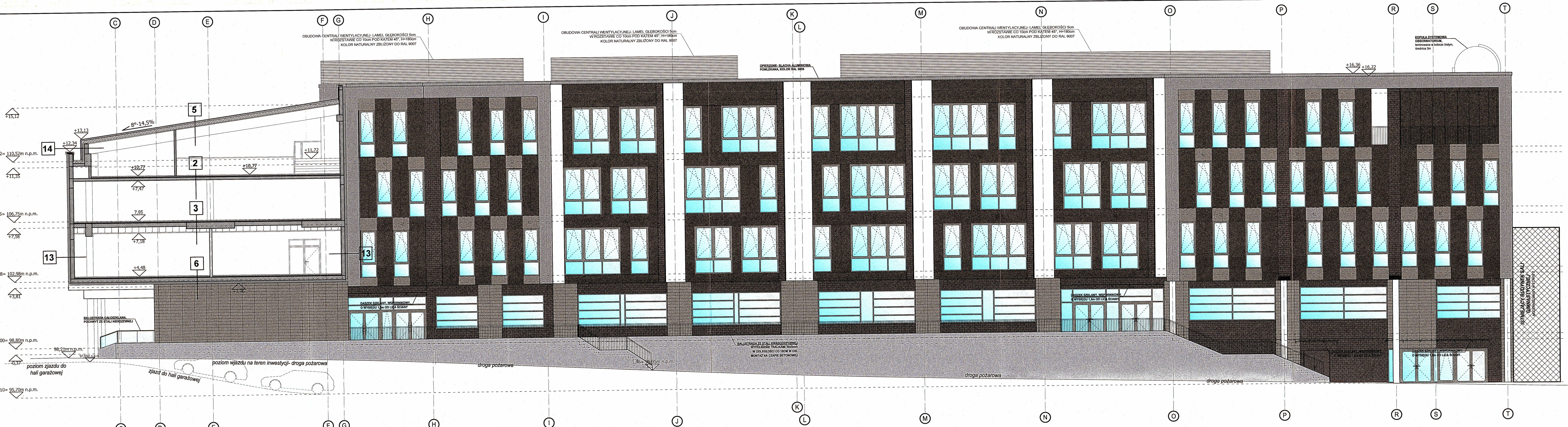
ELEVACJA WSCHODNIA, PRZEKRÓJ B-B SKALA 1:100