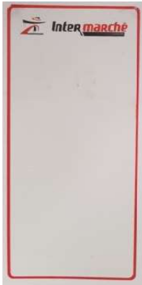
przykład zadruku 48x100mm