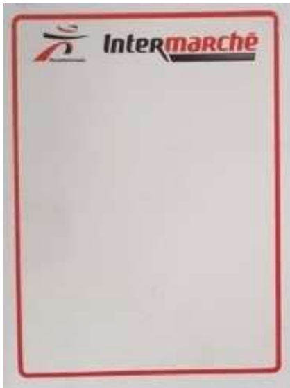
przykład zadruku 58x80mm