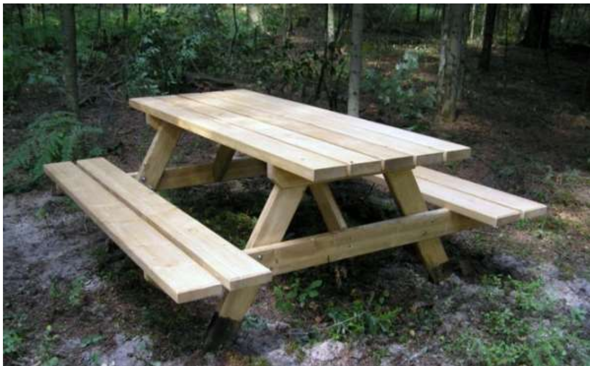
Zdjęcie nr 3 ławostół – widok ogólny.

Dane techniczne ławaka: długość: 160 cm, szerokość: 70 cm, wysokość: 90 cm. Konstrukcja: stal gr. 6 mm, rura ok. \varnothing 139,7 x 4 mm, stal ocynkowana i malowana proszkowo na kolor czarny, deski ławkowe z drewna świerkowego lub jesionowego, podwójnie impregnowane, 2 x malowane lakierobejcą. Montaż: montaż poprzez przykręcenie do podłoża „podestu”.