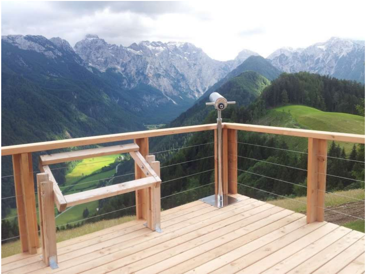
Zdjęcie nr 4 – luneta widokowa – widok ogólny.

UWAGA: Odbiór prac będących przedmiotem niniejszego zapytania nastąpi protokołem zdawczo-odbiorczym.