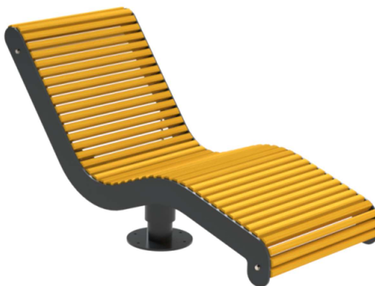
Zdjęcie nr 2 – leżak parkowy obrotowy – widok ogólny