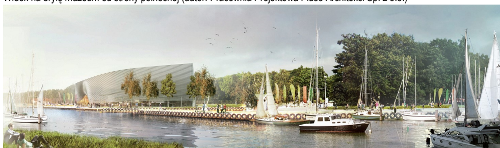
Widok na bryłę muzeum od strony południowej w kontekście otoczenia (autor: Pracownia Projektowa Plus3 Architekci Sp. z o.o.)