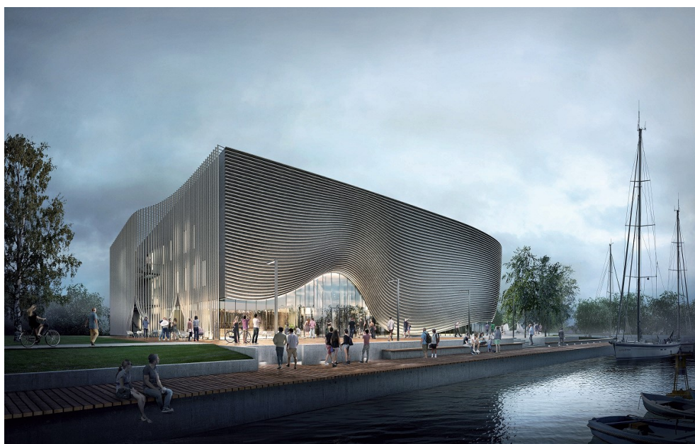
Widok na bryłę muzeum od strony północnej (autor: Pracownia Projektowa Plus3 Architekci Sp. z o.o.)