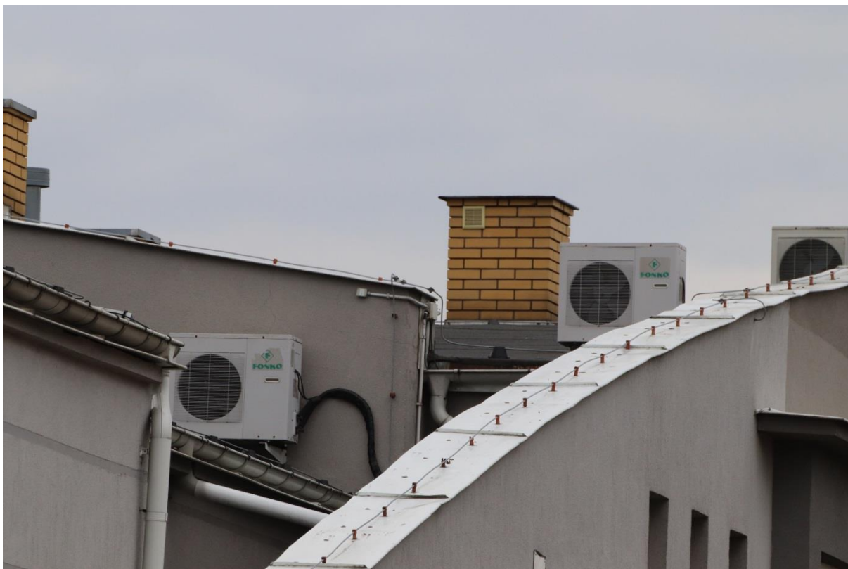
Na dachu budynku nie stwierdzono oznak gniazdowania ptaków i kryjówek nietoperzy