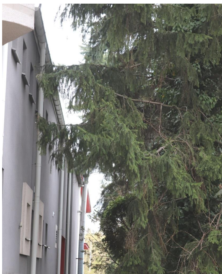
Wschodnia elewacja budynku MOK i sąsiadujący szpaler drzew