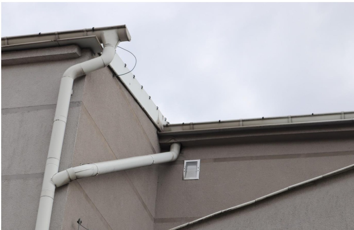
Kratki na elewacji budynku bez ubytków i uszkodzeń