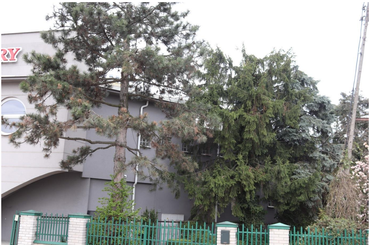
Szpaler drzew sąsiadujący od strony wschodniej z budynkiem MOK