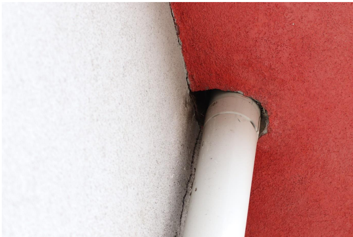
Otwór przy rynnie od strony ul. Sportowej będący wlotem do gniazda mazurka

Generalnie elementy obróbek dekarских bez śladów guana. Wyloty przewodów kominowych i wentylacyjnych na zadaszeniach są czyste, bez nawet śladowych ilości ekskrementów, pierza, innych materiałów świadczących o próbach podejmowania zakładania gniazd, m.in. przez jaskółki. Nie stwierdzono obecności w obrębie budynku innych gatunków ptaków (m.in. kawki, gołębi i sów) oraz nietoperzy Chiroptera .