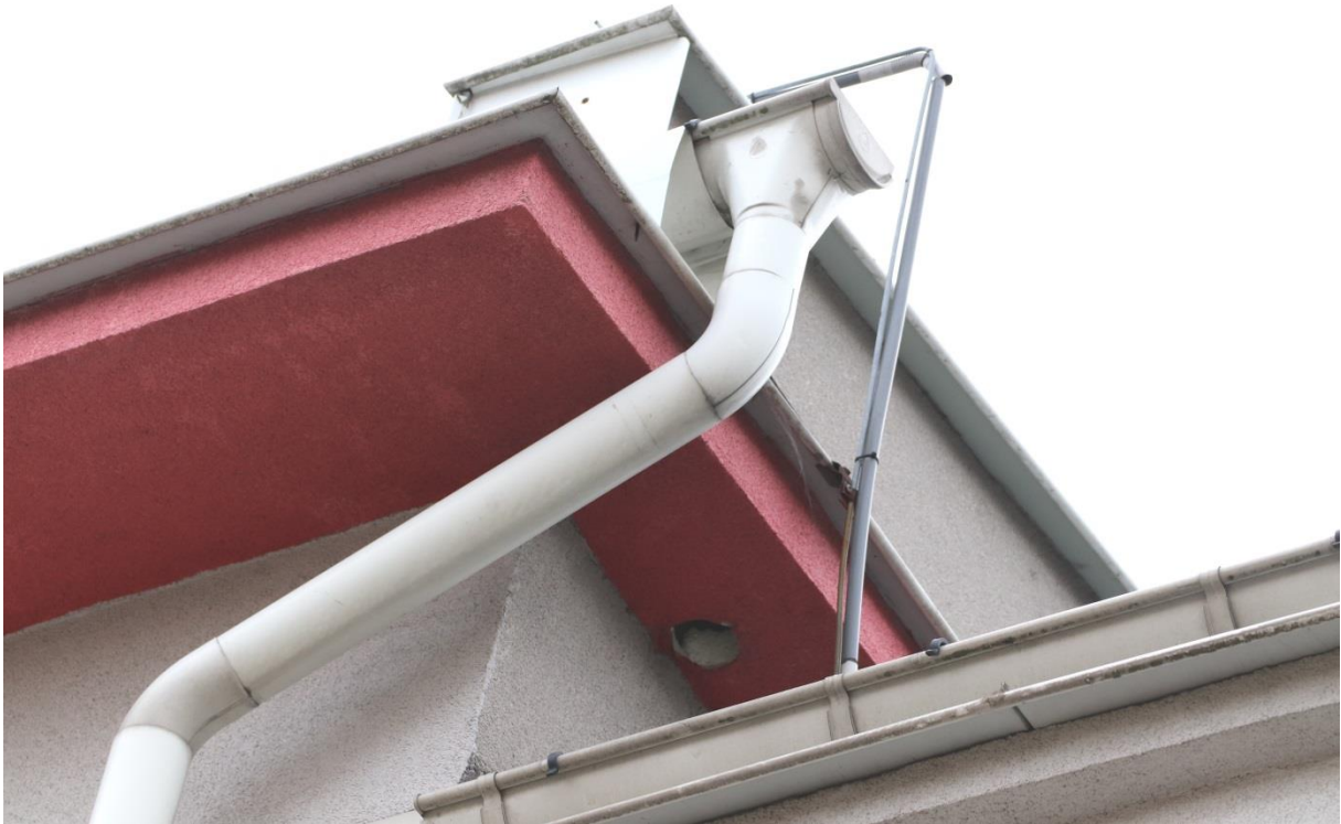
Otwór w którym znajduje się gniazdo wróbla