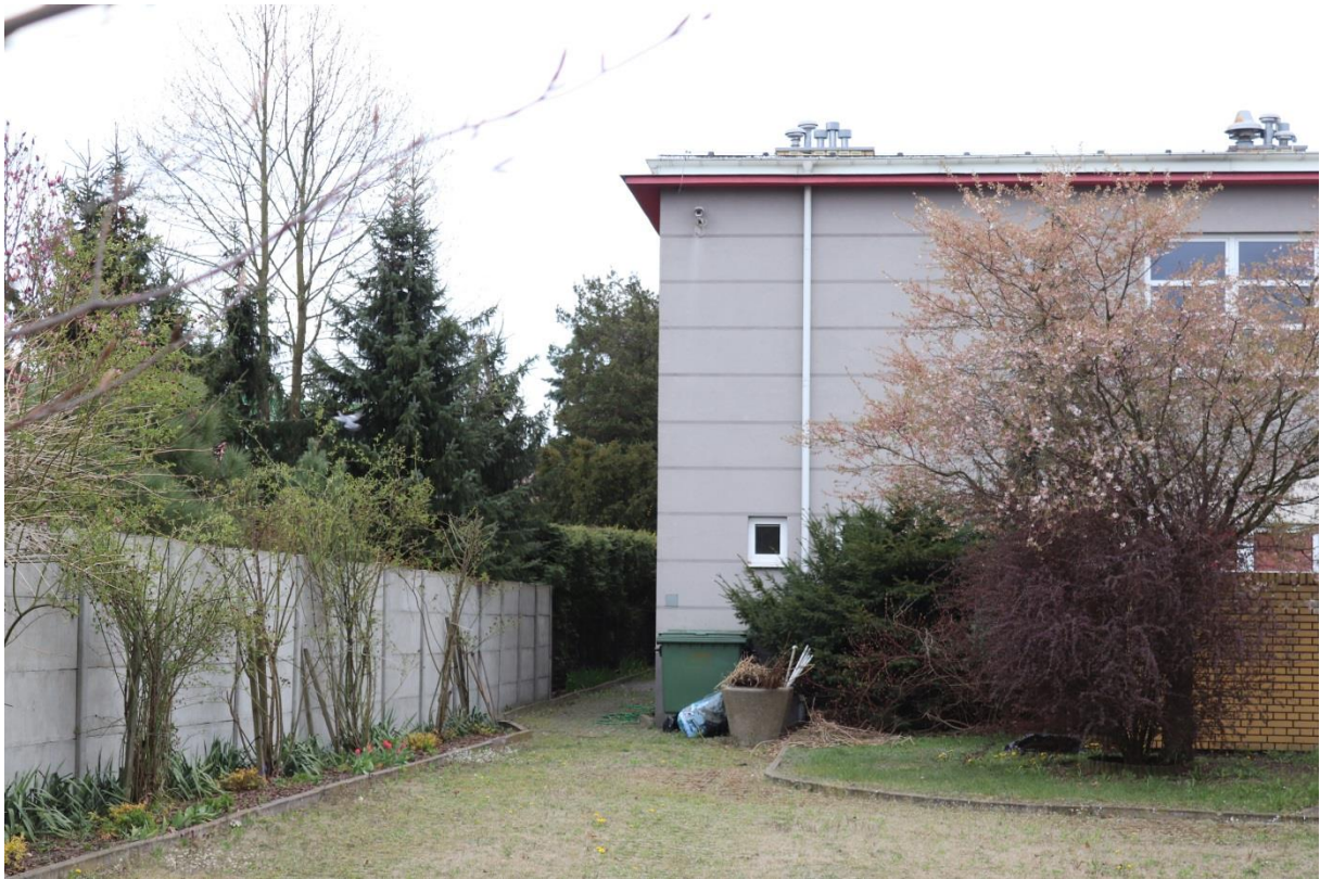
Widok na budynek MOK z ogrodu od strony północnej, z lewej strony widoczna zieleni wysoka znajdująca się na posesji przy ul. Warszawska 35