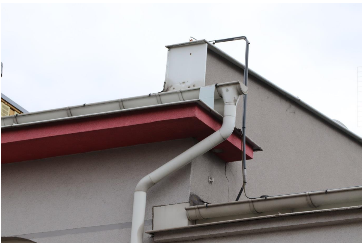
Elementy blaszanych zwieńczeń stropów i orynnowanie bez oznak gniazdowania