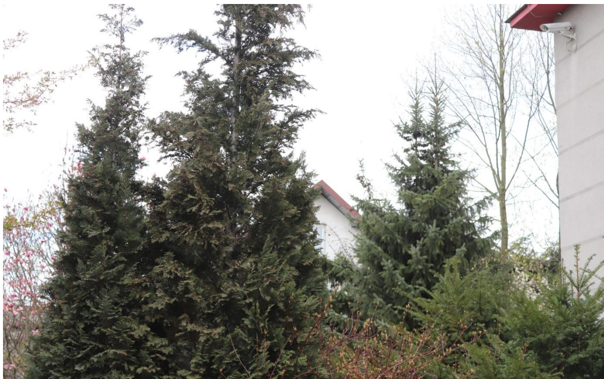
Drzewa iglaste na terenie MOK