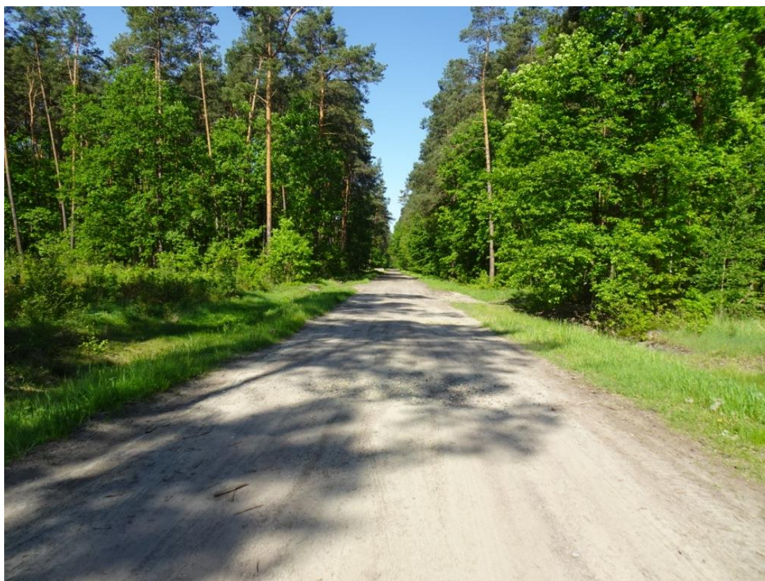
4. Widok nawierzchni z wybojami na całej szerokości jezdni i zawyżonymi poboczami