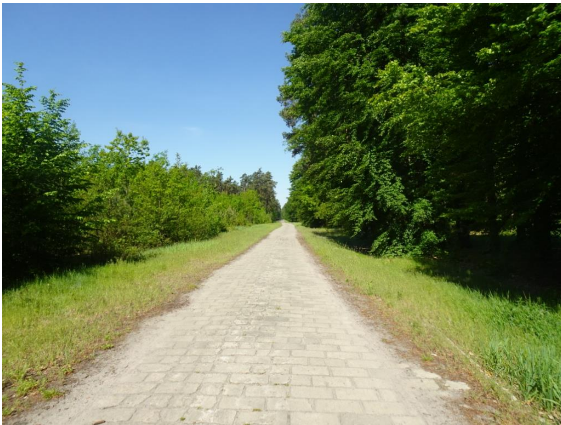
3. Widok nawierzchni z kostki betonowej i zawyżonymi poboczami