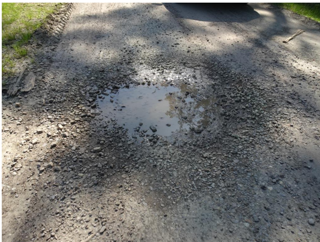
8. Szczegół wybitej nawierzchni z rozluźnionym kruszywem wypełniony wodą