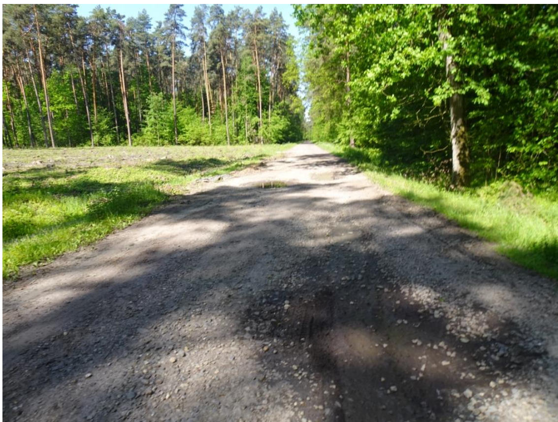
6. Widok nawierzchni z wybojami na całej szerokości jezdni i zawyżonymi pobocznymi