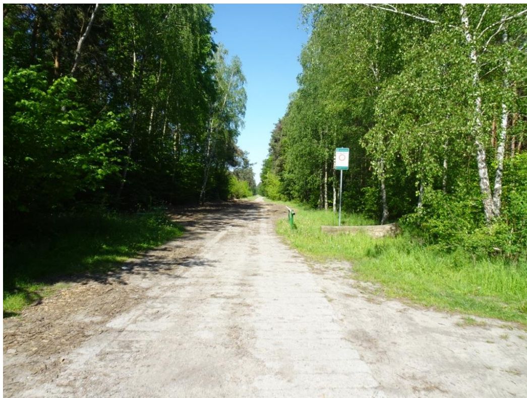
1. Widok nawierzchni z prefabrykatów betonowych

Dokumentacja fotograficzna uszkodzeń sporządzona została na podstawie zdjęć wykonanych podczas wizji w terenie.