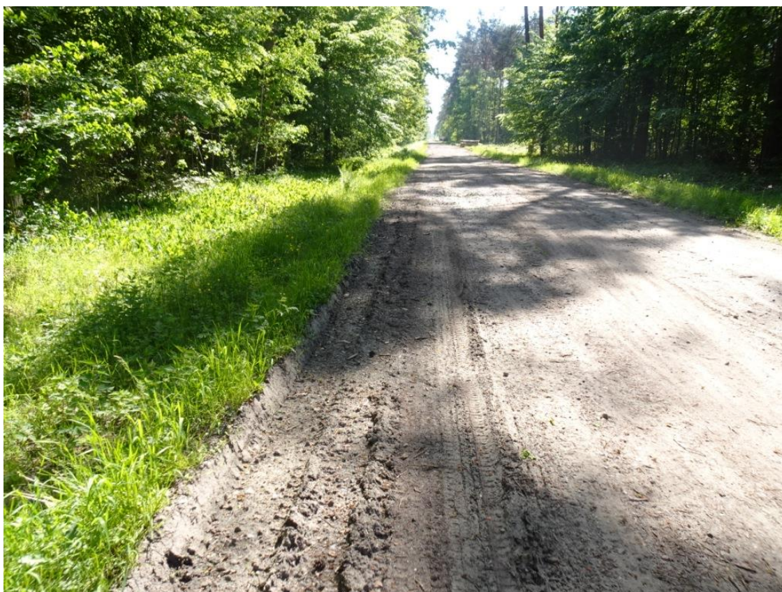
10. Szczegół koleiny z zawyżonym poboczem