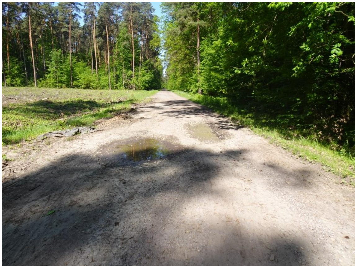
7. Szczegół wybitej nawierzchni z rozluźnionym kruszywem wypełniony wodą