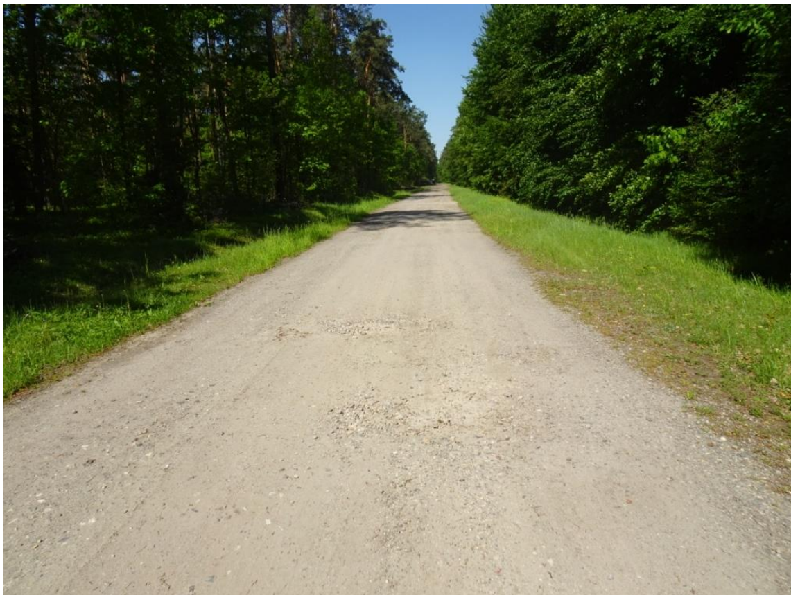
9. Szczegół wyboju z rozluźnionym kruszywem