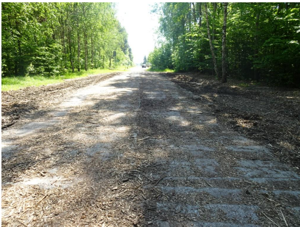
2. Widok nawierzchni z prefabrykatów betonowych z zapadnięciami i zanieczyszczeniem