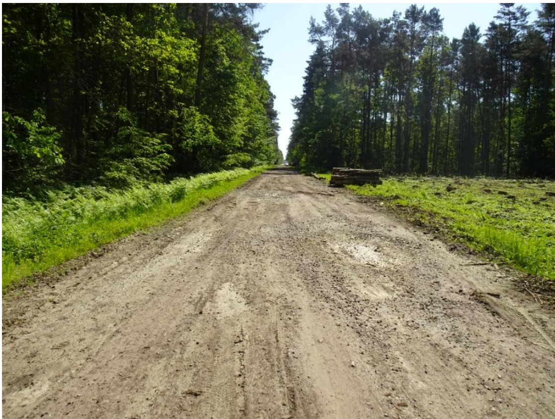
5. Widok nawierzchni z wybojami i koleinami na całej szerokości jezdni i zawyżonymi pobocznymi