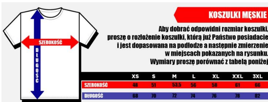
Tabela rozmiarów (+/- 1,5 cm):

Klasyczne męskie polo wykonane z miętej w dotyku, oddychającej tkaniny. Koszulka zapinana na guziki w kolorze całości. Po bokach znajdują się wcięcia, dzięki czemu połówka lepiej układa się na ciele. Materiał nie kurczy się i nie wytraca koloru w praniu.