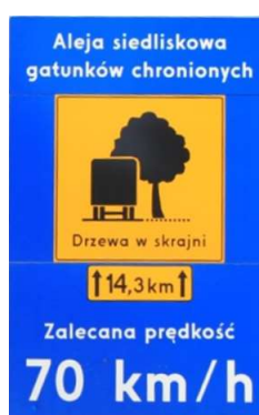
Rys. 2. Przykładowa tablica informacyjna o powodach zalecanej prędkości na drodze