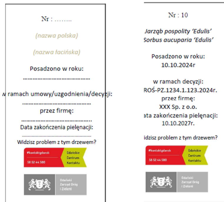
Fot. nr 1 – zdjęcie poglądowe oznakowania nasadzeń

Na tabliczce należy również umieścić nr porządkowy drzewa lub oznaczenie zgodne z dokumentacją projektową