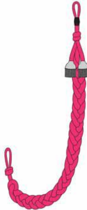
Sznur wyróżniający w kolorze amarantowym z dwoma chwastami