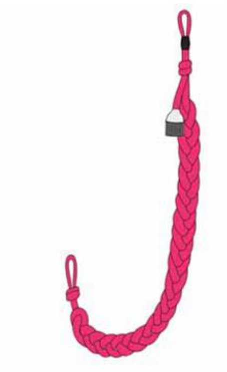
Sznur wyróżniający w kolorze amarantowym z jednym chwastem