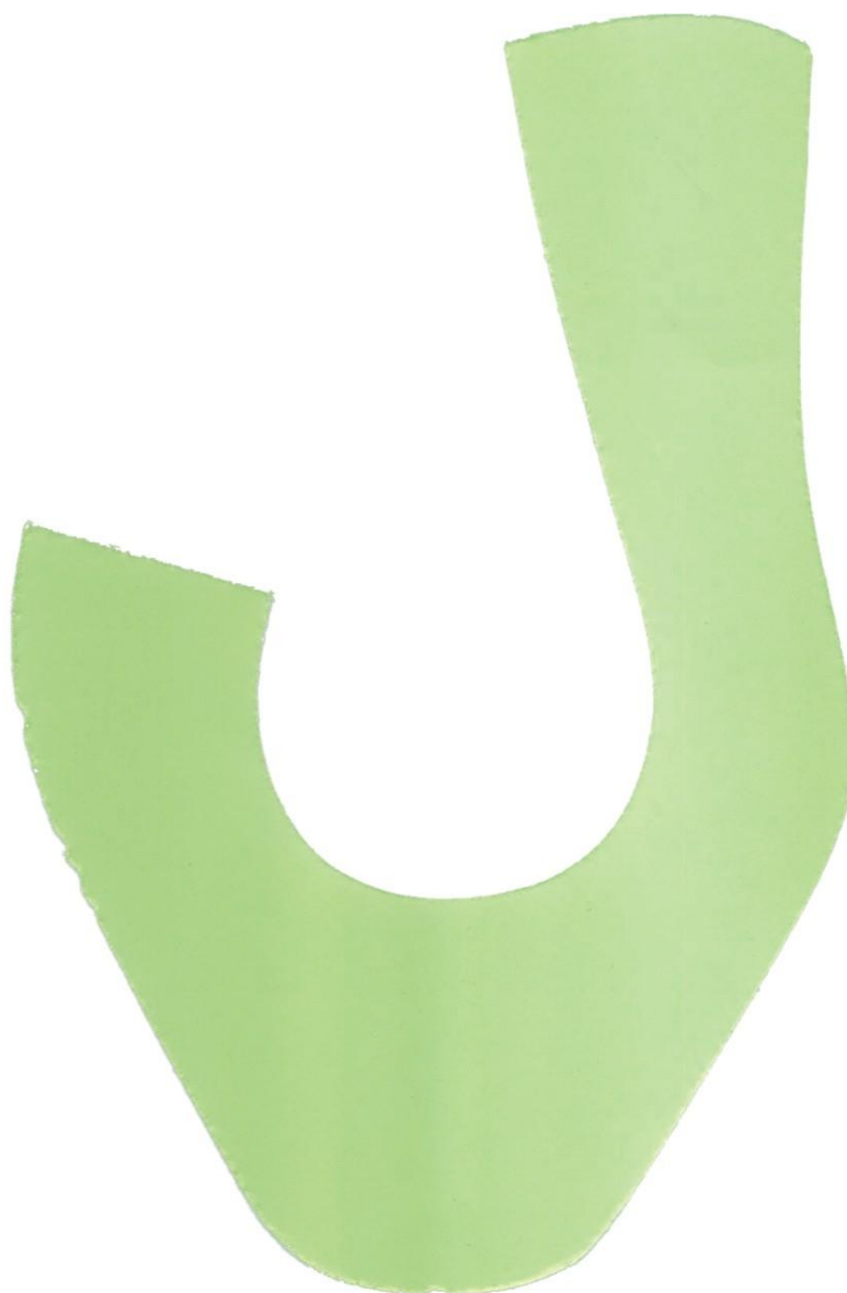
Międzypodszewka przyszwycy z obłożyną zewnętrzną