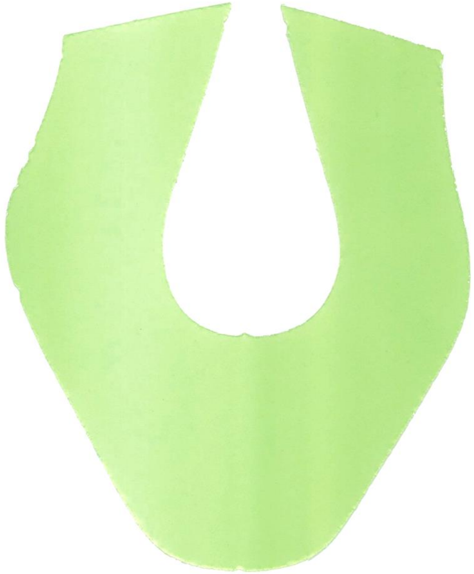
Podszewka przyszwzy z obłożynami