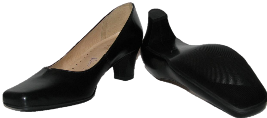
Półbuty damskie Wzór 915A/MON