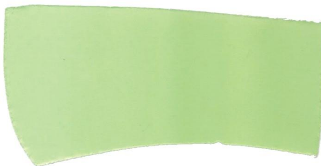
Międzypodszewka obłożyny wewnętrznej