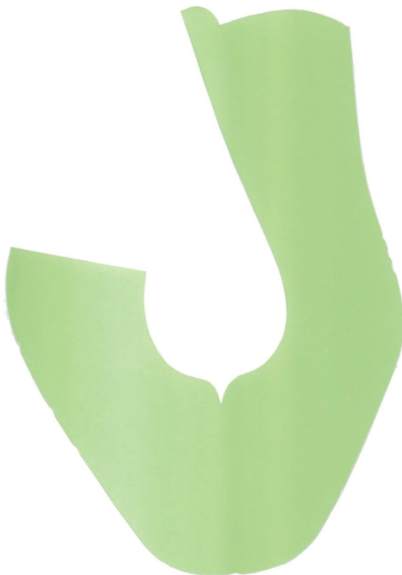
Przysza z obłożyną zewnętrzną