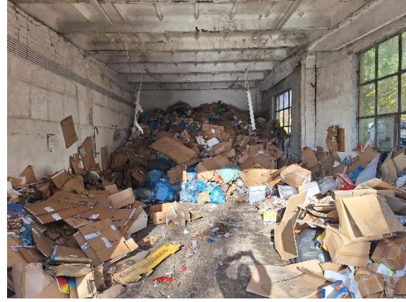
Zadanie nr 4