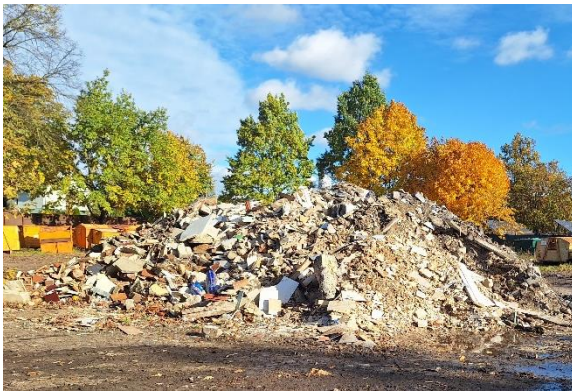
Zadanie nr 6