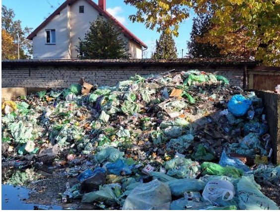
Zadanie nr 3