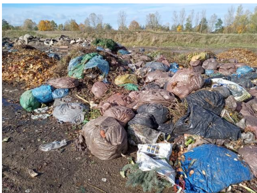
Zadanie nr 1