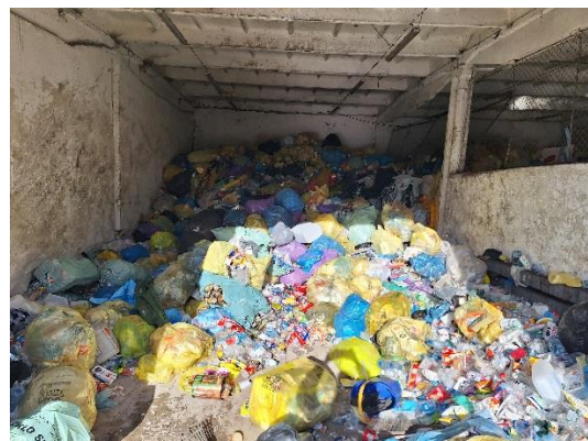
Zadanie nr 2