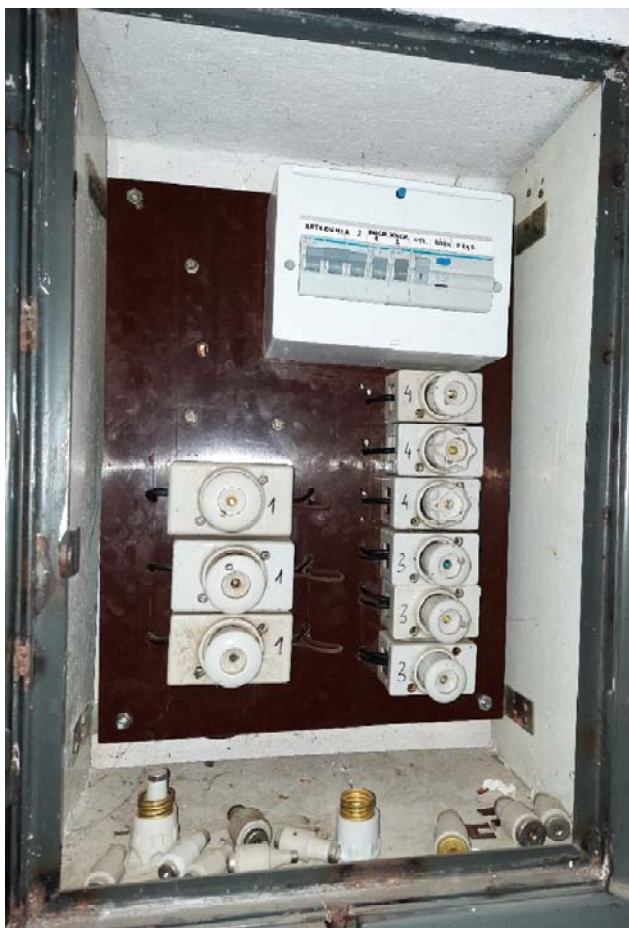
Rys. rozdzielnica główna