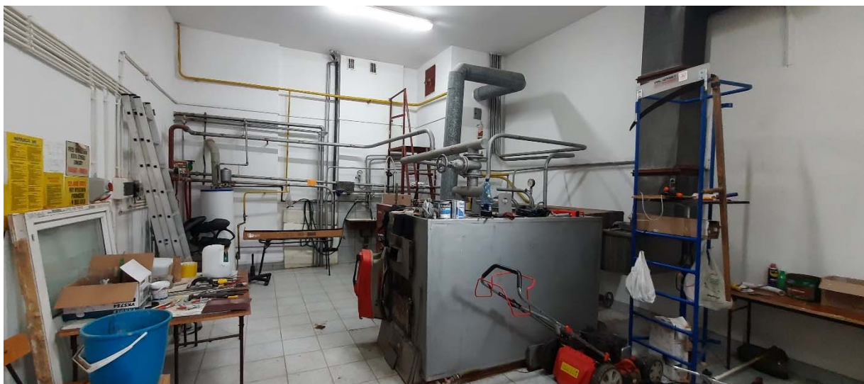
Rys. pomieszczenie kotłowni

Kotły wyprodukowano w 1998 roku a ich stan wskazuje na znaczne zużycie.