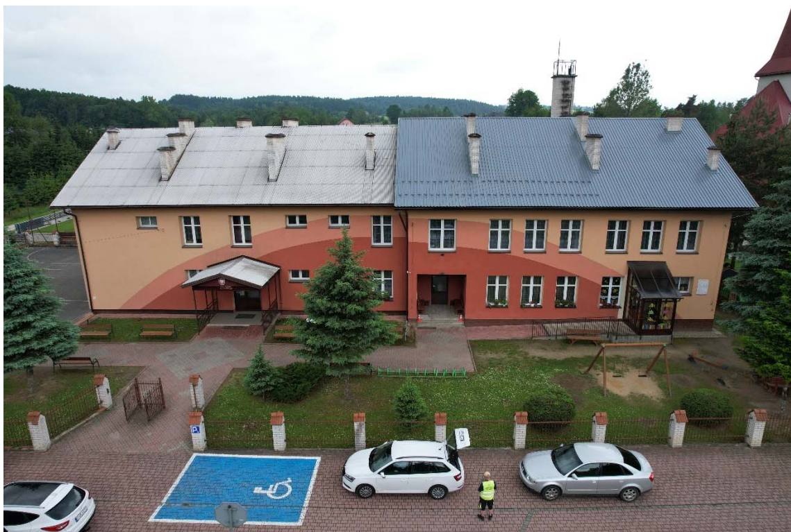
Zdjęcie przedstawiające przedmiotowy obiekt