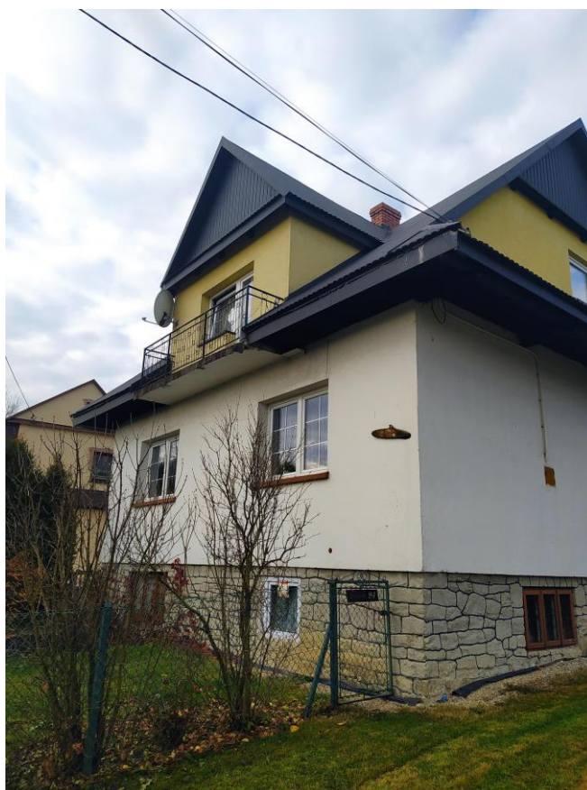
widok od strony SW