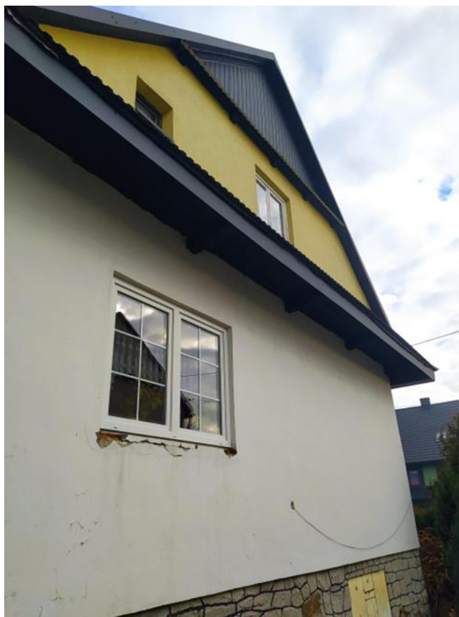
widok od strony NW