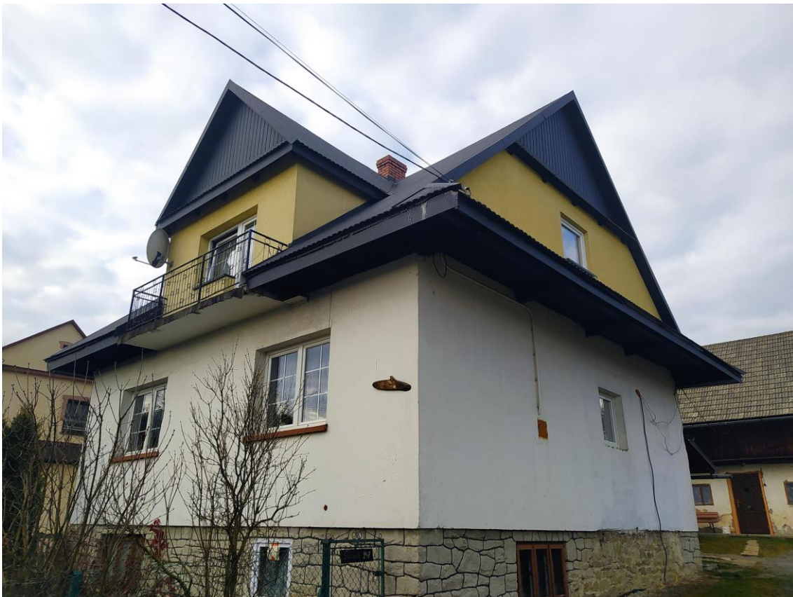
widok od strony SE