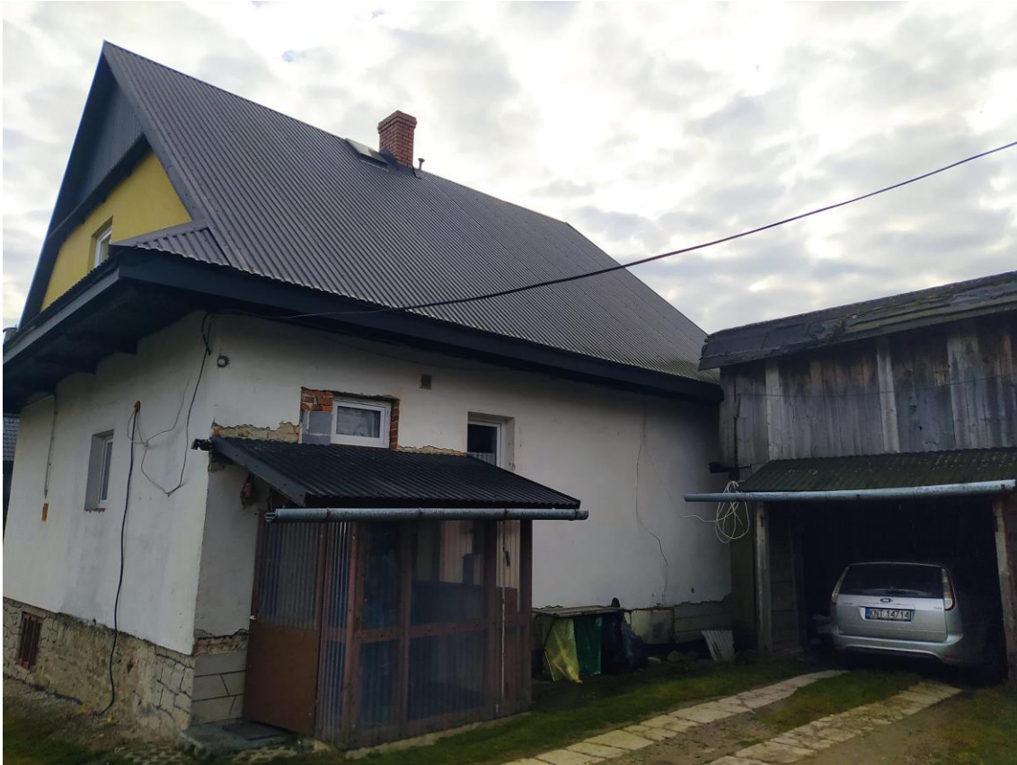
widok od strony NE