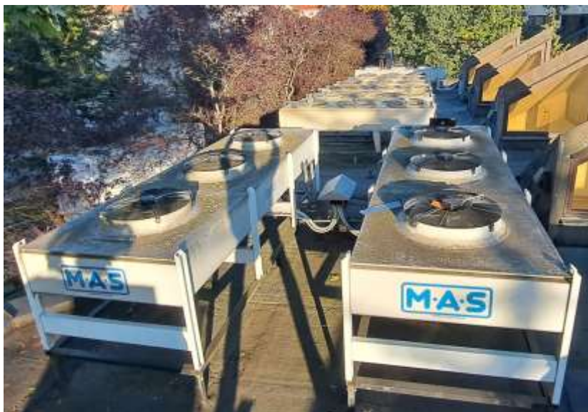
Rysunek 2 Skraplacze Thermokey M.A.S.

PN 14/08/2024 – rozbudowa systemu chłodzenia