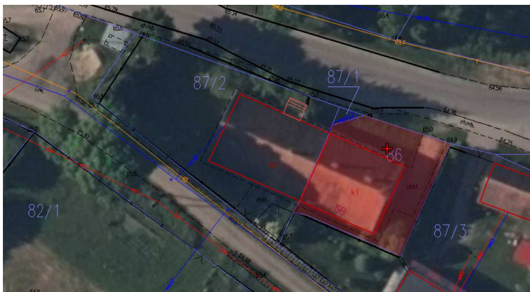
Ortofotomapa z obrysem przedmiotowego budynku i terenu

Budynek świetlicy jest murowany, niepodpiwniczony, wolnostojący z 1 kondygnacją nadziemną i poddaszem nieużytkowym. Dach dwuspadowy kryty dachówką ceramiczną holenderką