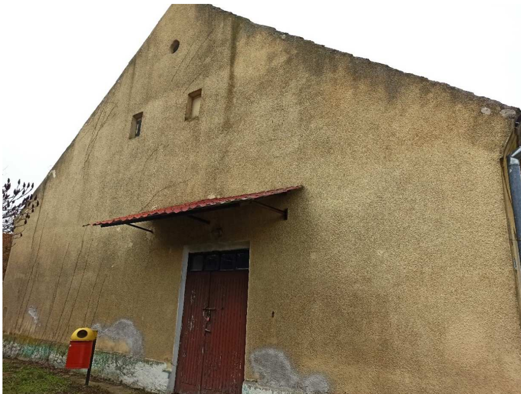
Fotografia nr 3 – Widok elewacji szczytowej (wschodniej) – stan istniejący