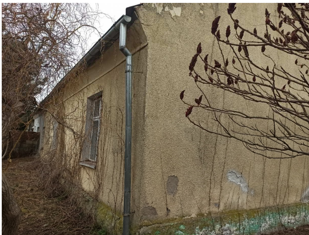
Fotografia nr 2 Widok elewacji tylnej (południowej) – stan istniejący