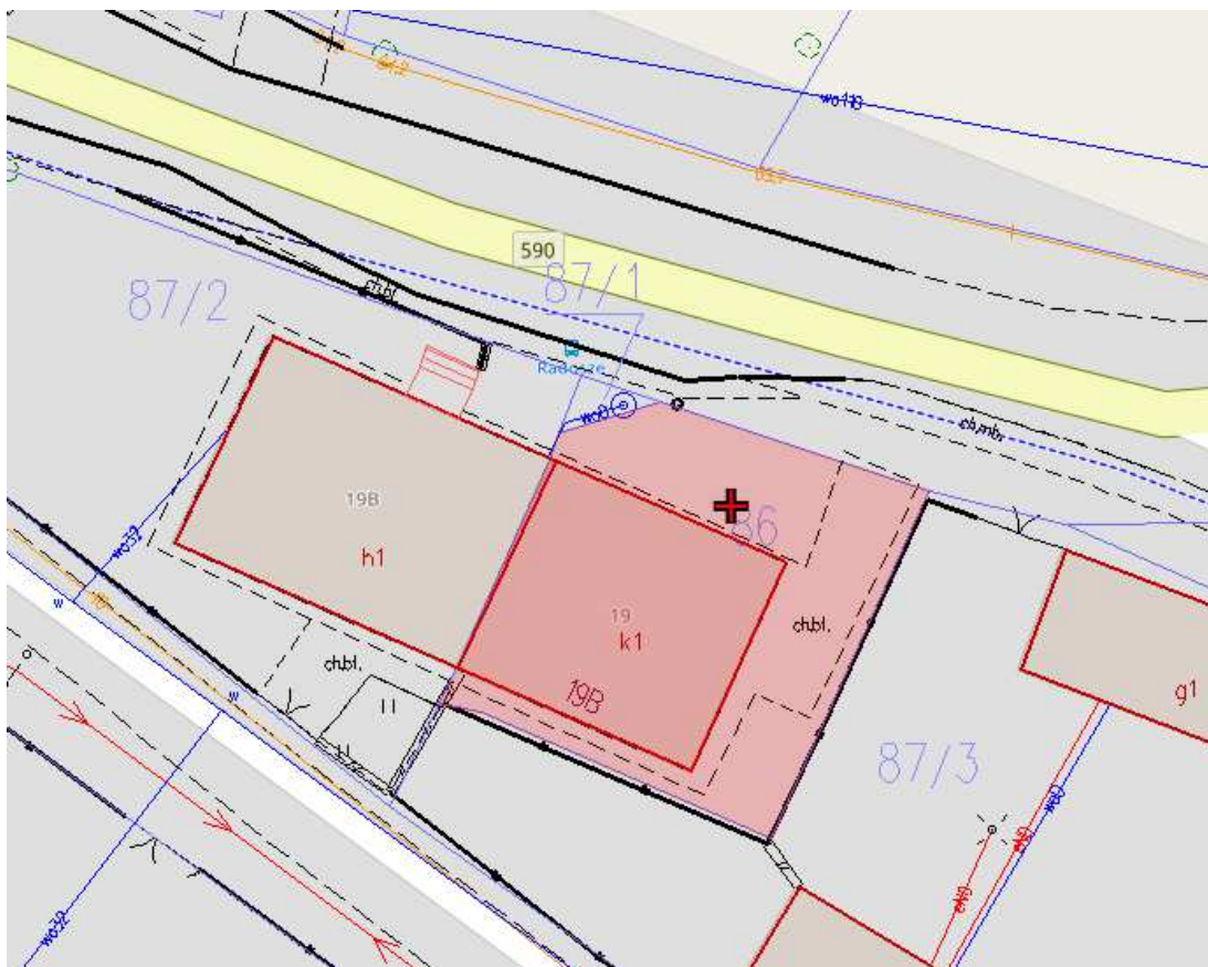
Rzut działki z lokalizacją przedmiotowego budynku świetlicy

Budynek świetlicy położony jest w miejscowości Radosze gmina Barciany na działce ewidencyjnej nr 86 o łącznej powierzchni 500,00 m 2 . Działka zabudowana jest przedmiotowym budynkiem świetlicy, do którego przyległy jest szczyt budynek handlowy dawnego sklepu (nie objęty opracowaniem). Działka od strony północnej przylega bezpośrednio do pasa drogi wojewódzkiej nr 590 tj. działki nr 205/2 i posiada do niej dostęp poprzez istniejący zjazd. Działka od strony południowo-wschodniej jest ogrodzona. Teren jest na ogół płaski w części porośnięty krzakami i drzewami niskimi. Obiekt posiada dostęp do energii energetycznej z sieci. Przy pasie drogi gminnej tj. dz. nr 217 występuje gminna sieć wodociągowa. Brak jest infrastruktury w postaci kanalizacji sanitarnej. Poniżej przedstawiono rzut mapy zasadniczej z zaznaczoną działką i obiektem objętym opracowaniem.