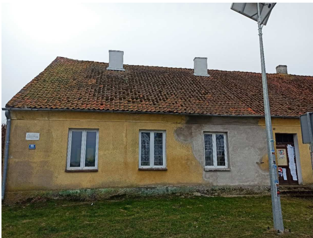
Fotografia nr 1 Widok elewacji frontowej (północnej) – stan istniejący

esówką. Stolarka budowlana, drewniana i PCV. Na fotografiach nr 1, 2 i 3 przedstawiono stan istniejący obiektu (luty 2024 rok):