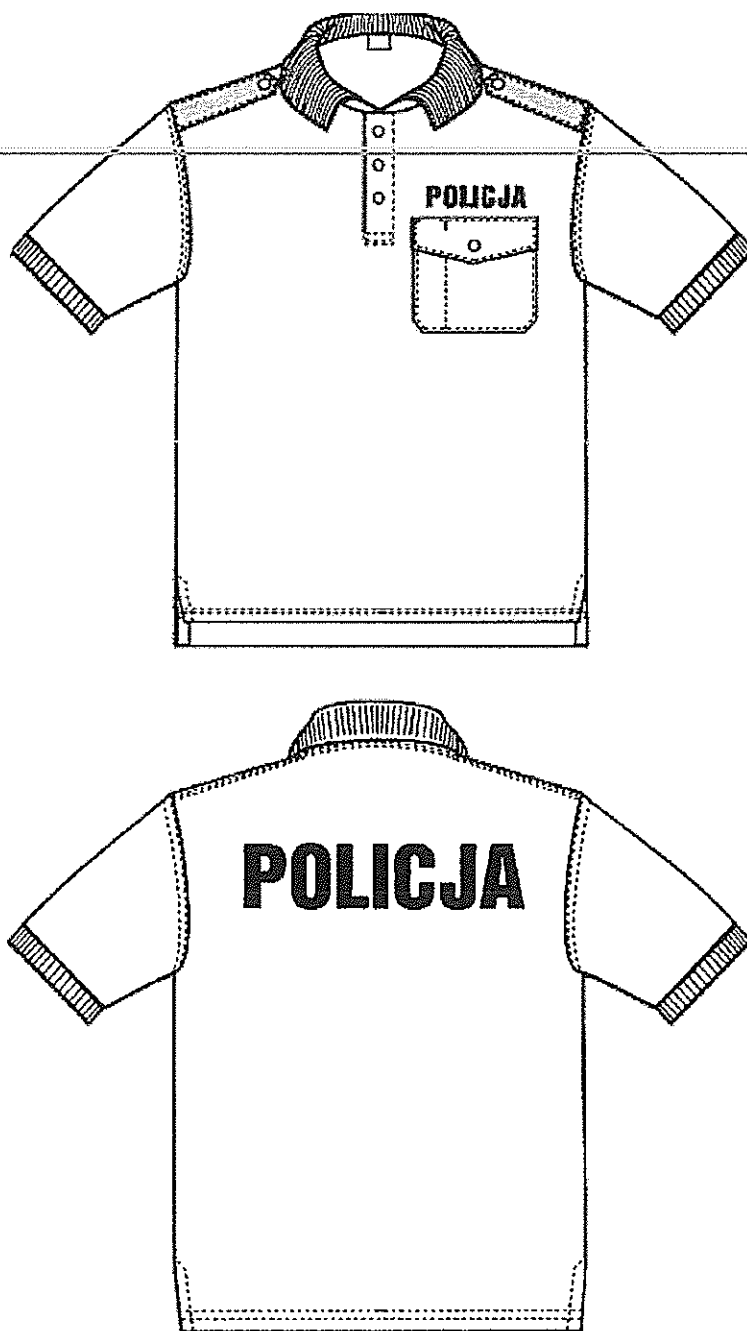
Rys. 1. Rysunek modelowy koszulki polo z krótkim rękawem w kolorze białym – widok z przodu i z tyłu.

Widok ogólny koszulki polo z krótkim rękawem przedstawia rysunek 1.