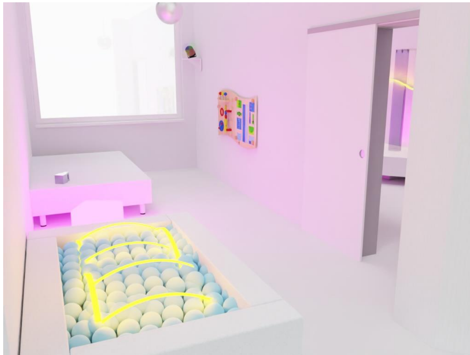
Załącznik Nr 1a do SWZ