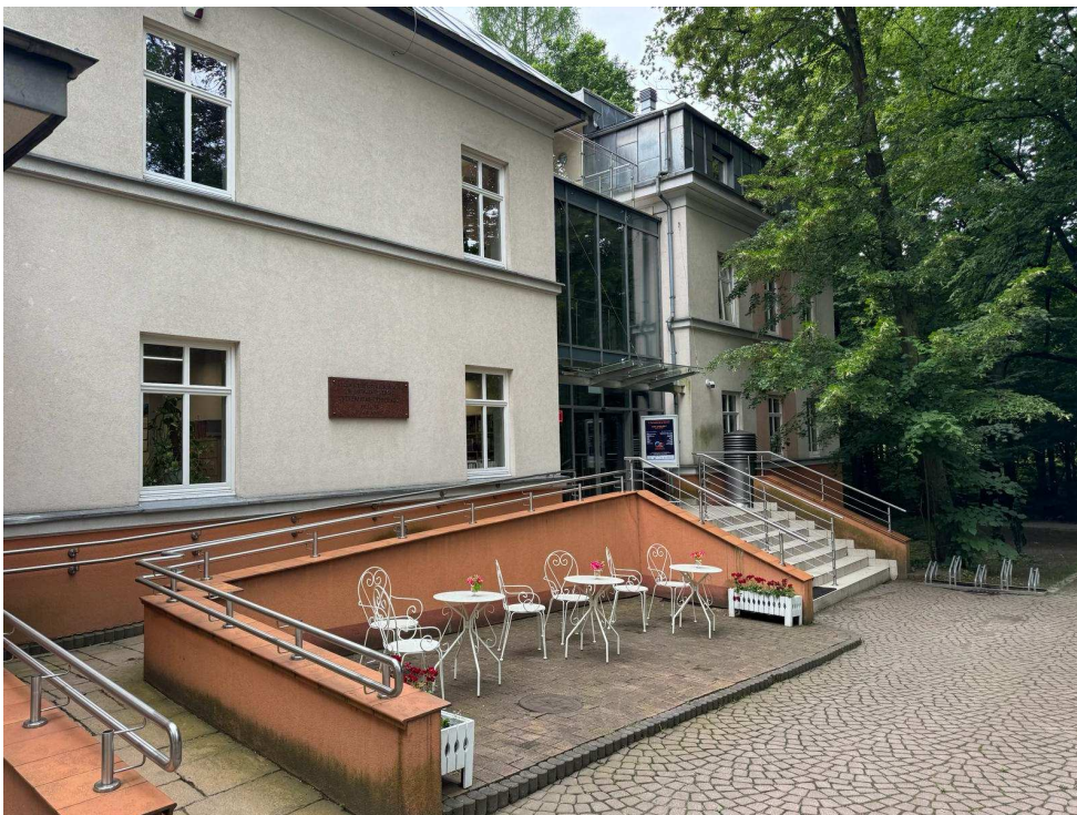
Zawilgocone ściany pochylni.