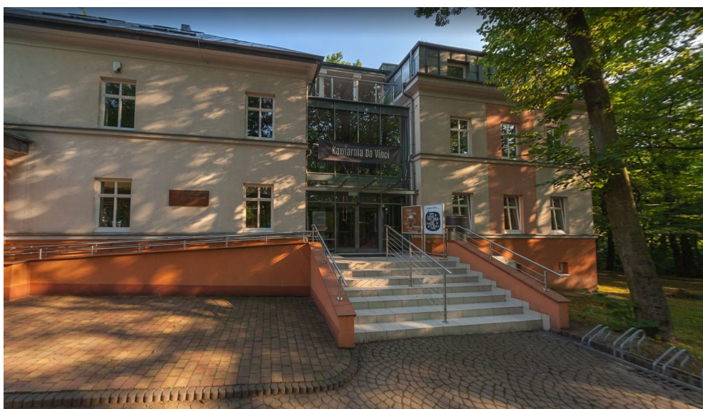
Wejście do budynku MASNÓWKA.

Po zakończeniu planowanych robót cokół budynku zostanie umyty – od poziomu opaski do poziomu gzymsu odcinającego.