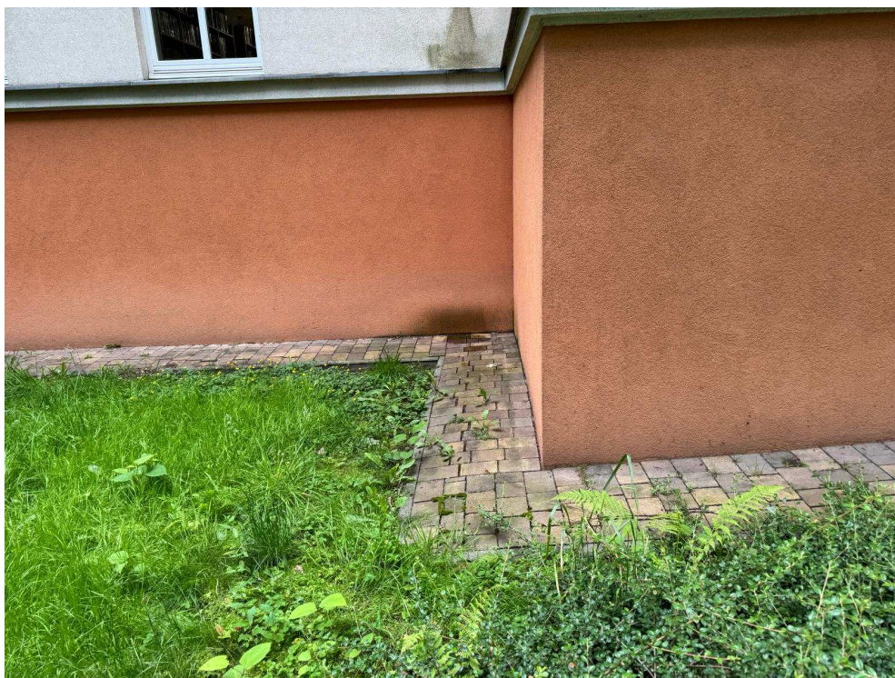
Zawilgocone ściany i nieszczelna opaska.