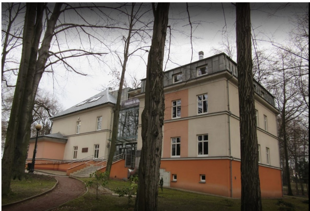
Widok budynku MASNÓWKA.

Budynek „MASNÓWKA” – dawna siedziba Dyrekcji Uzdrawiska – jest wpisany do wojewódzkiego rejestru zabytków pod numerem A/1524/93 – 5 (data wpisu do rejestru zabytków: 30.IV.1993 r.). Budynek wchodzi w skład zespołu uzdrowskiego wpisanego do rejestru zabytków.