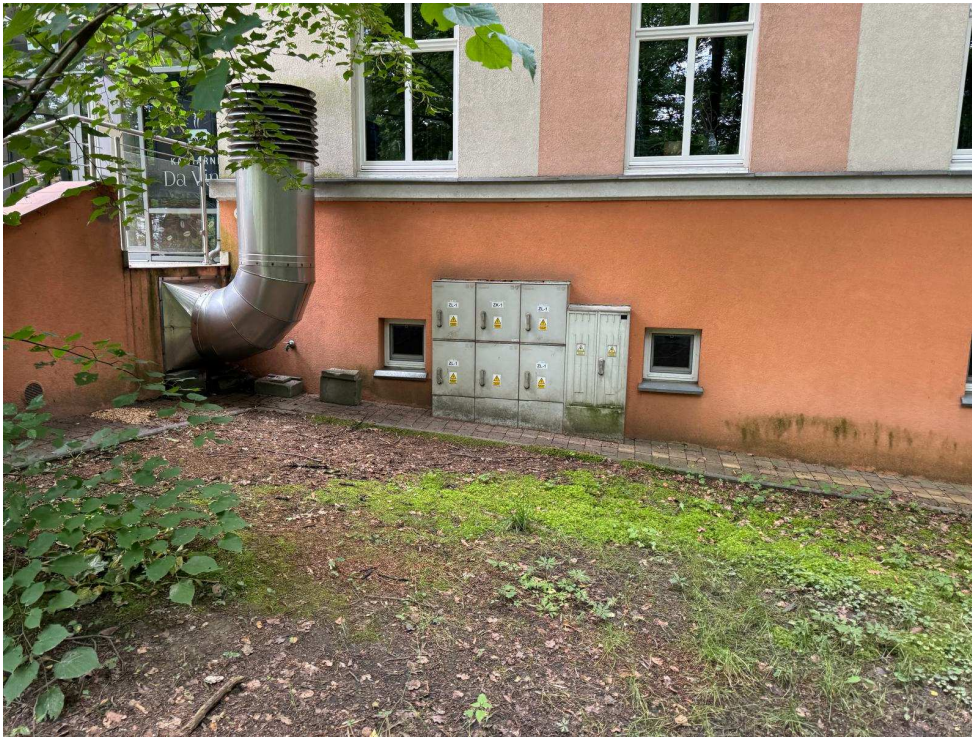
Zawilgocone ściany piwnicy.