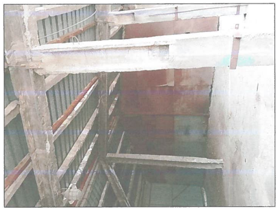
WIDOK WNIĘTRZA HALI MAGAZYNOWEJ