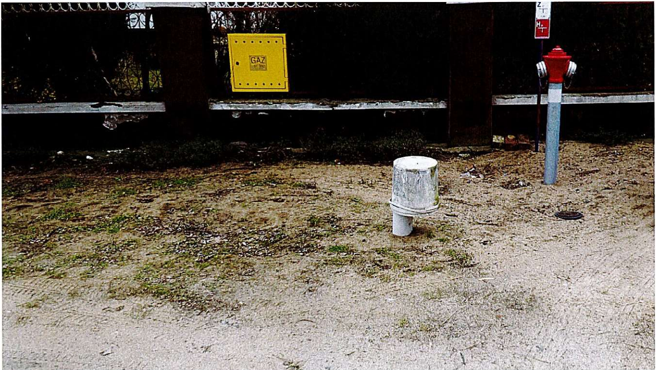
Widok ul. Modrej - uzbrojenie terenu - siec wodociągowa i gazowa