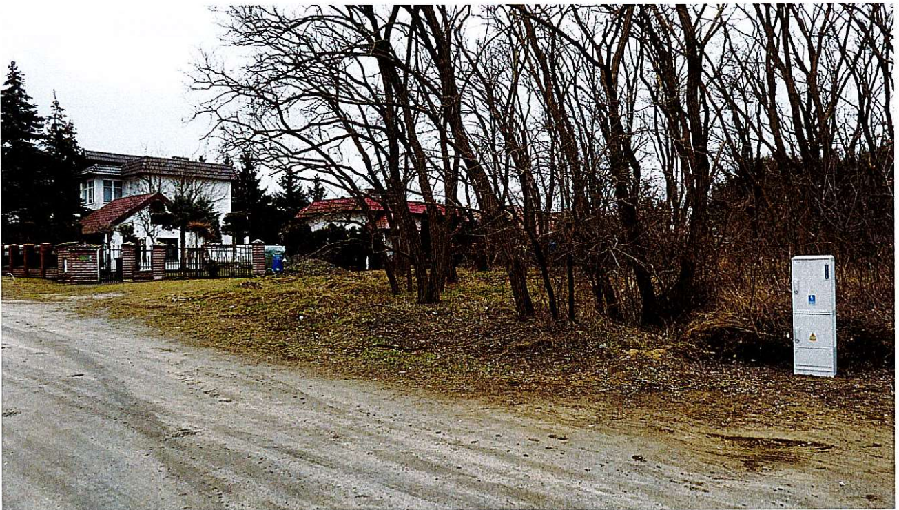
Widok ul. Modrej - nawierzchnia gruntowa, teren zadrzewiony, złącze ZKP