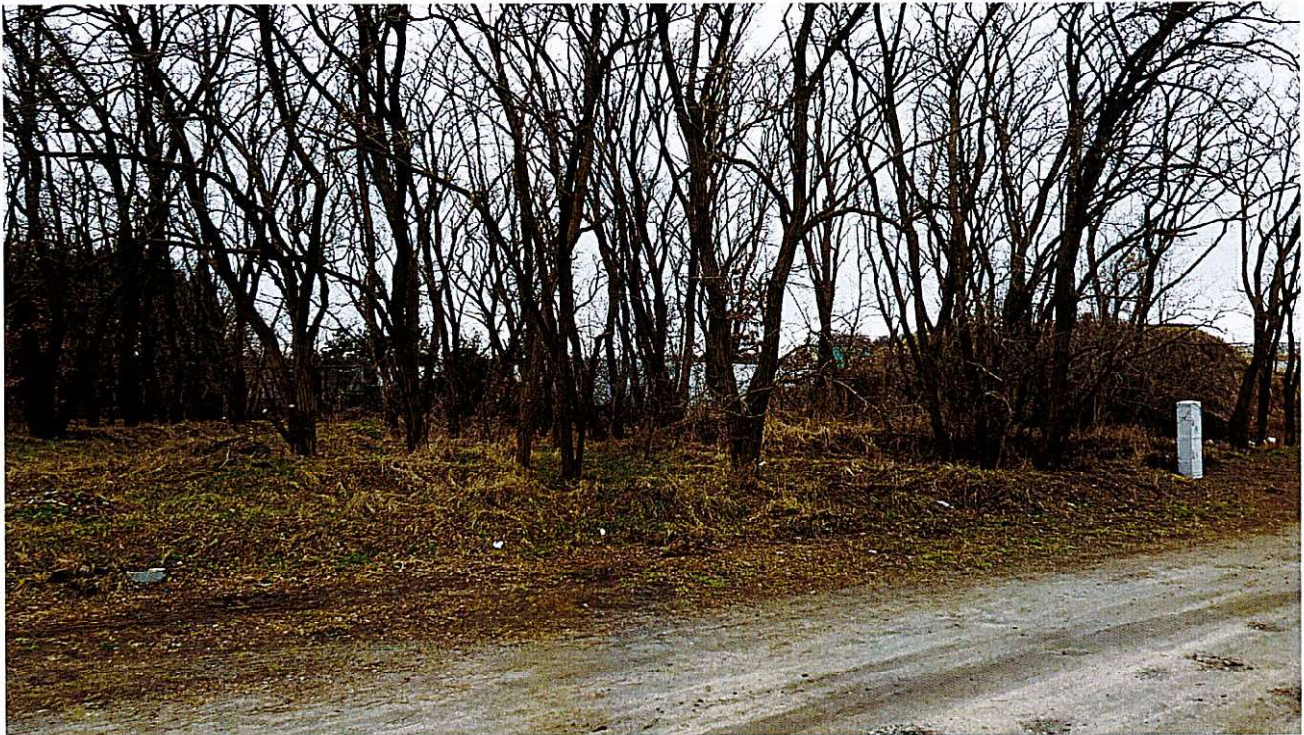
Widok ul. Modrej