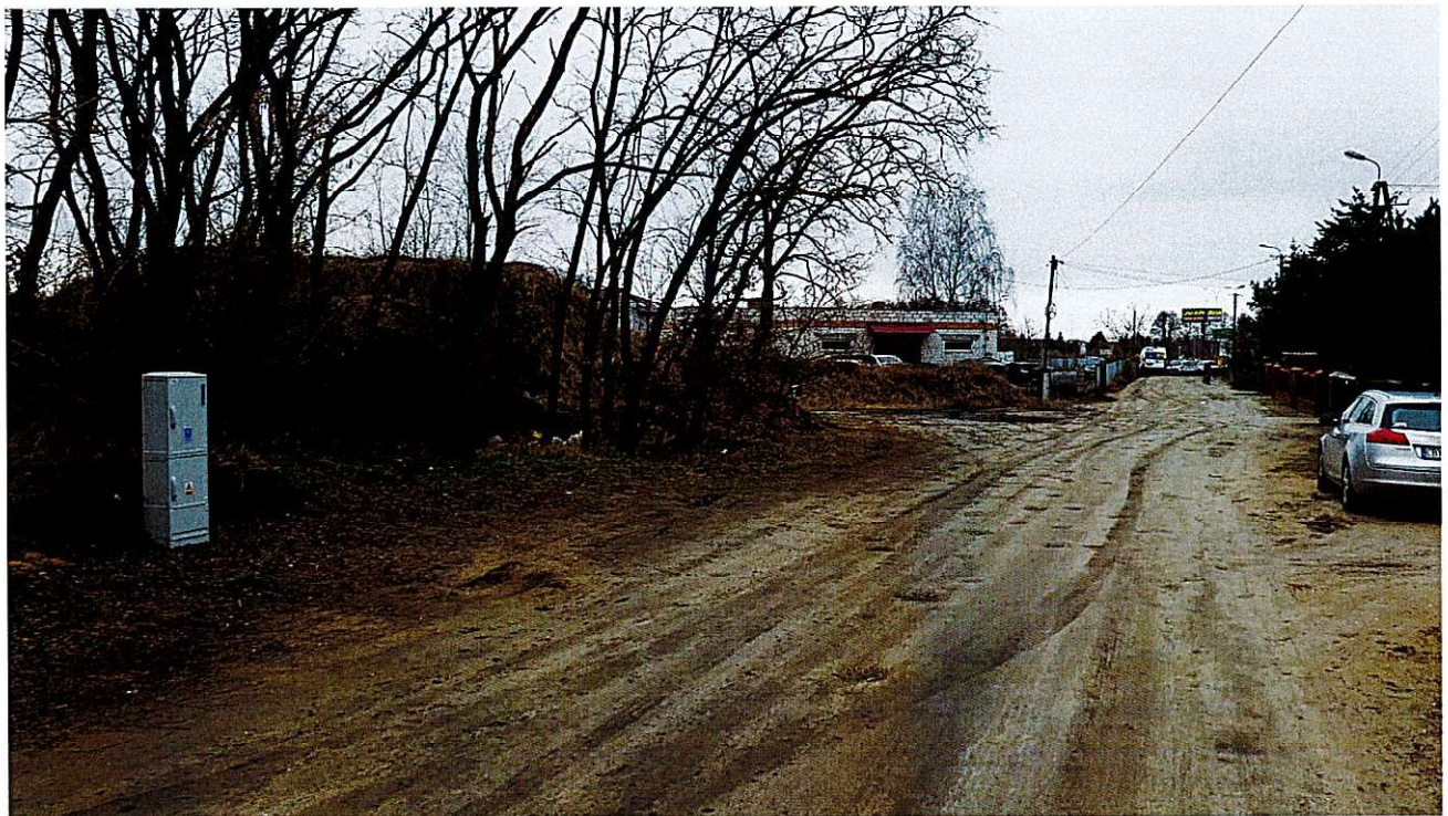
Widok ul. Modrej