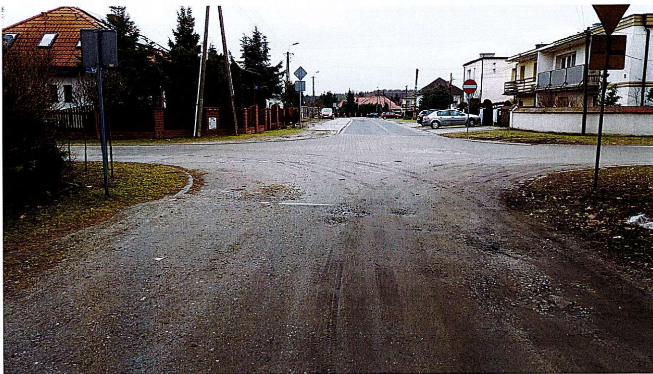
Widok ul. Modrej - wyjazd na skrzyżowanie ulic