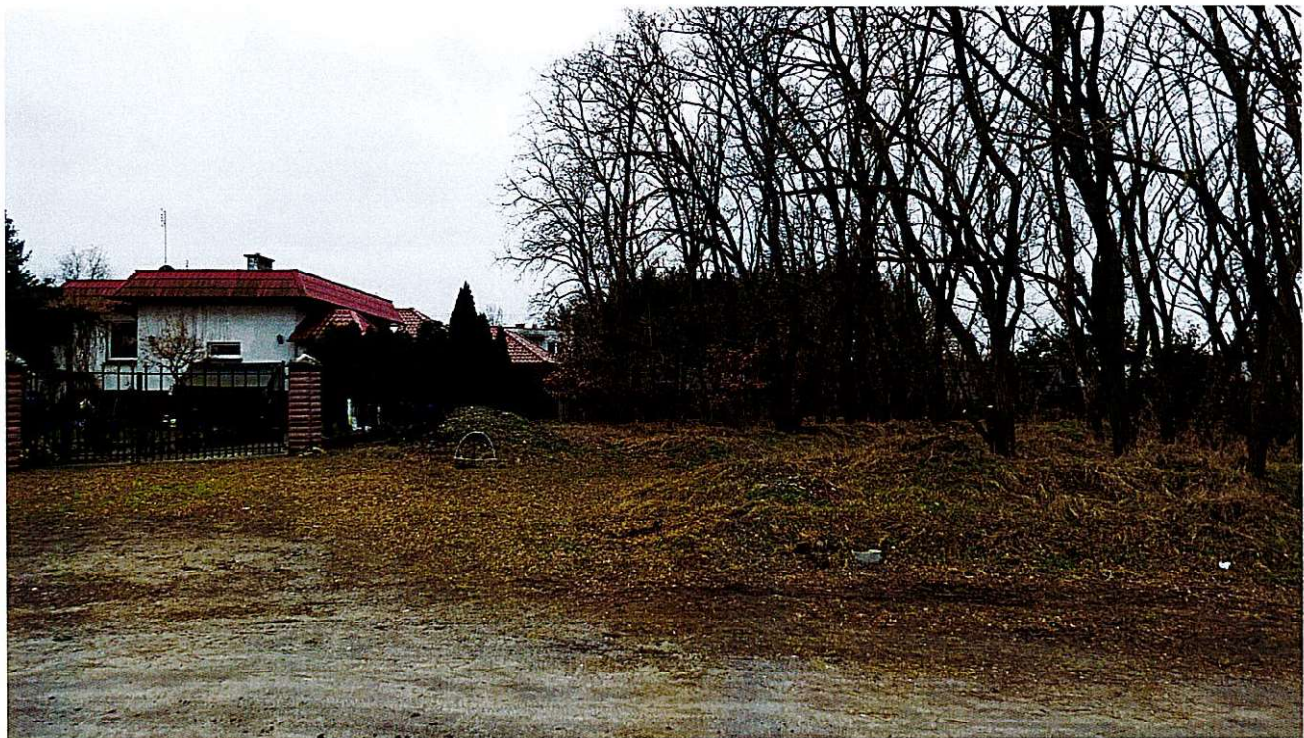
Widok ul. Modrej - widok na teren zadrzewiony.