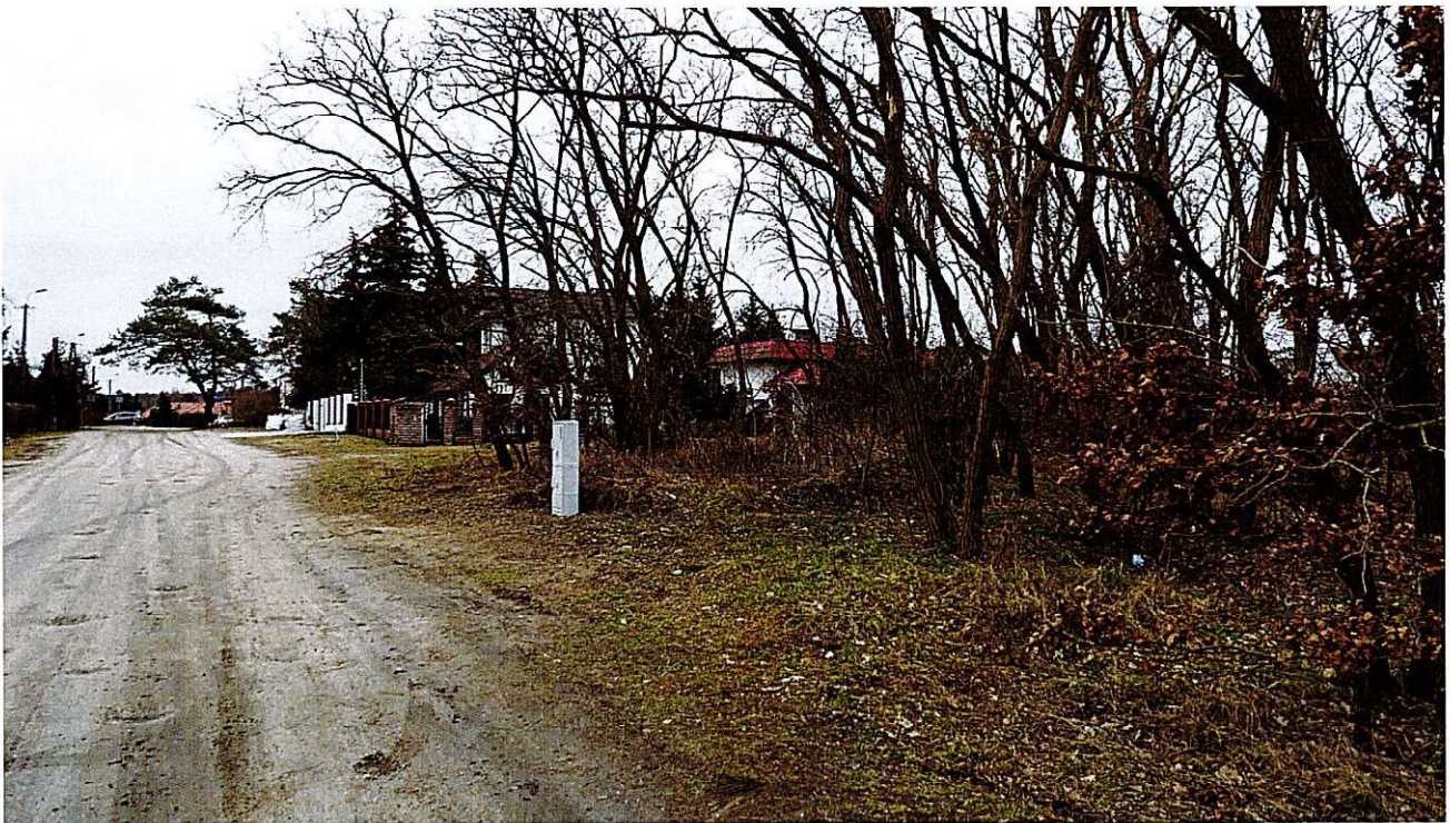
Widok ul. Modrej - widok na teren zadrzewiony, złącze kontrolno-pomiarowe - ZKP.