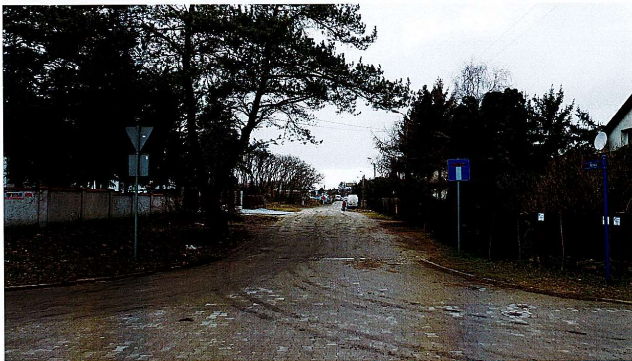
Widok ul. Modrej - ze skrzyżowania ulic