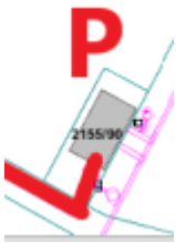
Budynek Przepompowni przy ul. Wojska Polskiego w Tychach