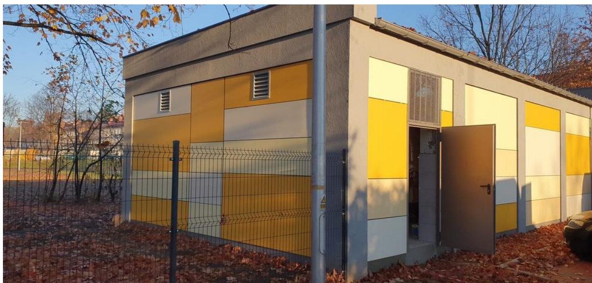
Zdj. Budynek Przepompowni

Budynek Przepompowni zlokalizowany jest w Tychach przy ul. Wojska Polskiego. Jest to nowo wybudowany budynek. Od budynku w kierunku studni teletechnicznej zlokalizowanej przy ul. Budowlanych poprowadzono wtórnik RHDPE 2xfi40.