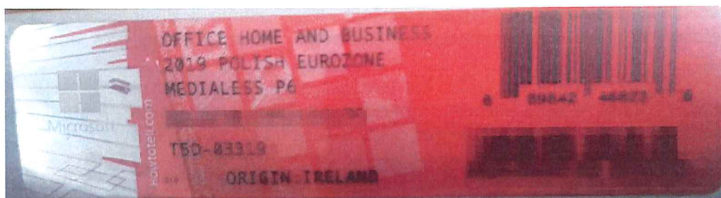
Rys. 2 przykładowy kod zabezpieczony przez producenta systemu Microsoft Windows Office Home&Business z wymazanym, znajdującym się w prawym dolnym rogu numerem seryjnym produktu. Kod licencyjny znajduje się w środku szczelnie zapakowanego i zafoliowanego pudełka (Rys. 3)