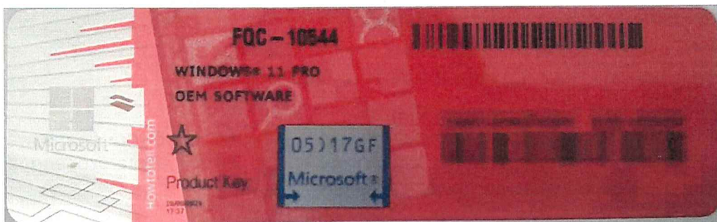
Rys. 1 przykładowy kod zabezpieczony przez producenta systemu Microsoft Windows 11 (takie same naklejki mają Windows 10) z wymazanym, znajdującym się przed i za szarą naklejką kodem licencyjnym

Poniższe zdjęcie obrazuje obecnie stosowane zabezpieczenia producenta firmy Microsoft (klucz systemu jest zabezpieczony naklejką hologramową przez producenta. Po jej zdrapaniu uzyskujemy dostęp do oryginalnego klucza):