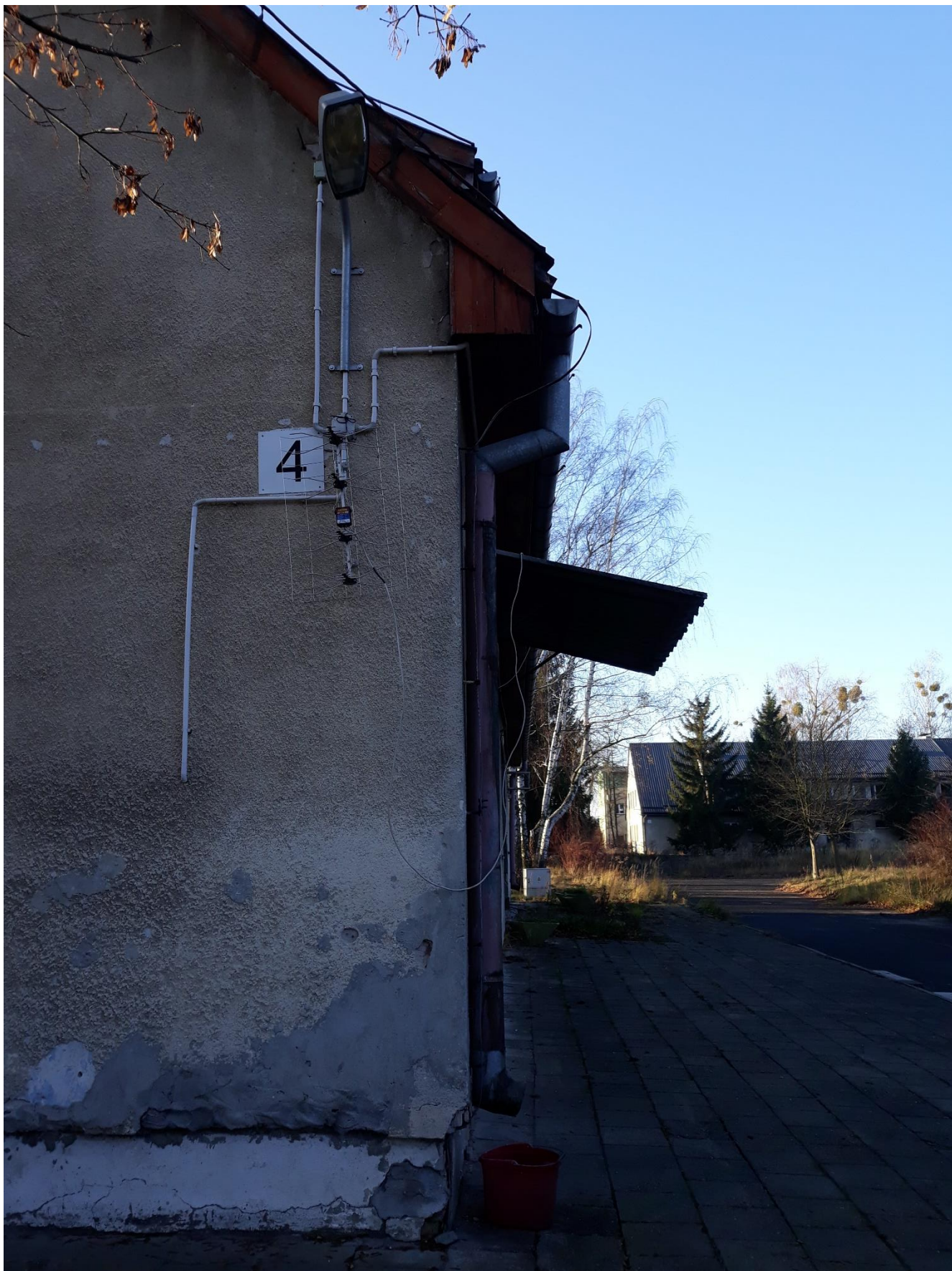
fot.9 Widok narożnika budynku i uszkodzenia strefy przycokołowej