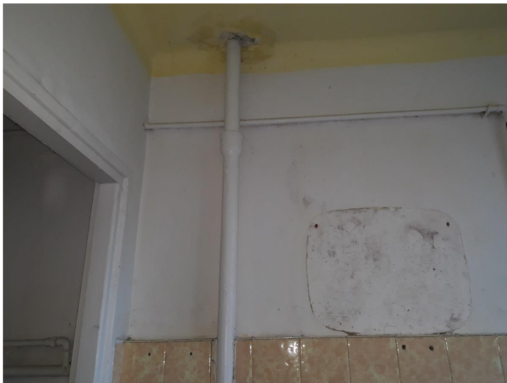
fot.18 Żeliwne elementy instalacji kanalizacji sanitarnej