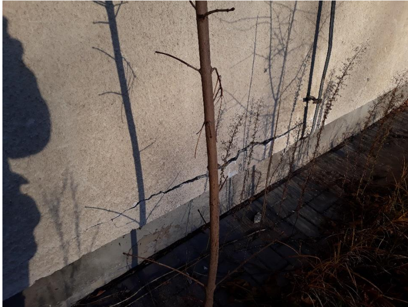
fot.3 Odspojenie (pęknięcie tynków) przy strefie przycokołowej