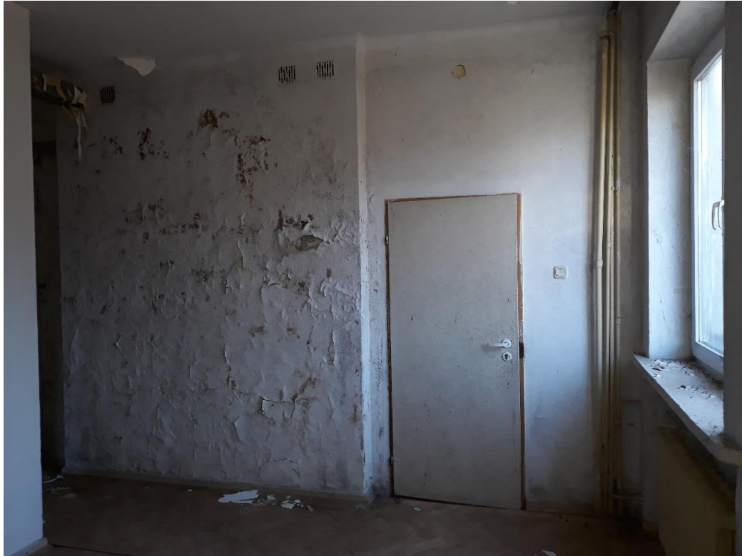
fot.14 Uszkodzenia powłok malarskich i tynkarskich na przewodach kominowych