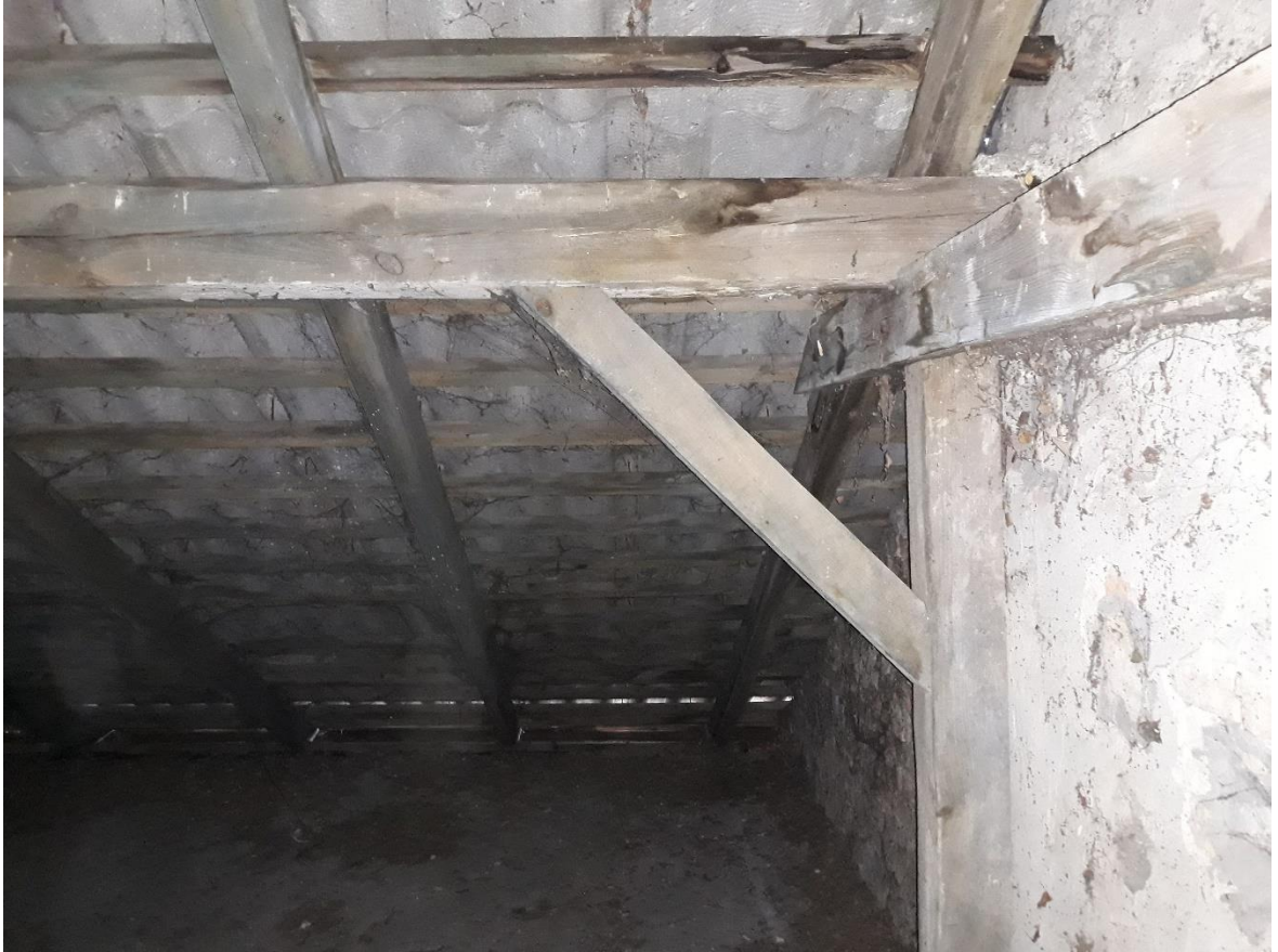
fot.23 Widok więźby dachowej – widoczne ślady zacieków