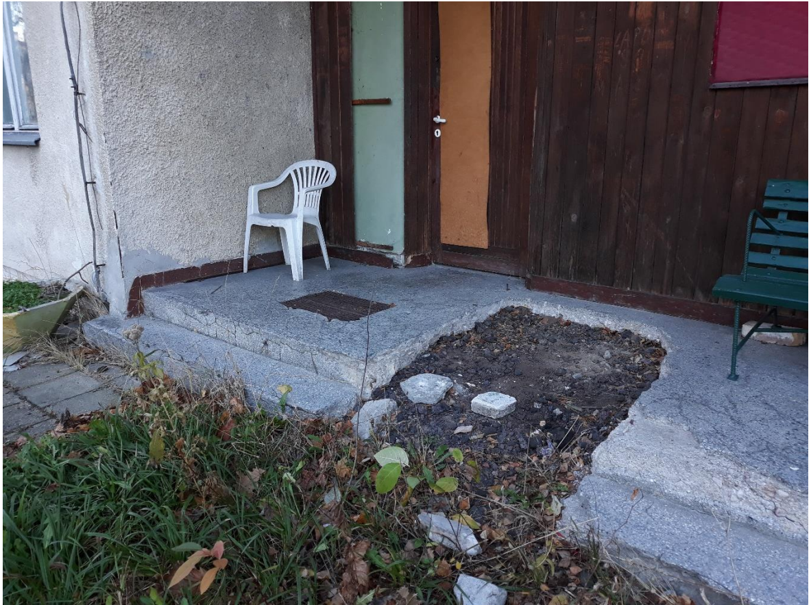
fot.10 Uszkodzenia schodów przy wejściu głównym do budynku