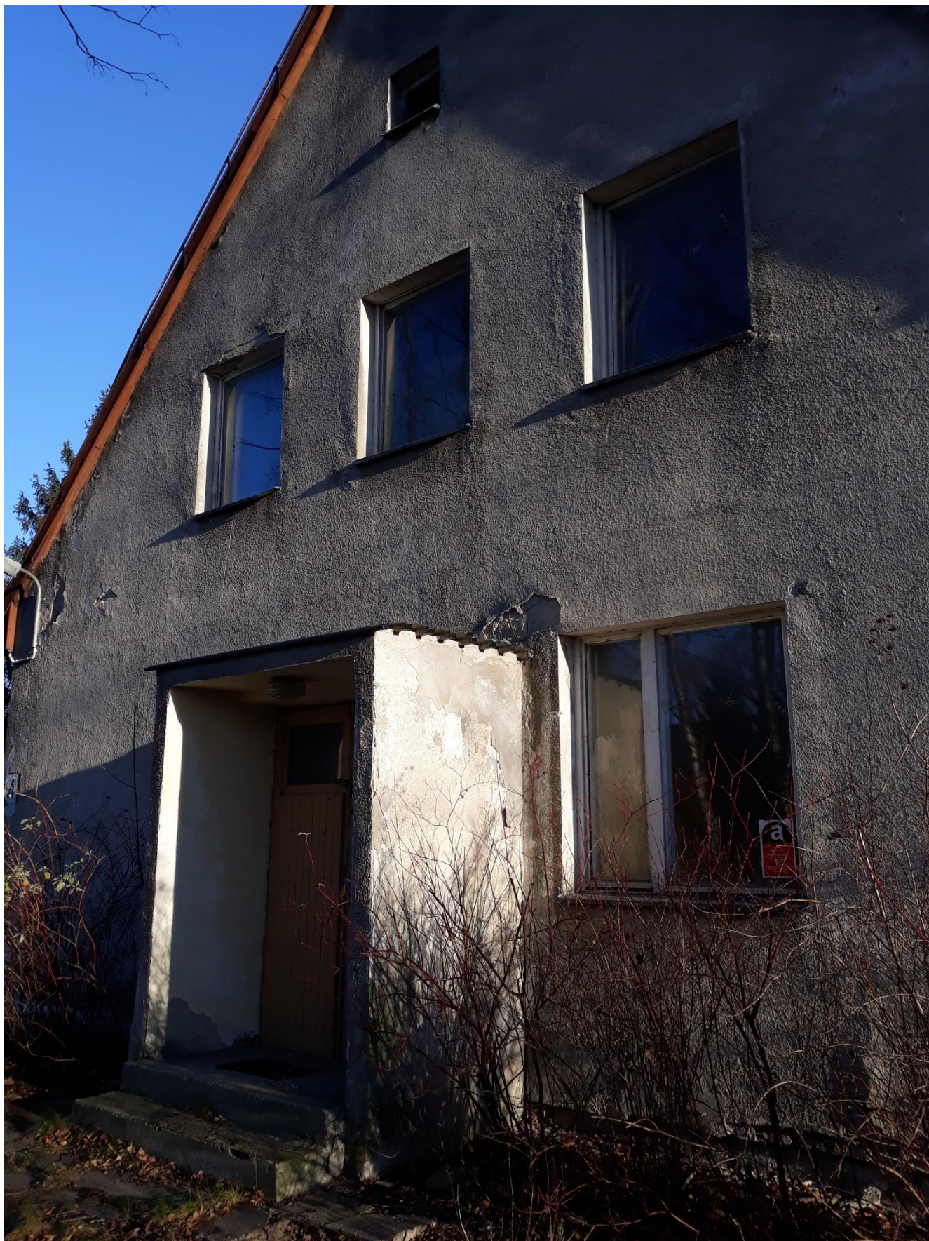
fot.5 Uszkodzenia w strefie wejściowej do budynku