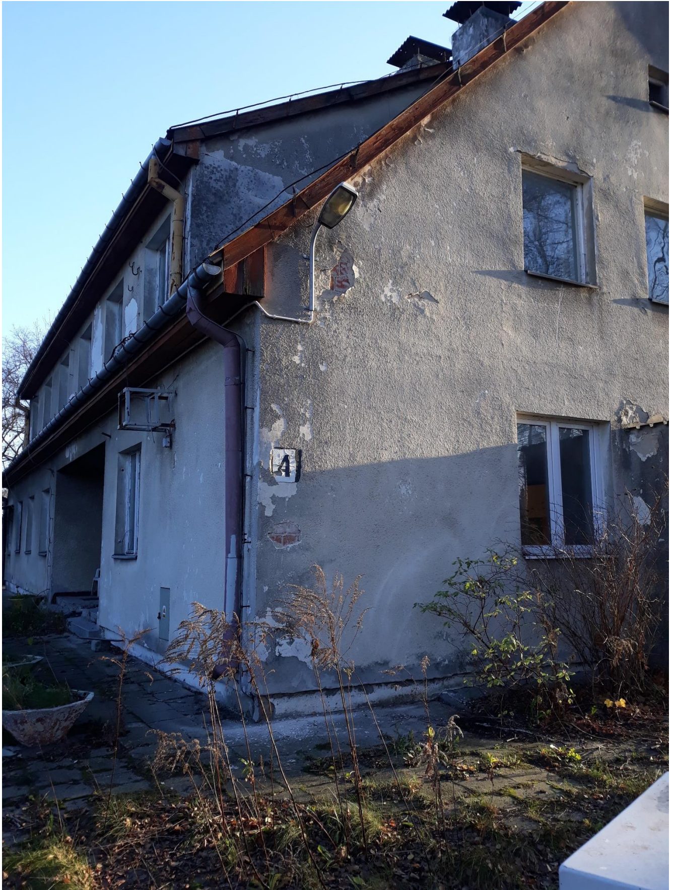
fot.6 Widok narożnika budynku. Uszkodzenia i odspojenia tynków.