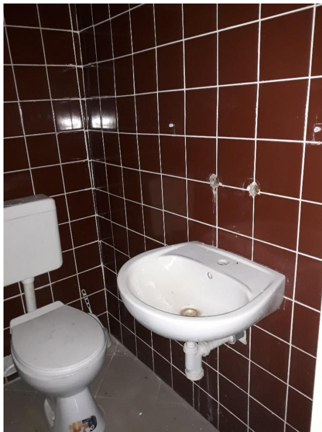
fot.15 Braki armatury instalacji wodociągowej