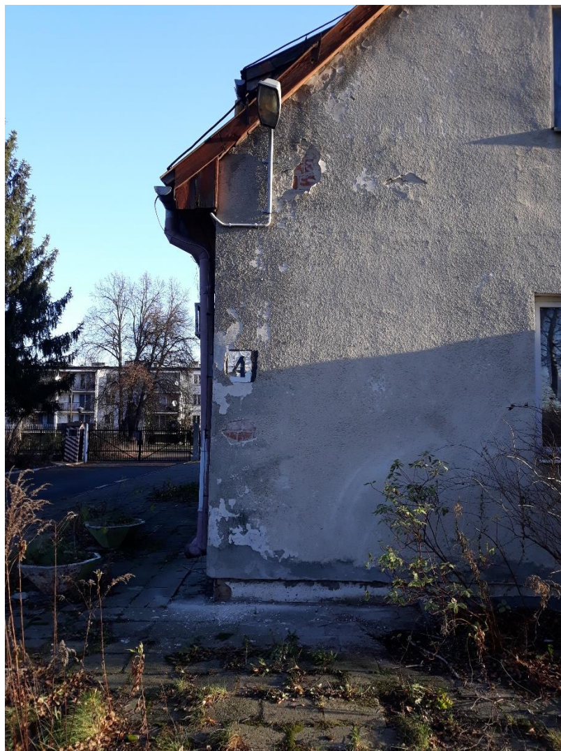
fot.4 Widok narożnika budynku – widoczne uszkodzenia i przebarwienia tynków