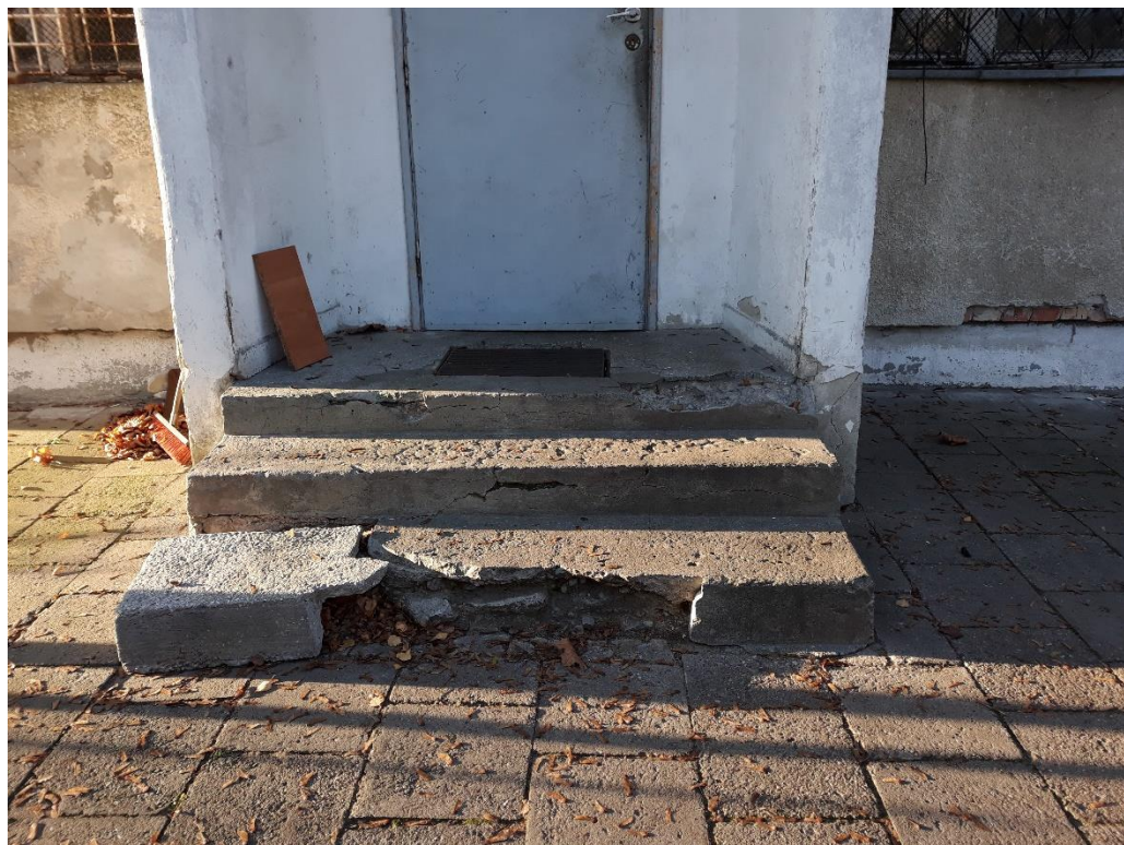
fot.11 Uszkodzenia schodów przy wejściu bocznym