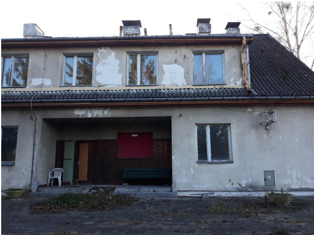
fot.8 Strefa wejścia głównego. Widoczne pokrycie dachowe – eternit, oraz uszkodzenia zewnętrznych wypraw tynkarskich