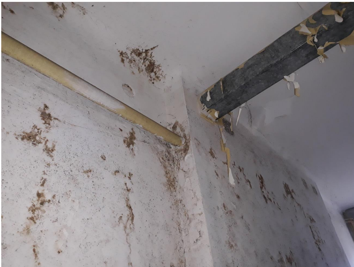
fot.17 Widoczne uszkodzenia wypraw malarskich i tynkarskich. Nieprawidłowe rozwiązania techniczne instalacji kanalizacji sanitarnej oraz wentylacji grawitacyjnej