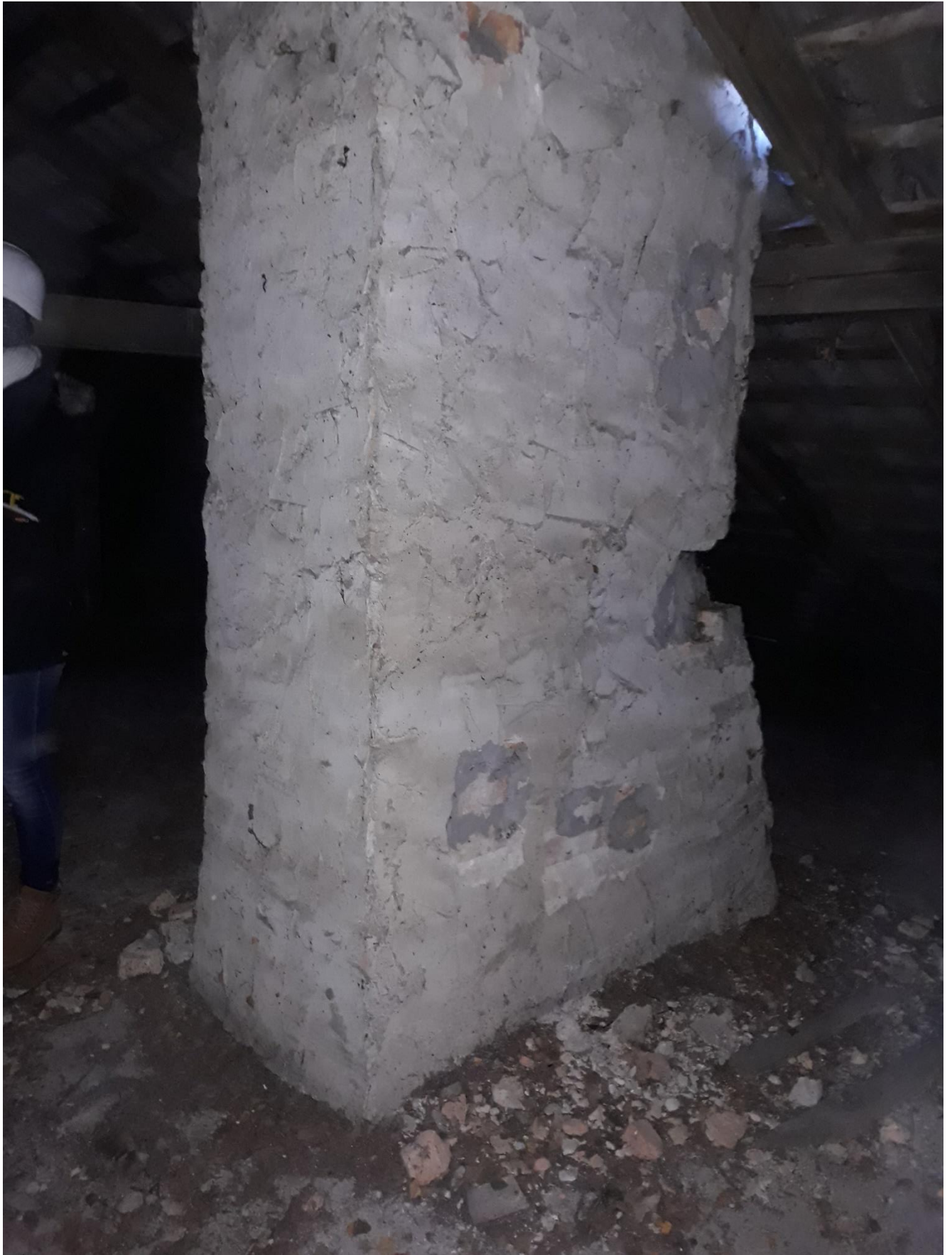
fot.21 Uszkodzenia przewodów kominowych na poziomie poddasza