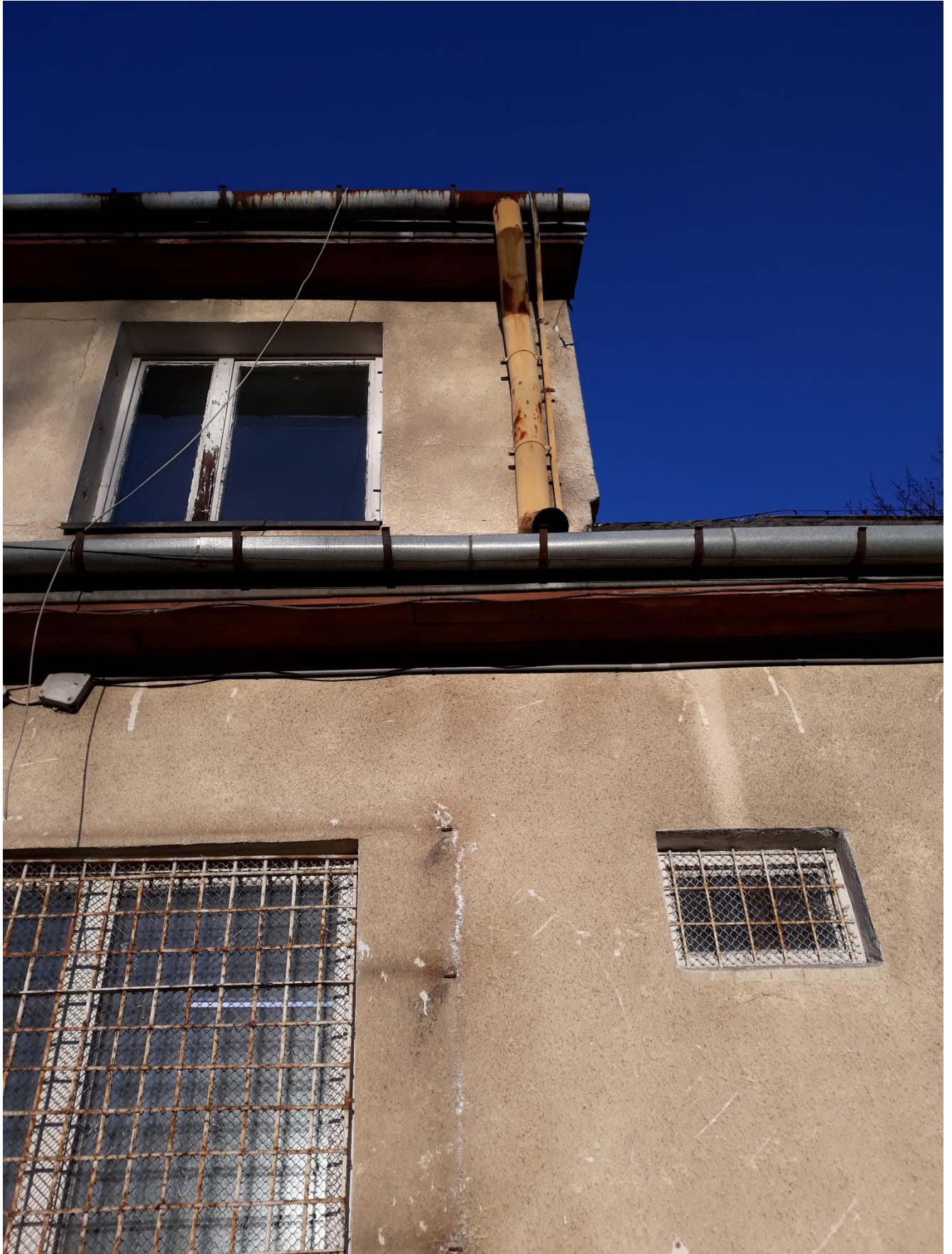
fot.2 Widoczna korozja rynien i rur spustowych. Uszkodzenia powłok drewnianej stolarki okiennej