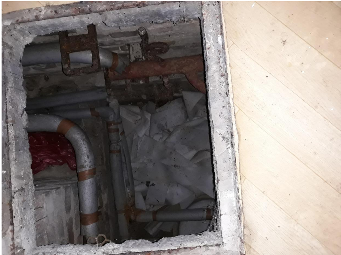
fot.13 Widoczna korozja instalacji centralnego ogrzewania w kanale technicznym pod budynkiem