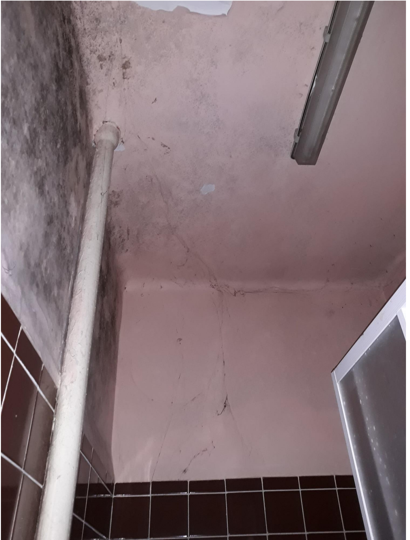
fot.16 Widoczne ślady przemarzania oraz żeliwne przewody instalacji kanalizacji sanitarnej