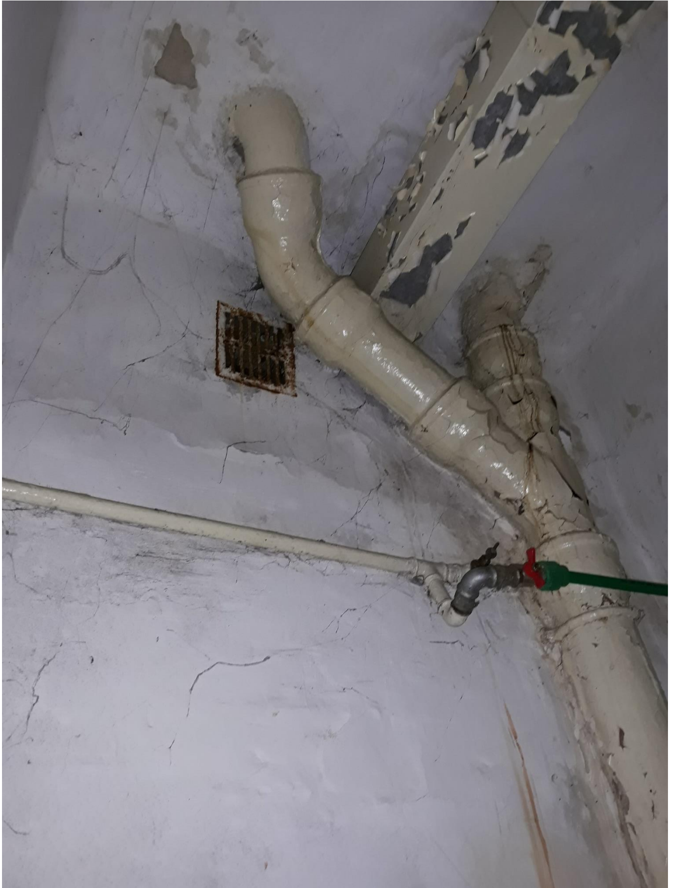
fot.27 Widoczna żeliwna instalacja kanalizacji sanitarnej oraz uszkodzenia wypraw tynkarskich