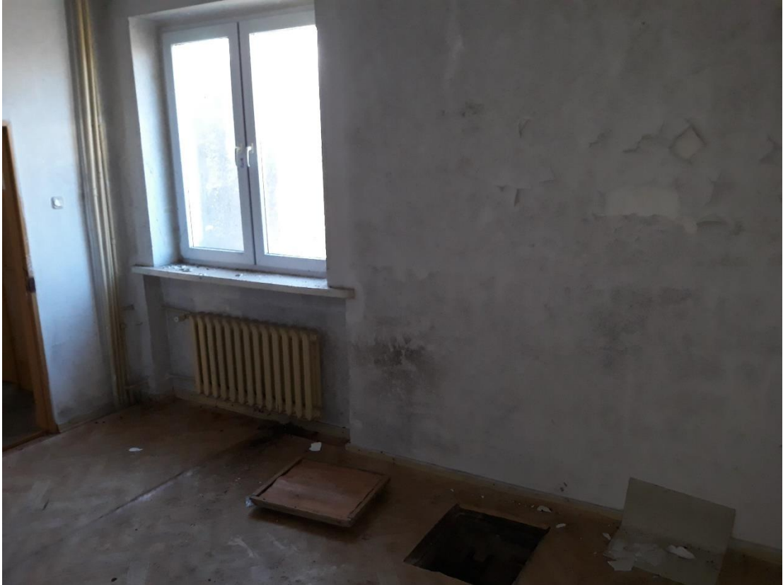
fot.12 Widoczna ślady przemarzania na ścianie zewnętrznej budynku.