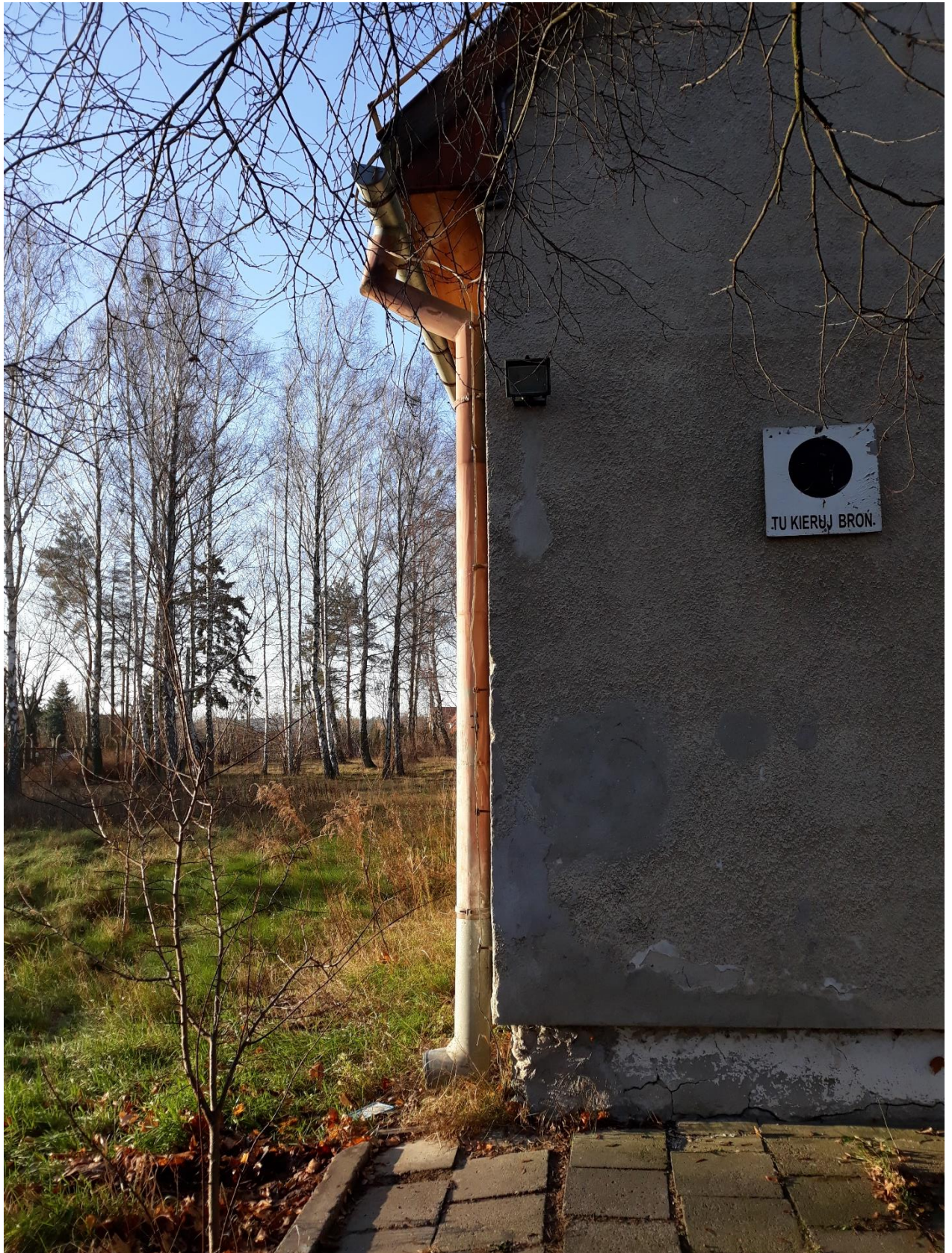
fot.1 Widok narożnika budynku – uszkodzenia tynków w strefie przycokołowej