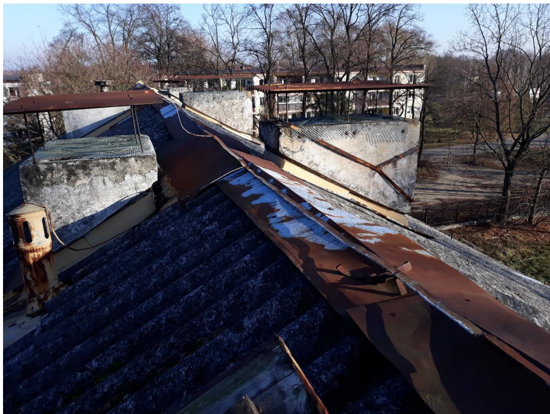
fot.25 Widok połączenia dachowej w rejonie kalenicy – widoczne uszkodzenia czapek kominów oraz korozja obróbki blacharskiej kalenicy