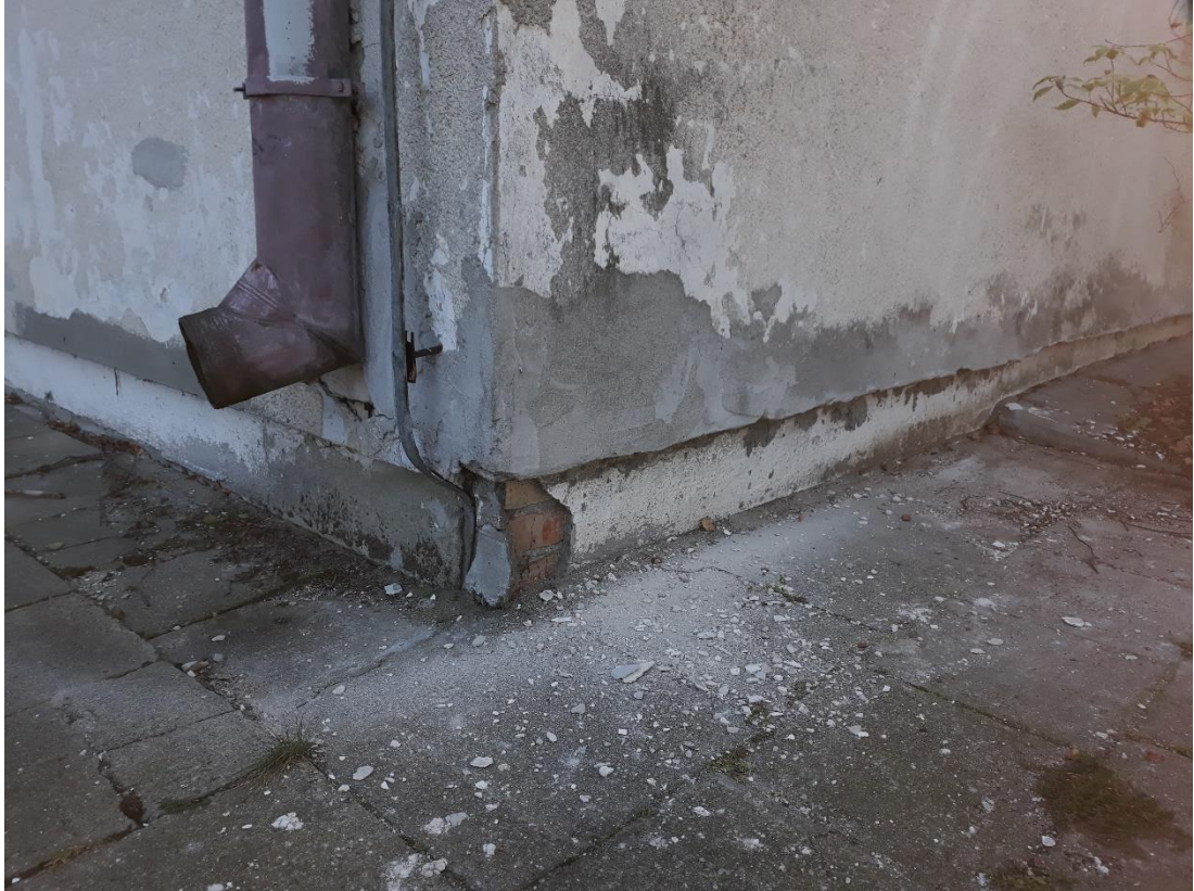
fot.7 Widoczny uszkodzenia strefy przycokołowej