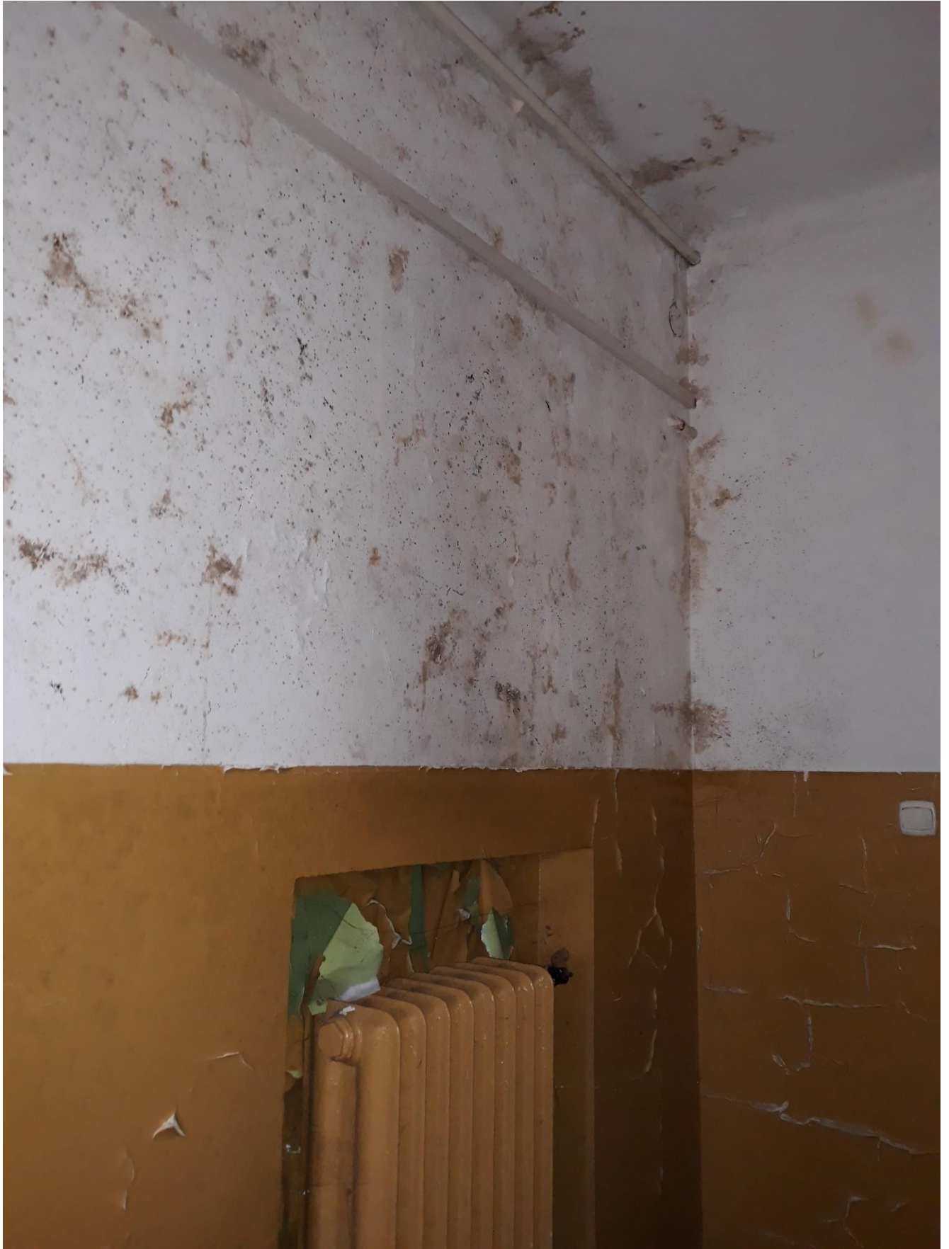
fot.20 Widoczne uszkodzenia i złuszczenia wypraw wewnętrznych