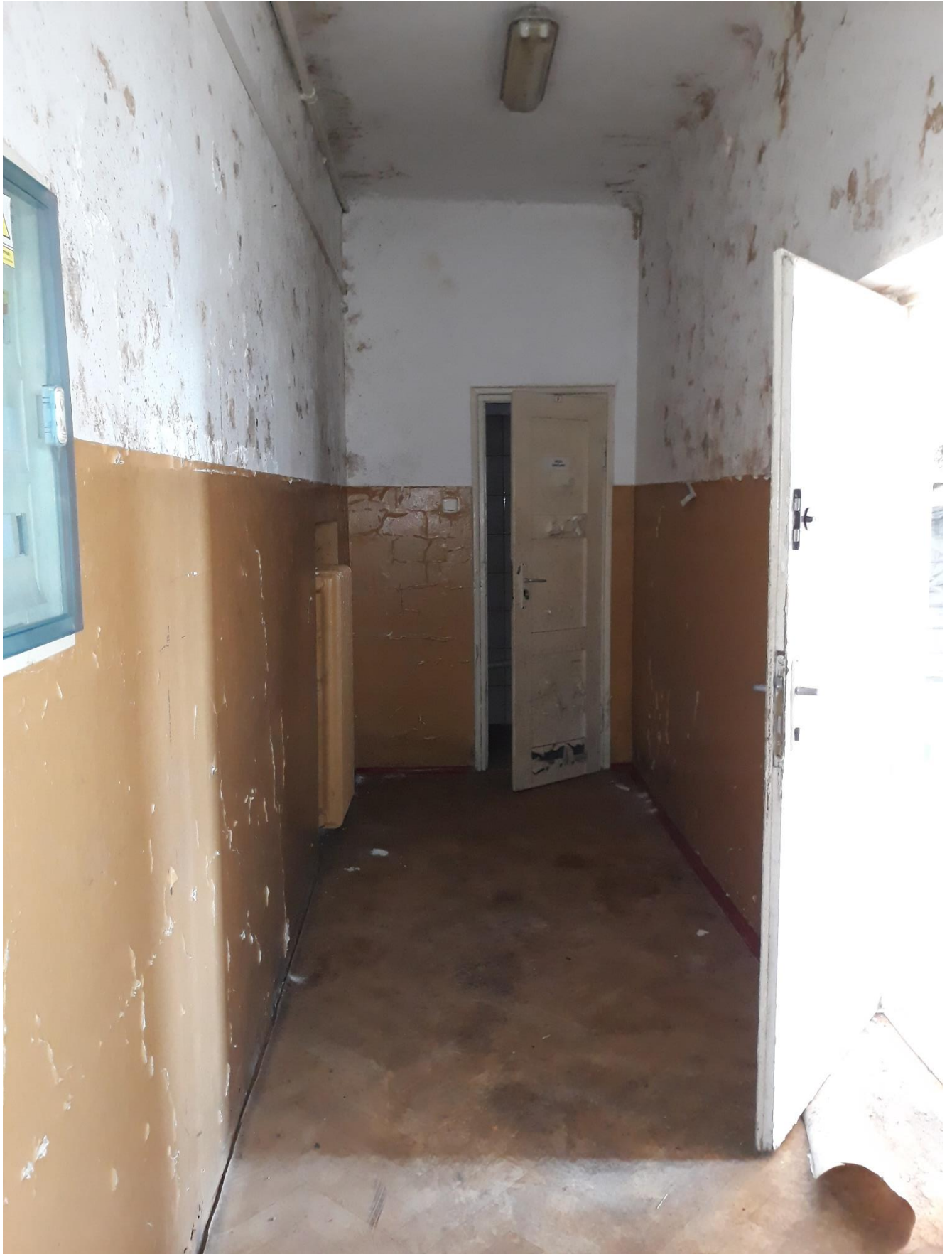
fot.19 Widoczne uszkodzenia i złuszczenia wypraw wewnętrznych