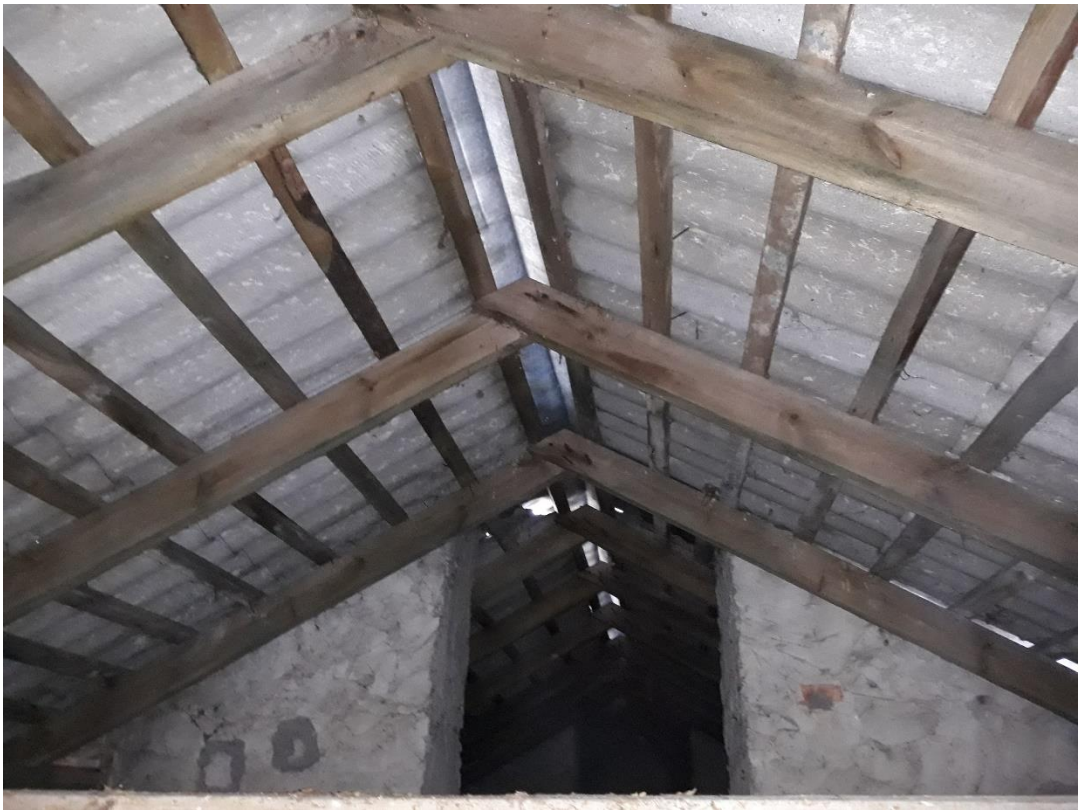
fot.24 Ogólny widok więźby dachowej