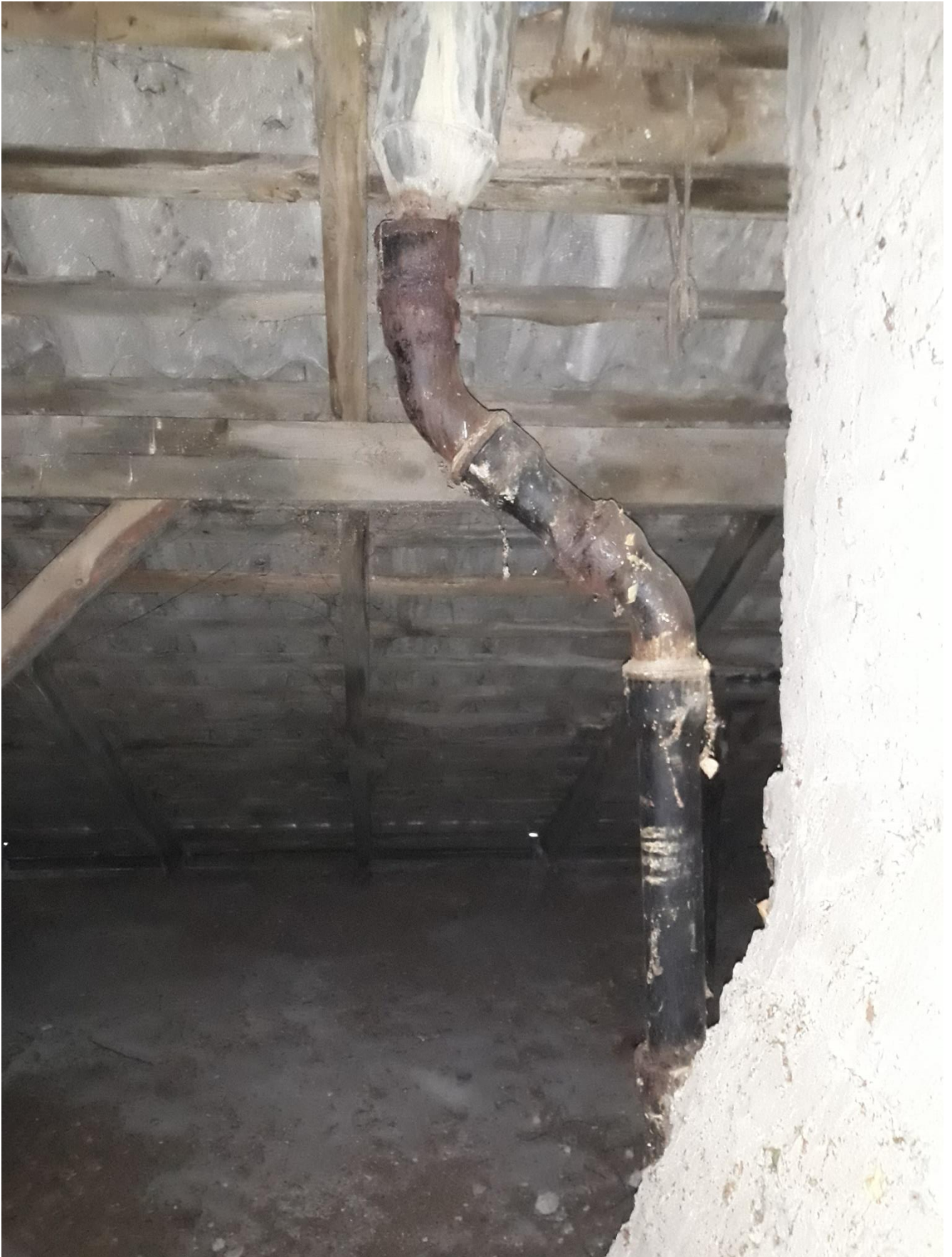
fot.22 Źeliwne odpowietrzenie pionów kanalizacji sanitarnej