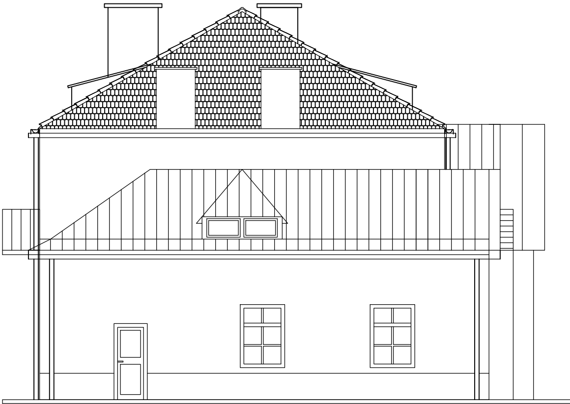
ELEWACJA PÓŁNOCNA Skala 1:100