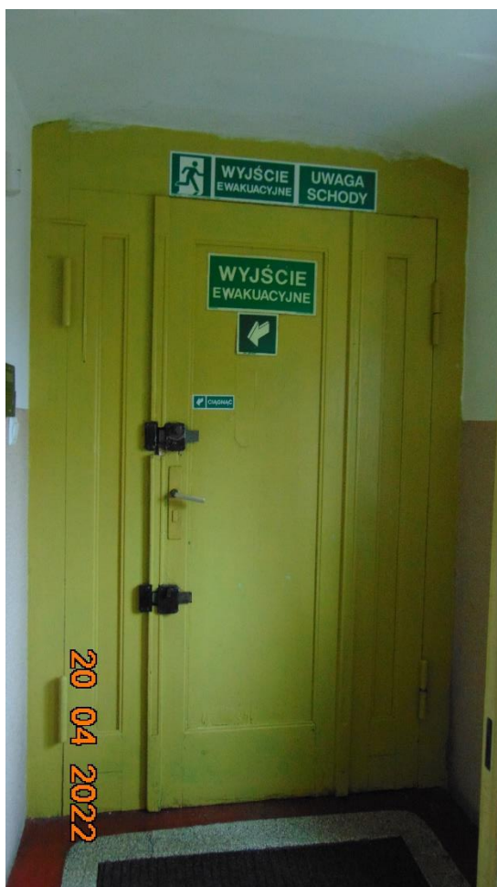
Rys. 3 Drzwi wejściowe