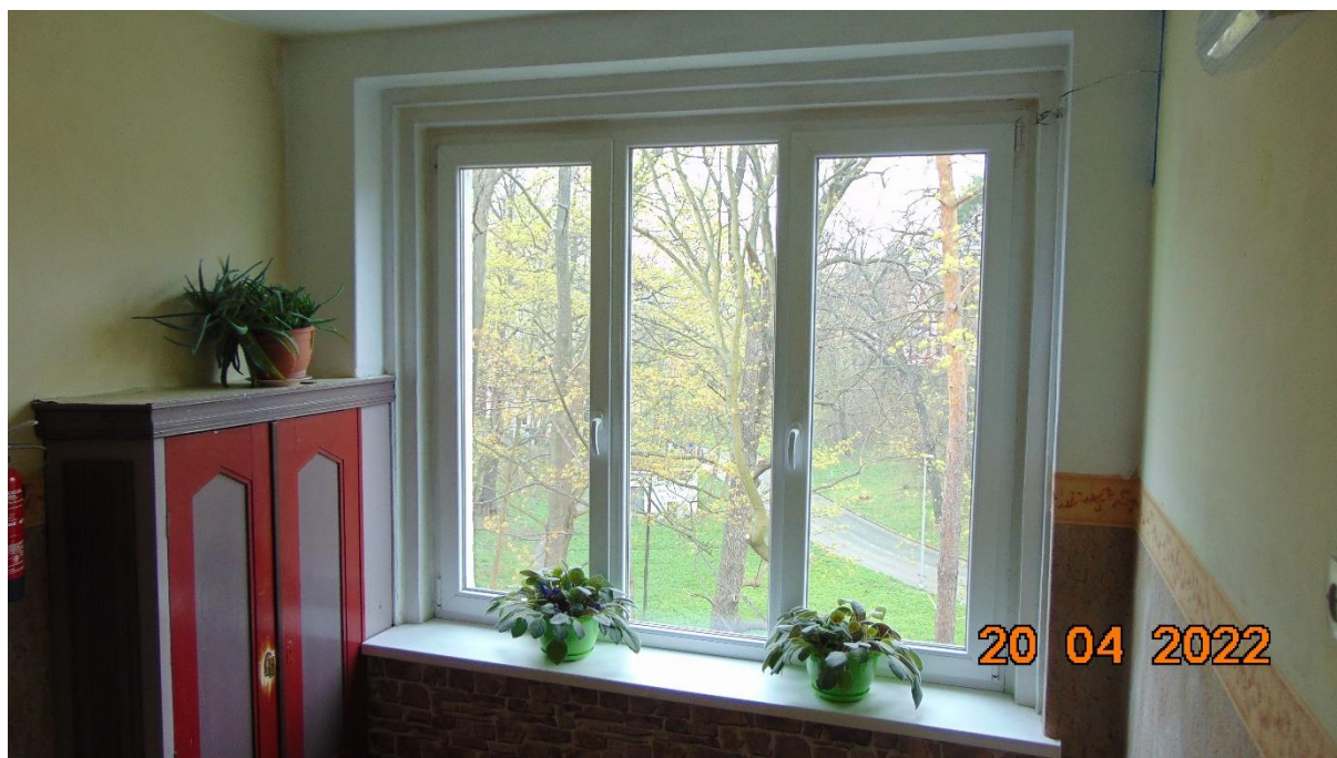
Rys. 2 Okno, na którym należy zamontować siłownik