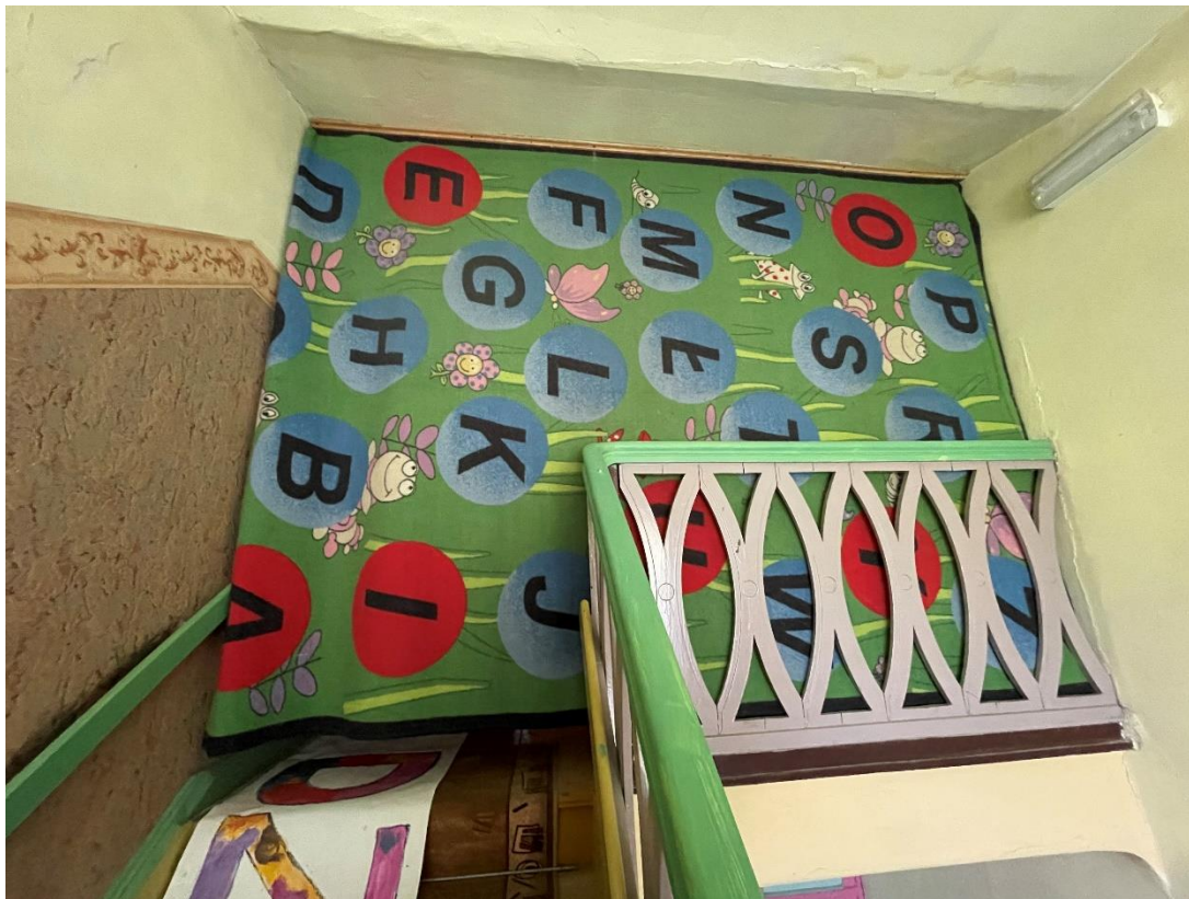
Rys.1 Ścianki do demontażu