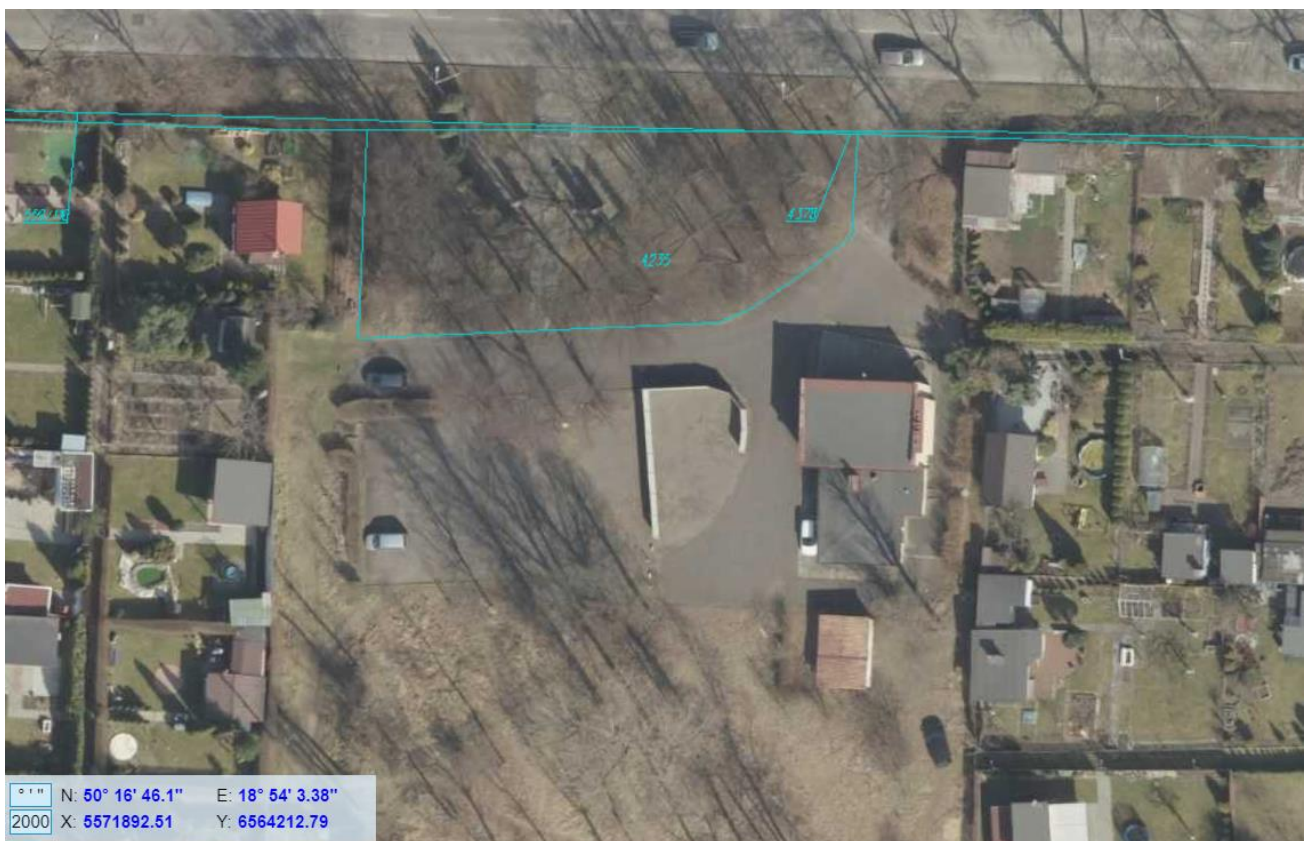
rys. 1 – Lokalizacja istniejącego miejsca pamięci

Na terenie położonym za pawilonem ROD, w części południowej, należy przewidzieć wydzielone wizualnie miejsce składowania odpadów ROD oraz ogólnodostępny parking.