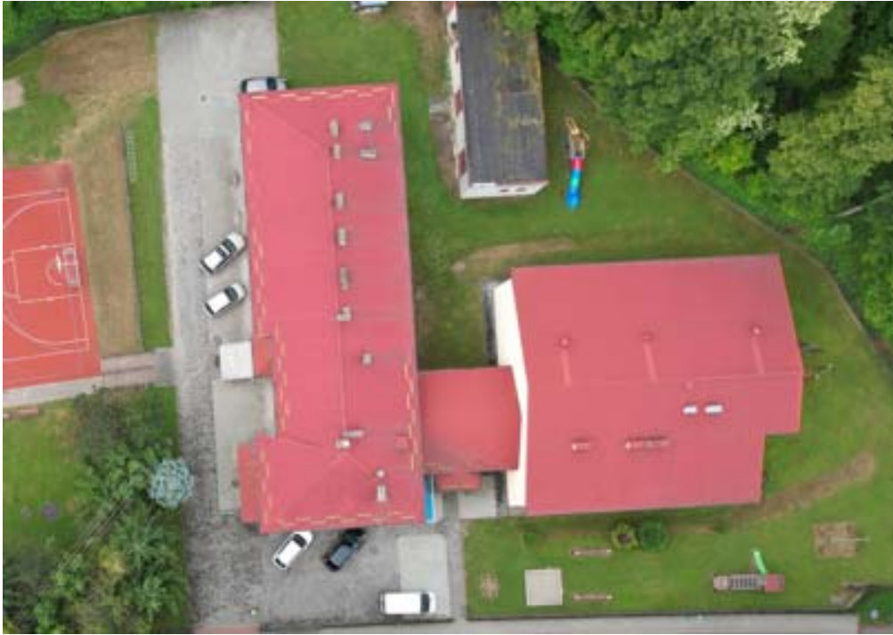
Zdjęcie przedstawiające przedmiotowy obiekt