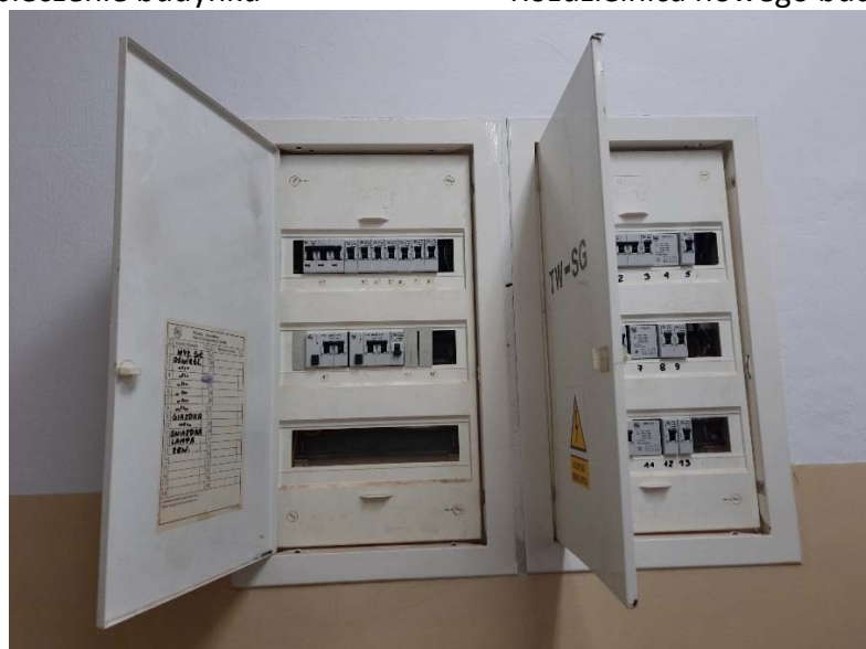
Rozdzielnica starego budynku