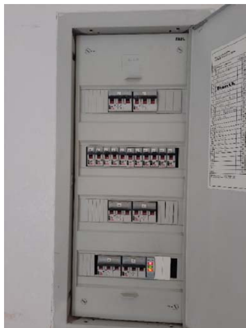
Rozdzielnica nowego budynku