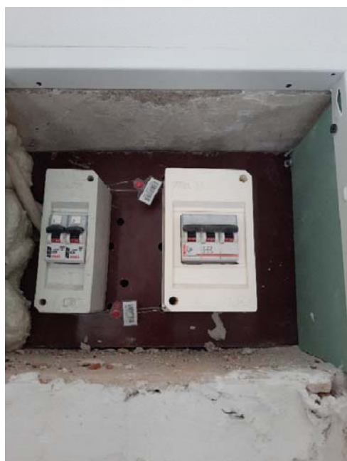
Główne zabezpieczenie budynku

Budynek zasilany linią napowietrzną. Aktualna moc przyłączeniowa dla obiektu wynosi 34 kW.