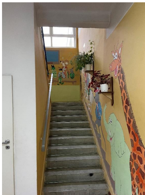
Zdjęcie : Wnętrze obiektu przedszkola