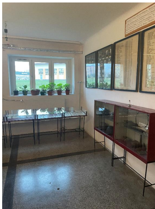
Zdjęcie : Wnętrze obiektu szkoły.