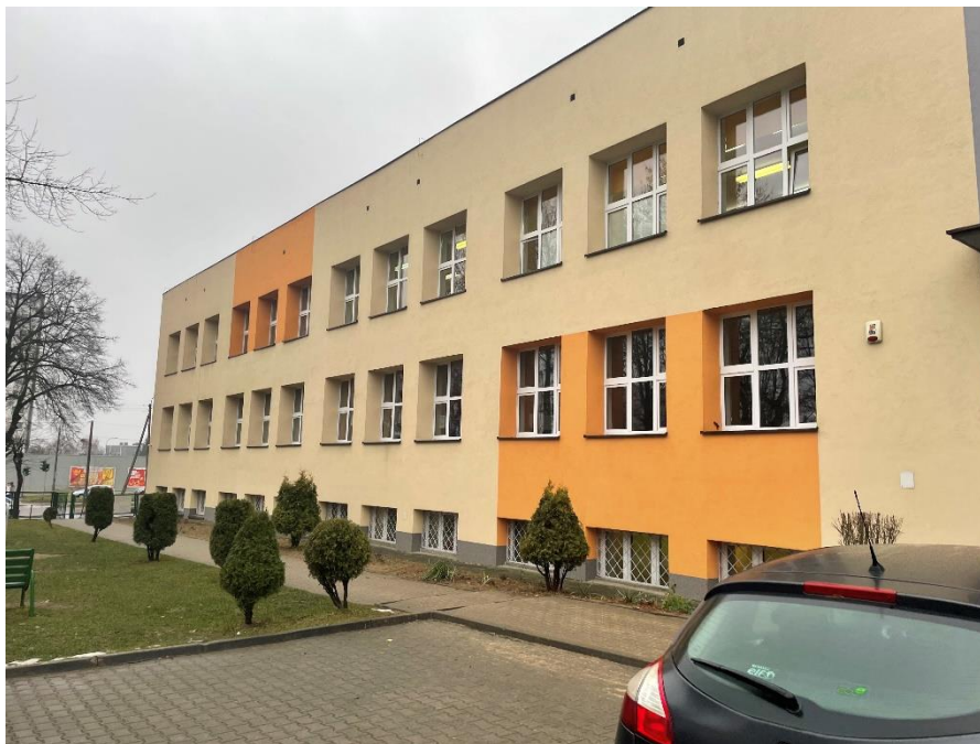
Zdjęcie : Budynek szkoły