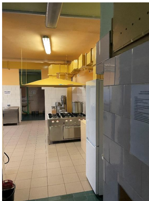
Zdjęcie : Wnętrze obiektu przedszkola