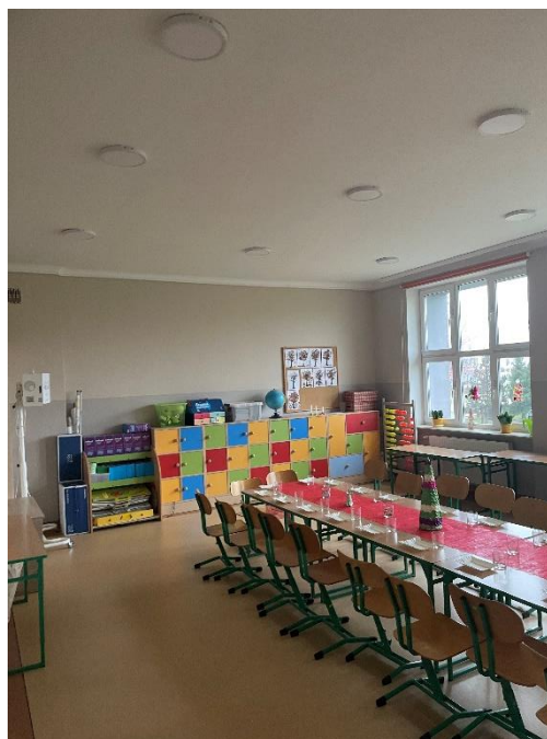
Zdjęcie : Wnętrze obiektu szkoły