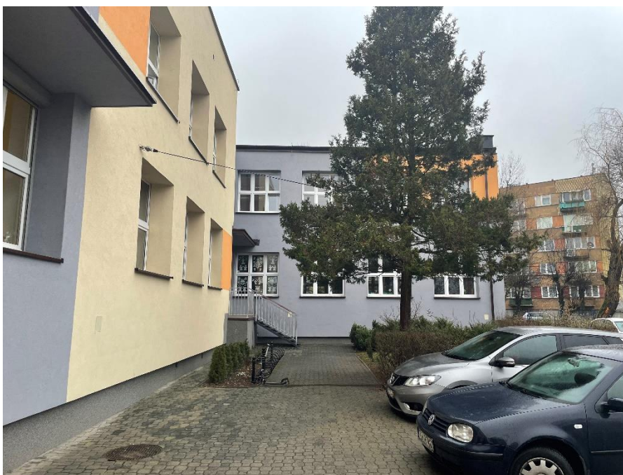
Zdjęcie : Budynek szkoły