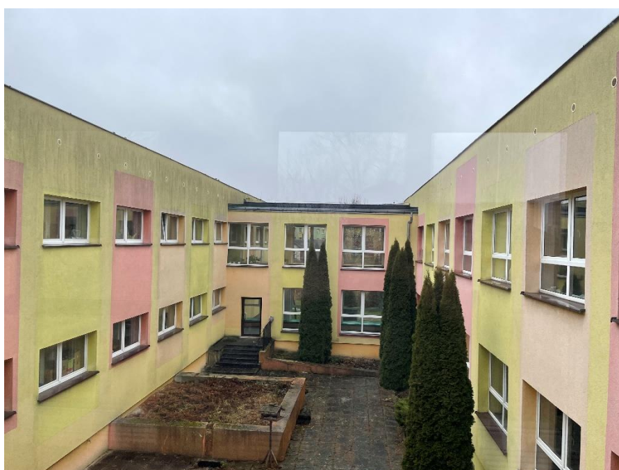
Zdjęcie : Budynek przedszkola