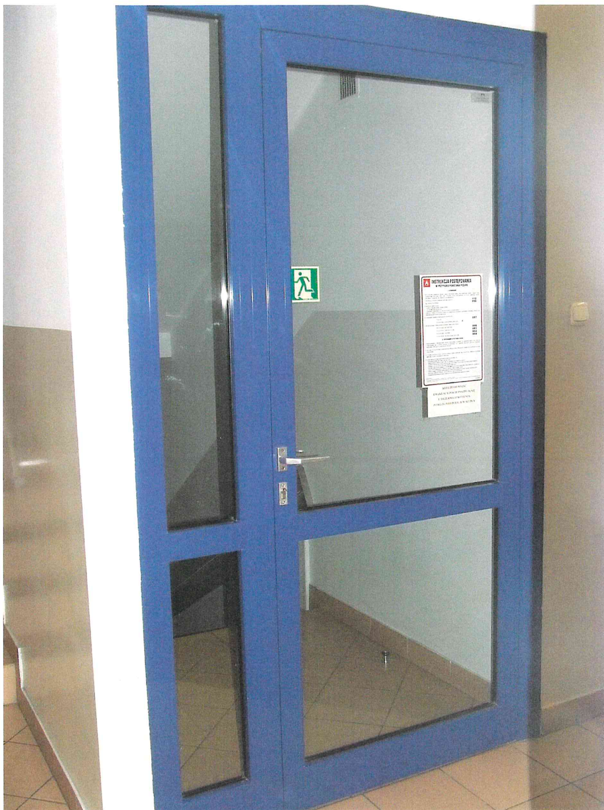
foliowania P-1 Drzwi przy pom. 7 na klatkę