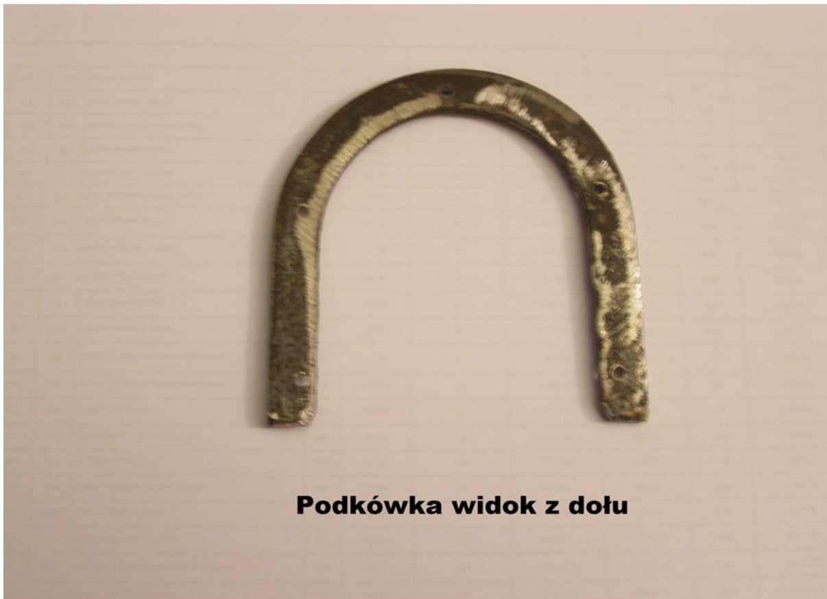
Podkówka widok z dołu