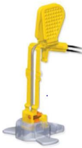
igła ze skrzydełkami