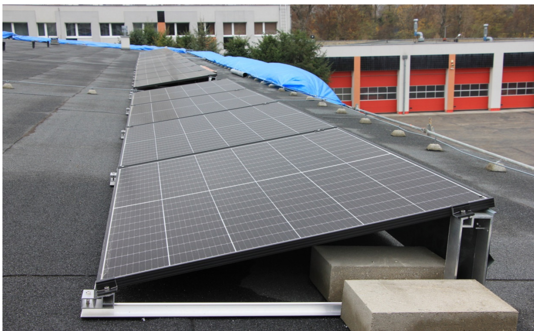
Rys.2 Istniejąca instalacja wraz z miejscem do rozbudowy.