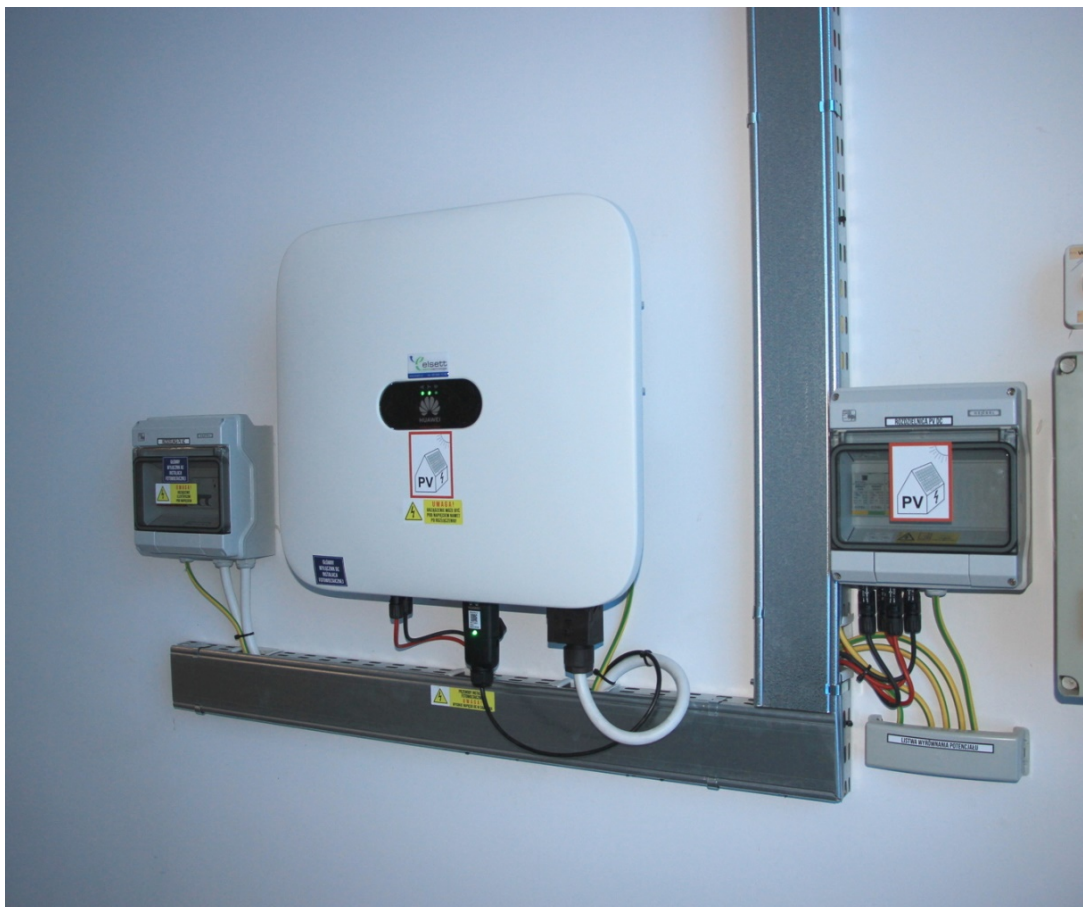
Rys. 3. Istniejąca instalacja wraz z miejscem do montażu magazynu energii.