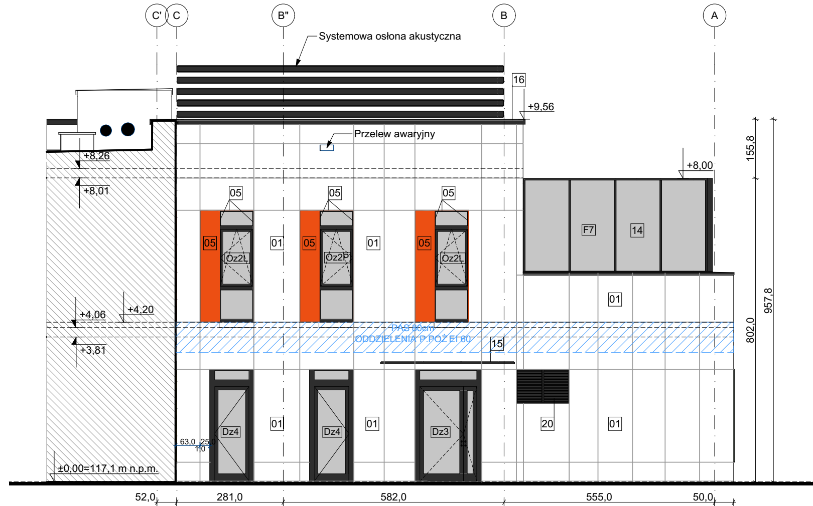
E-06 Elewacja południowa wewn. 1:100