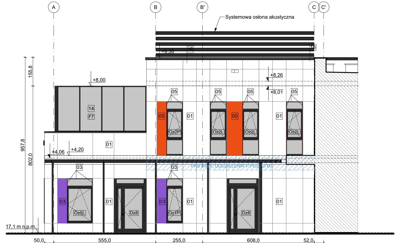
E-05 Elewacja północna wewn. 1:100