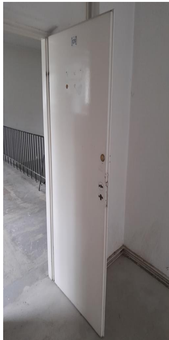
Zdjęcie 3. Widok wewnętrznej stolarki drzwiowej