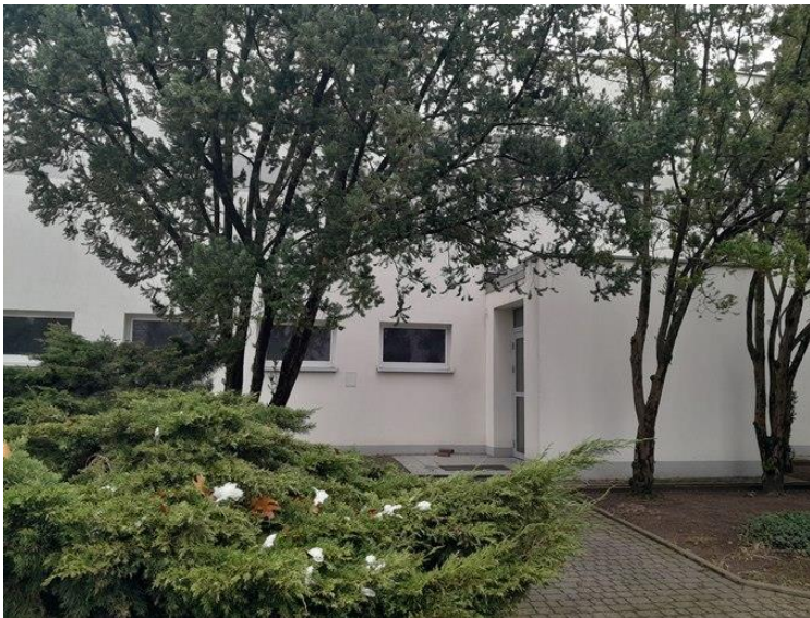
Zdjęcie 1. Wejście do budynku nr 1