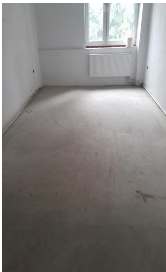
Zdjęcie 4, Widok pomieszczenia biurowego