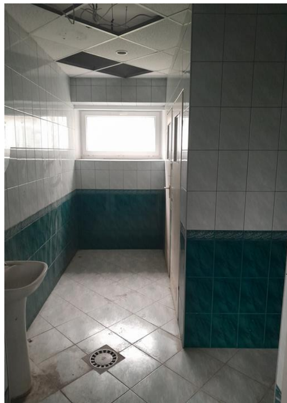
Zdjęcie .9 Widok pomieszczenia higieniczno – sanitarnego – - parter