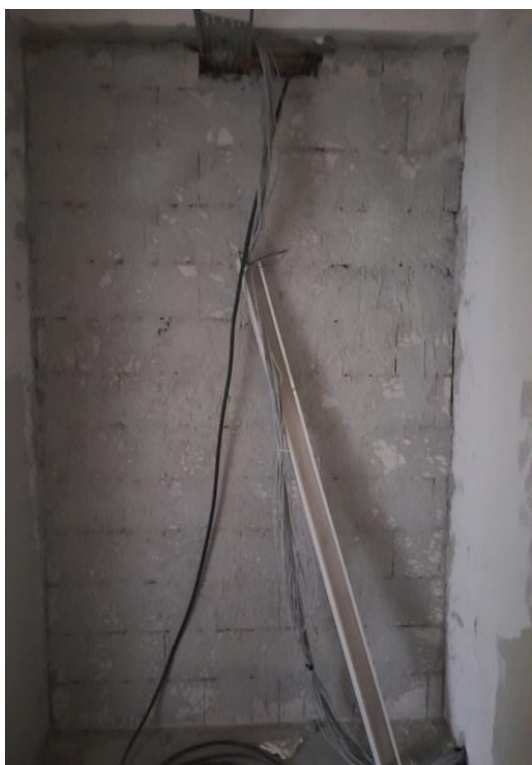
Zdjęcie 6. Ścianka działowa korytarz - 1 piętro