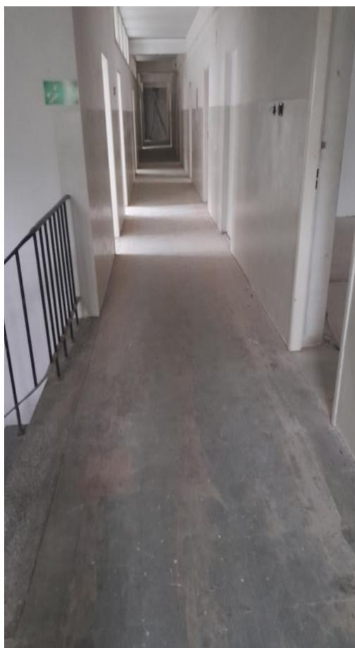
Zdjęcie 5. Widok korytarza - 1 piętro