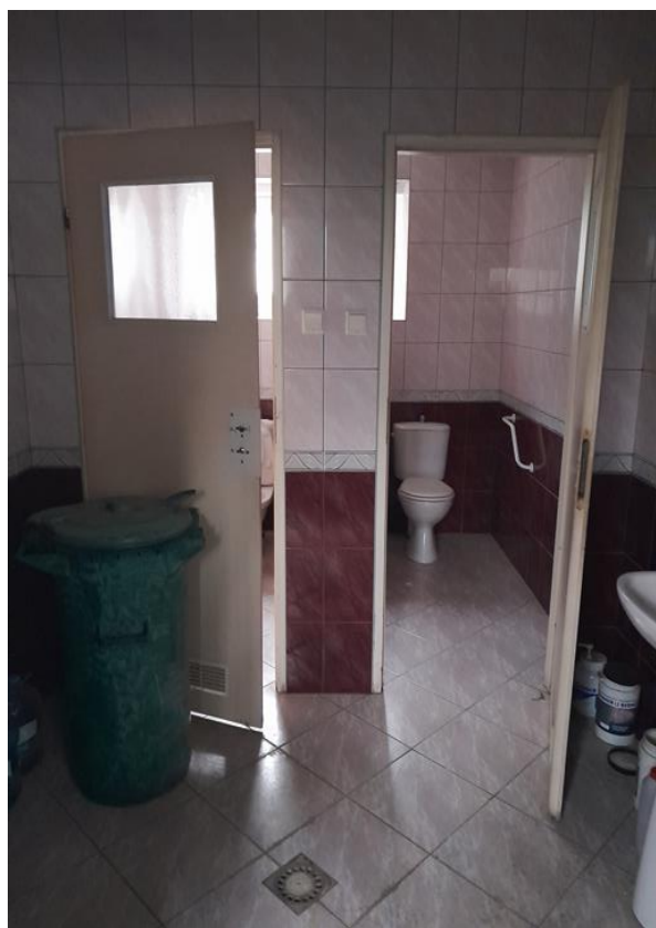
Zdjęcie 10. Widok pomieszczenia higieniczno – sanitarnego - parter