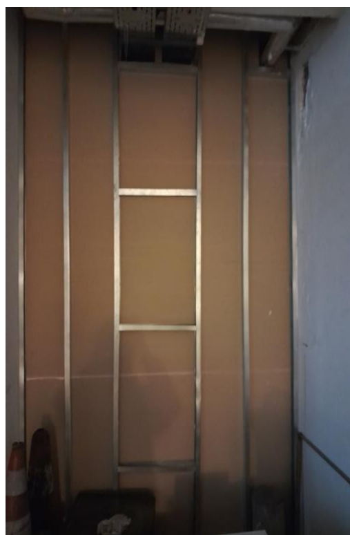
Zdjęcie 7. Ścianka działowa korytarz - parter