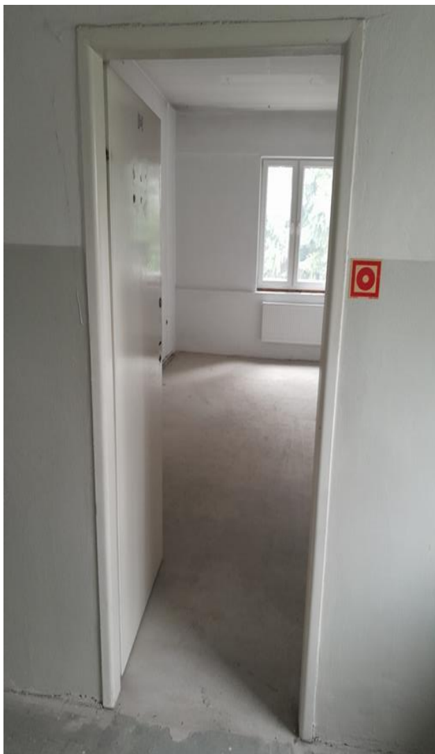
Zdjęcie 2. Widok ościeżnicy