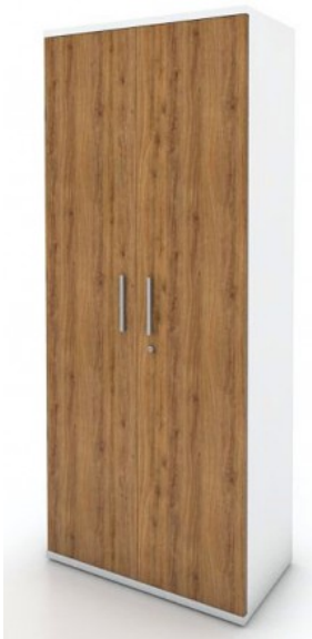
Szafa 80, 4 półki, drzwi pełne, zamek baskwilowy

S 5/7 – szafa o wymiarach 80x43x192,7cm z 4 półkami.