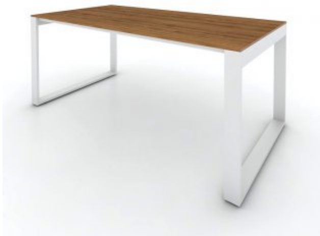
BR131 - biurko pracownicze 160,4x80,4x73,2cm opierane jednostronnie o komodę.