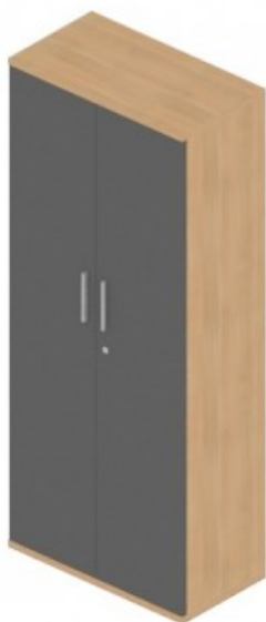
Szafa ubraniowo-aktowa 80, (podział 1/3, 2/3), 4 półki, drzwi pełne, zamek baskwilowy