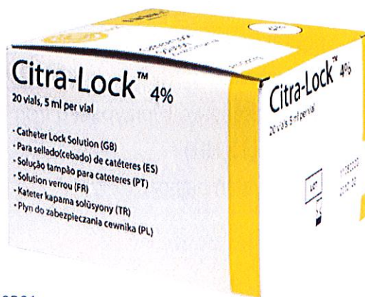
Pudełka zawierają 20 fiołek po 5 ml